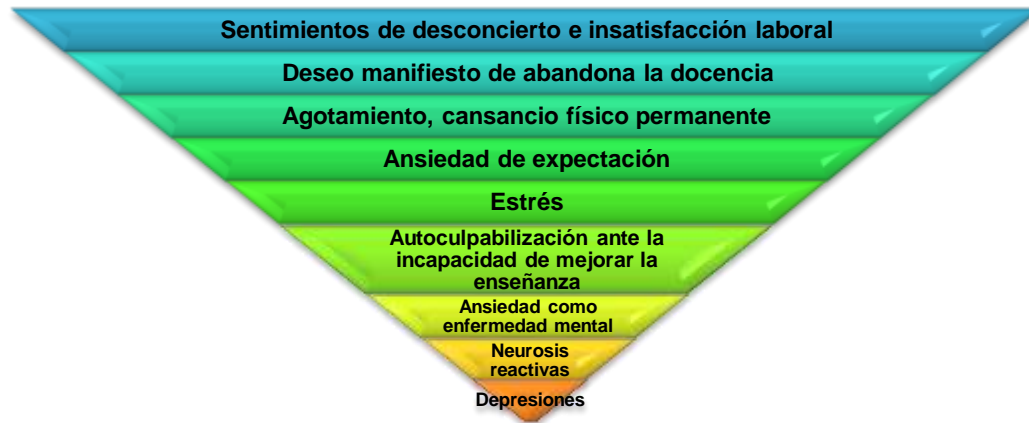
Figura 3.1: “Graduación de tensiones en docentes”

Fuente: Esteve, J. (1994). El malestar docente. Barcelona: Laia.