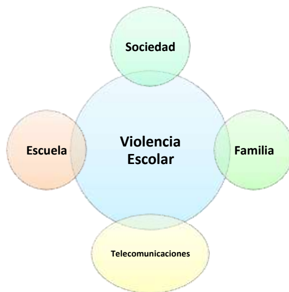
Figura 2.2 “Factores que intervienen en la violencia”

En cierto modo la violencia escolar es una acción que se aprende y de la cual la sociedad es responsable, por lo tanto, es necesario mencionar que la violencia escolar, debe de considerarse como heterogénea, ya que está permeada de múltiples factores tanto sociales como personales, que los alumnos, docentes y autoridades escolares llevan a las instituciones.