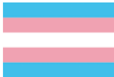
Bandera del Orgullo trans

Esta bandera fue creada con tres franjas de los siguientes colores: magenta que hace referencia a la homosexualidad, siguiendo con el azul como la heterosexualidad y el violeta como mezcla de ambas orientaciones.