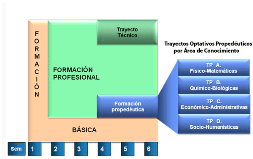
Imagen 1 Núcleos de formación, tomado del "Modelo Académico Conalep 2017"

Respecto a la formación profesional en este núcleo se plantea un desarrollo de competencias laborales para realizar las funciones productivas que el sector productivo demanda, es aquí donde se integran los trayectos técnicos que son los momentos en los cuales se proporcionará al alumno la formación específica dentro de la carrera y que esta comienza en el cuarto semestre, los módulos impartidos tienen una relación directa con la carrera de formación.