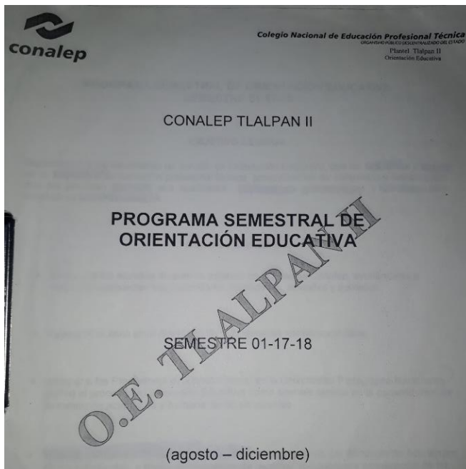
Imagen 6 Carátula tomada de el “Programa Semestral De Orientación Educativa” Conalep Tlalpan II Semestre 01-17-18.

La estructura del programa de orientación educativa correspondiente al semestre 1.17.18 quedó de la siguiente manera.