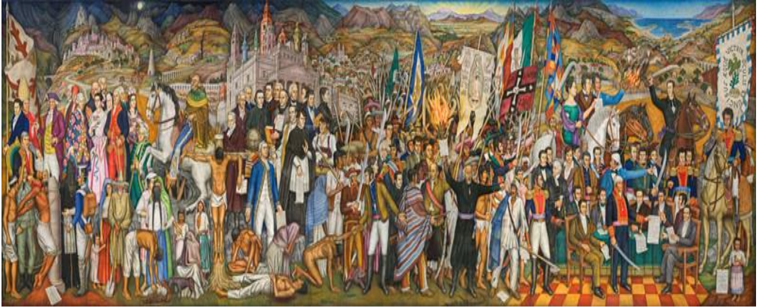
Imagen del mural “Retablo de la Independencia”