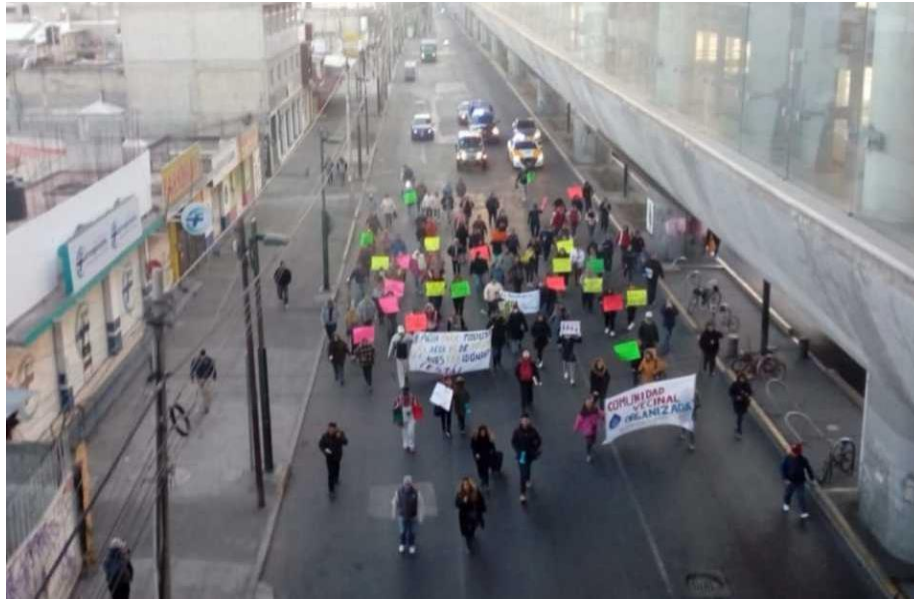
Figura 4. Los automovilistas son desviados hacia avenida La Turba