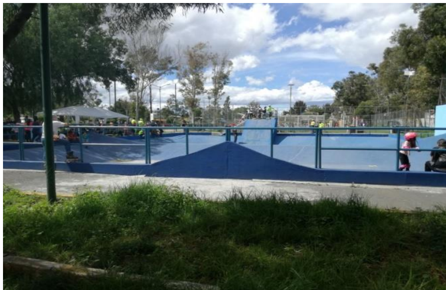
Figura 6. Skatopista

Dentro del parque se pueden ubicar canchas de fútbol, basquetbol, un kiosco, juegos infantiles, sillas, asadores y mesas de concreto, gimnasio al aire libre, pista para patinetas (skatopista) y diversas áreas verdes.