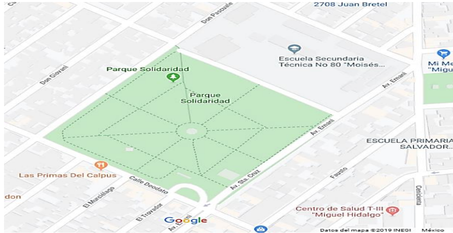
Figura 5. Mapa de ubicación del parque Solidaridad