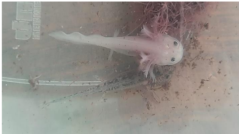
Figura 3. Imagen de ajolotes

En Tláhuac podemos encontrar 7 pueblos prehispánicos originarios que todavía conservan sus tradiciones y realizan fiestas típicas, que dicho sea de paso, son costumbres muy arraigadas entre los tlahuacenses.