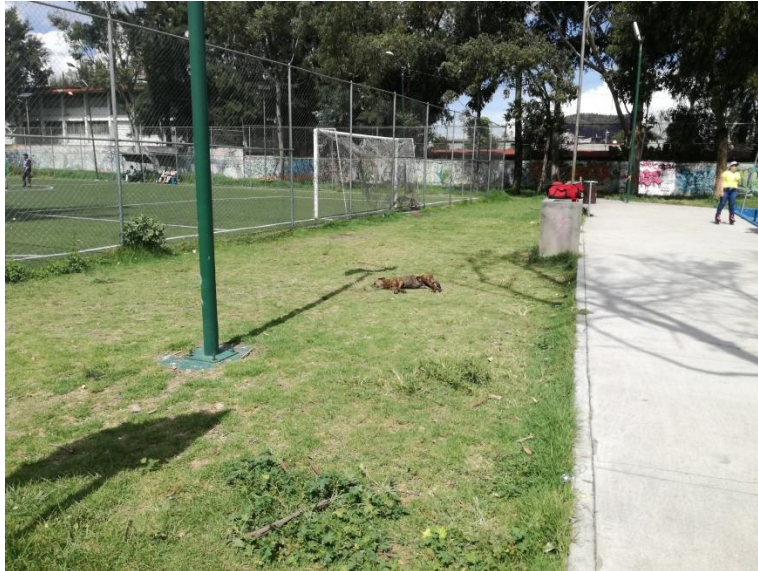
Figura 8. Parque Solidaridad.

Los sujetos que asisten al parque Solidaridad son en su mayoría vecinos de la colonia Miguel Hidalgo en la alcaldía Tláhuac, mismos que asisten a realizar diversas actividades en el parque muchos acompañados de sus mascotas, se relacionan de manera cordial entre ellos, sin embargo muestran poca preocupación o nulo conocimiento de la normatividad vigente en cuanto al cuidado y trato de sus mascotas muchos deambulan en el parque sin placa o correa apareándose sin regulación alguna aumentando la población canina dentro del parque y generando diversos problemas de salud como heces fecales regadas por el parque o basura tirada.