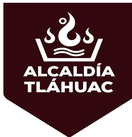
Figura 1. Escudo de la alcaldía

La palabra Tláhuac, es de origen prehispánico y resulta ser parte de los términos que se han incorporado al español que se habla en México; Tláhuac tiene como significado “tierra que emerge” haciendo referencia a una región del valle de México que fue fundada sobre agua por los chichimecas aproximadamente hace 900 años. En 1929, esta área territorial, se constituyó como delegación del Distrito Federal, ahora forma parte de las 16 alcaldías de la Ciudad de México; se encuentra ubicada al sureste de la misma, colinda con la alcaldía Iztapalapa al noreste, Milpa Alta al sur y Xochimilco al poniente, ocupa una superficie de 95.58 km 2 lo que significa el 6.5% del área de la actual Ciudad de México. (Tláhuac. Cuaderno de Información Básica Delegacional, INEGI).