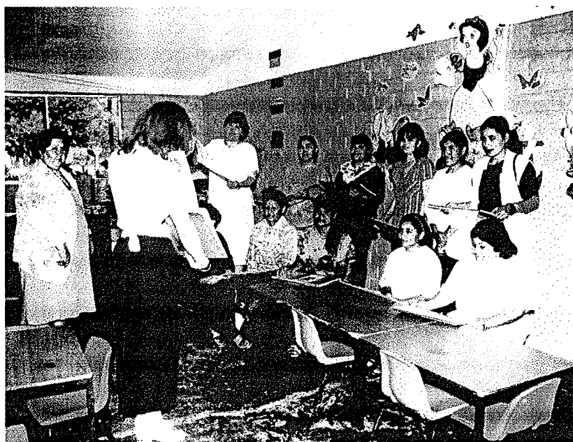
La reunión tiene enfoque de trabajo colegiado

La experiencia en sus trabajos u oficios ayuda para re canalizar acciones como pláticas al respecto, visitas a los trabajos, exploración de materiales; es decir, que los padres de familia puedan dar lecciones o asesorías de acuerdo a sus experiencias ya sea de carpintería, albañilería o cocina. Estos son formas de clase-taller donde se puede participar con los