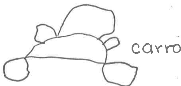
F.1. Realismo Intelectual

A lo largo de la etapa preoperatoria, el niño va tratando de representar cosas con sus dibujos y poco a poco lo hace con más realismo. A esta etapa se le llama Realismo Intelectual y es aquí donde los dibujos que elabora el niño van tomando una semejanza más próxima a lo veraz, pero sin noción de perspectiva en cuanto a la ubicación del objeto.