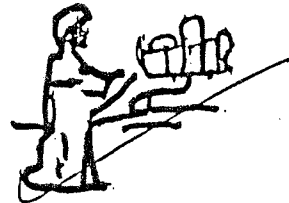
Novles y Señores