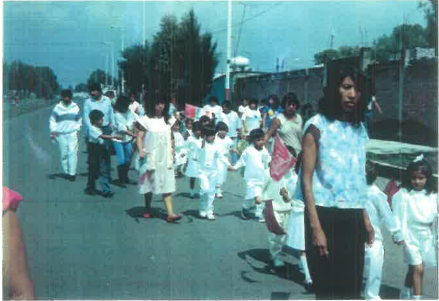
ANIVERSARIO DE INDEPENDENCIA DE MEXICO