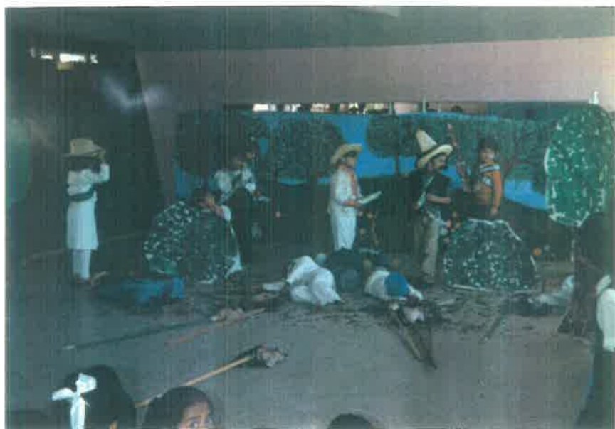
LAS BAJAS SE SUCEDEN EN AMBOS BANDOS