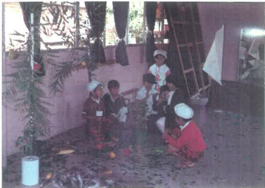
LA NAVEGACION LLEGA A AMERICA