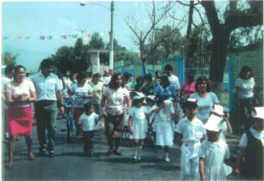
DESFILE CON APOYO DE PADRES DE FAMILIA