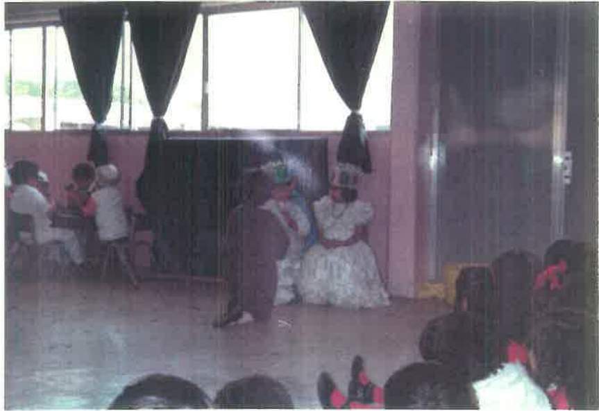
CRISTOBAL COLON SOLICITA AYUDA A LOS REYES