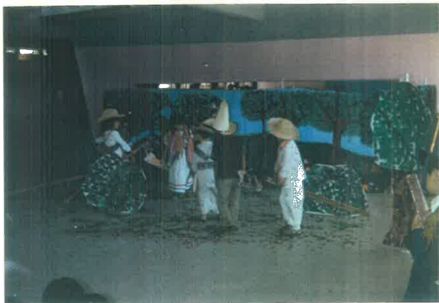
EL PUEBLO SE ORGANIZA