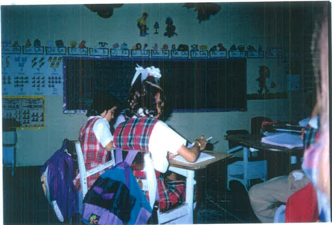
Alumnos de 1er. año "A" de la Escuela México Vespertina durante la aplicación de las técnicas Freinet.