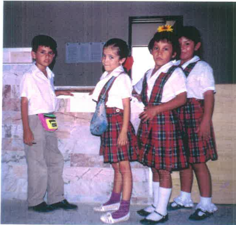
Pase-clase y exposición de textos libres de los alumnos de 1er. año "A" de la Escuela México, turno vespertino.