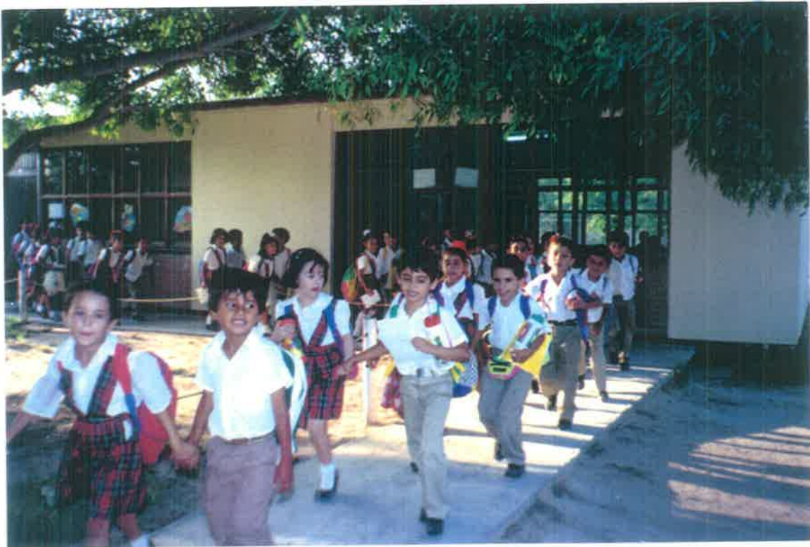
Alumnos de 1er. año "A" de la Escuela México Vespertina durante un paseo clase a los alrededores de la comunidad