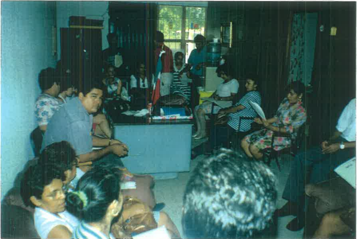
Alumnos de la Generación 1990-1994 en reunión con el Personal Docente de la Escuela México, turno vespertino.