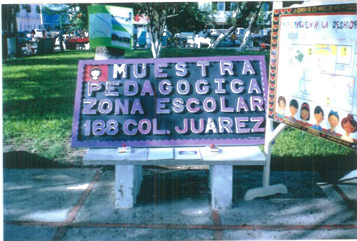
Participación en la I Muestra Pedagógica " Buscando un espacio para mi trabajo escolar".