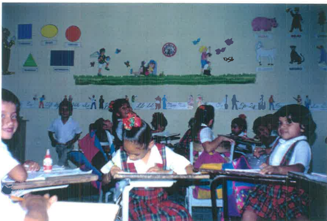
Alumnos de 1er. año "A" de la Escuela México Vespertina.