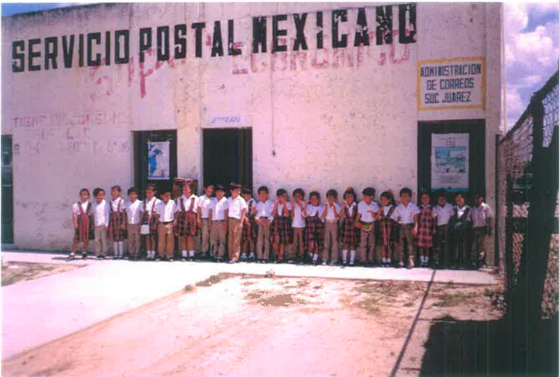
Oficinas de correos y áreas verdes de la Escuela México.