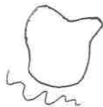
Escritura de pelota

O realizar grafías o pseudografías dentro y/o fuera del dibujo para garantizar el significado aquí se encuentra en el nivel PRESILABICO en donde el niño no ha establecido la relación entre la escritura y los aspectos sonoros del habla.