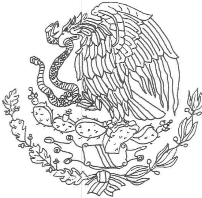
Figura No. 1