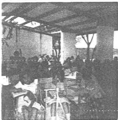
Grupo 3º Año exue s tos a los vientos - y ruidos del tráfi- co por la carretera en la Escuela "Jo-- sé Ma. Morelos y -- Pavón"