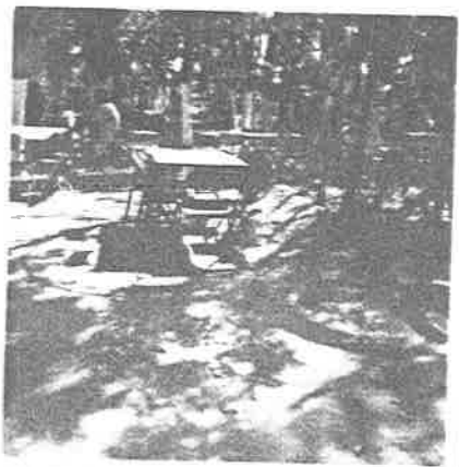
Sitio familiar "El Arroyo de- Comala"