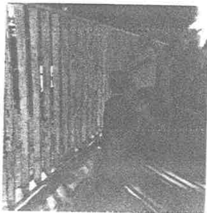
Madres de familia llevando el desayuno a sus hijos a las 11 de la mañana.