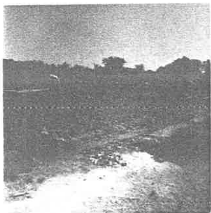
La agricultura - base de la econo mía