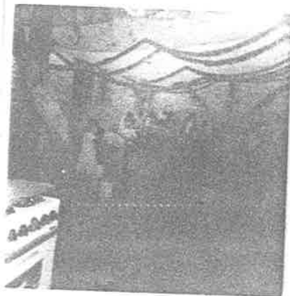
Figura N° 3

Grupo 2° Año trabajando en el patio de la Escuela Nicolás Bravo. Nótese el tolco. Junto a la estufa están los baños.