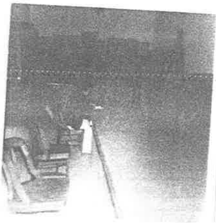
Biblioteca - Pública Mu- nicipal.