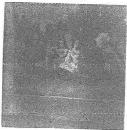
Bellos Murales en la "Moreña" Museo Regional.