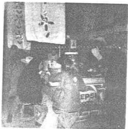
Cenaduras-- con dudosa - preparación- higiénica.