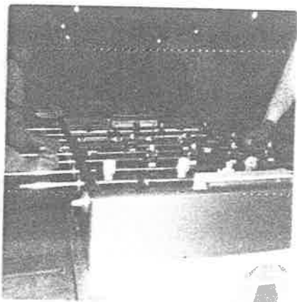
Figura Nº 19

Niños divir-- tiendose que- de seguro la- mayoría no ha realizado sus trabajos ex-- traclase.