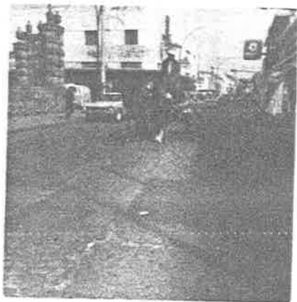
El agua que - se toma trans portada en ca- rritos.