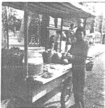
Niños realizando su trabajo.