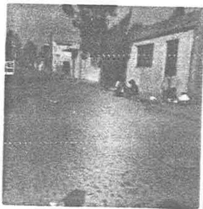
Madres de -- familia aso- leándose. -- Son las 9 de la Mañana.