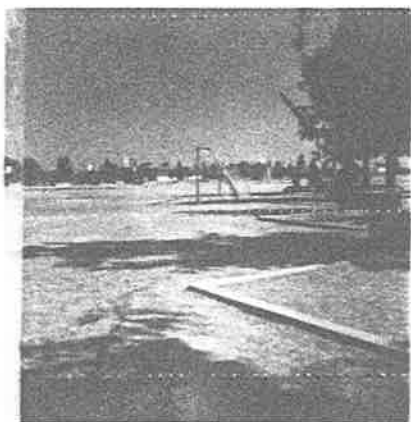
Unidad Deportiva carente de jue- gos infantiles.