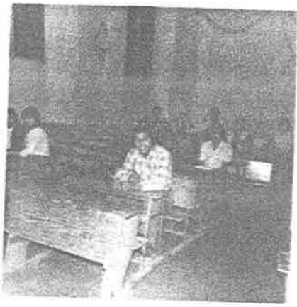
Alumnos del -- Centro de -- Educación Bá- sica para -- Adultos "Ge- neral Manuel Avila Camacho