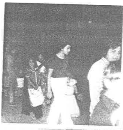
Peregrinación con motivo de la fiesta re- ligiosa del - 12 de diciem- bre.