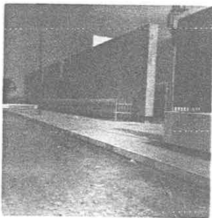
I.M.S.S. de la Ciudad.