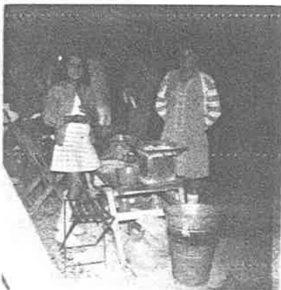
Niñas que ayu- dan a la econo- mía del hogar. Son las 22 hrs