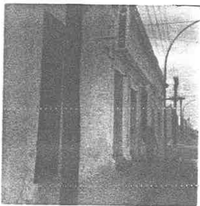
Figura N. 9