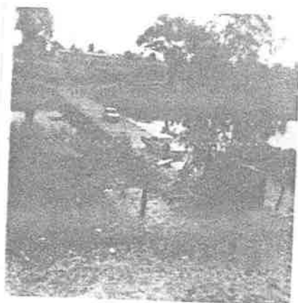
Figura N° 2

Grupo 2° Año trabajando en el patio de la Escuela Nicolás Bravo. Nótese el tolco. Junto a la estufa están los baños.