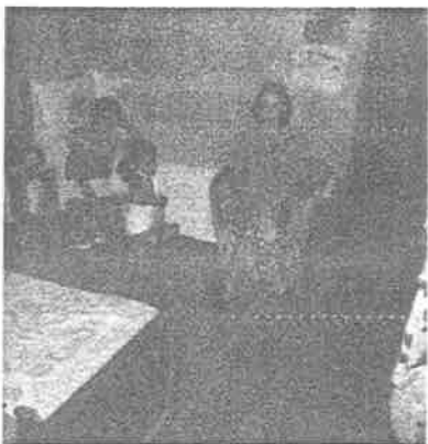
Tipo de casa - habitación v - mobiliario.