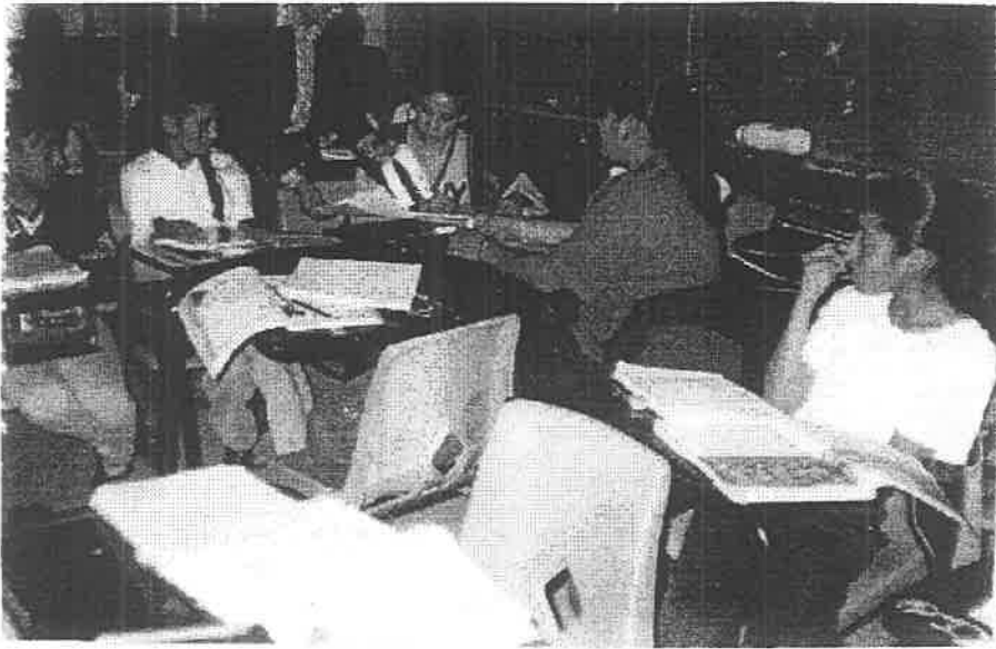
La maestra reparte el material, para armar el texto