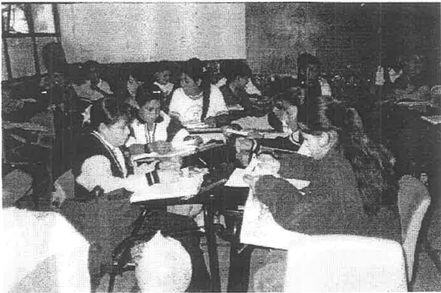
Leyendo los párrafos