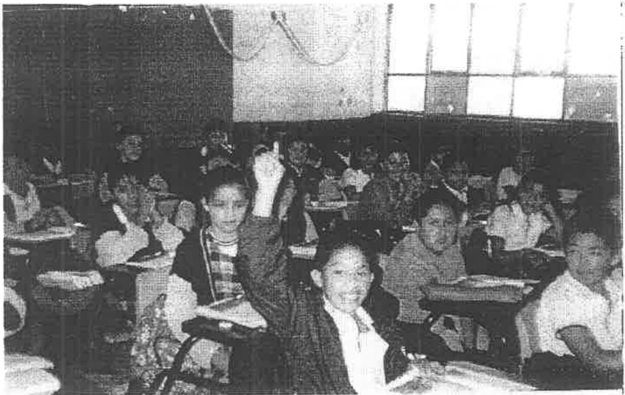
Participación activa del grupo en el desarrollo de la estrategia