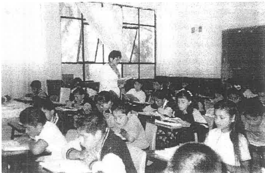
La maestra lee el texto en voz alta