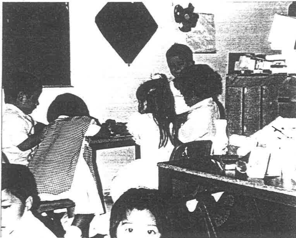
AREA DE EXPRESION GRAFICO PLASTICO