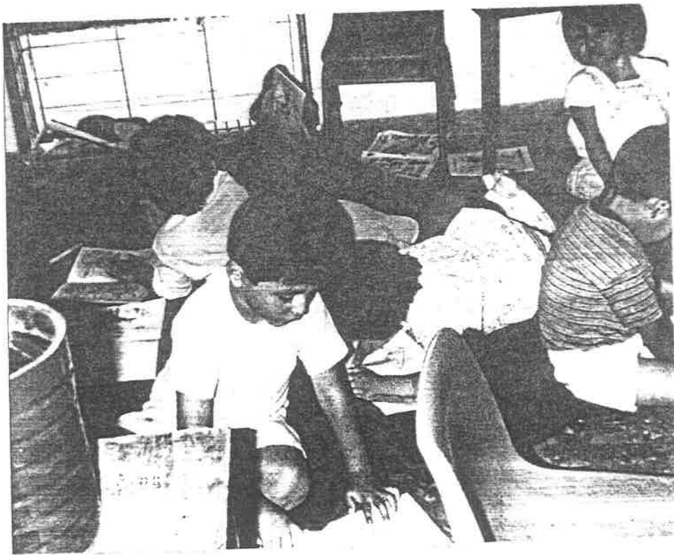
AREA DE BIBLIOTECA.