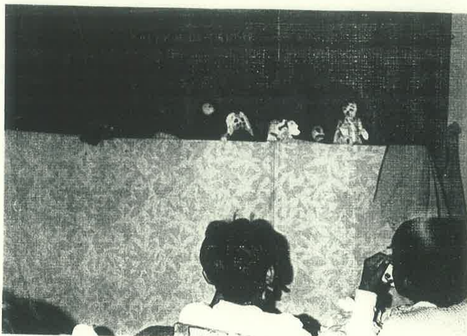
Figura No 3

Teatro de títeres relativo a la repartición de tierras