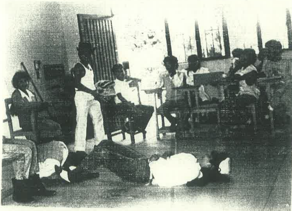
Figura No 2

Sociodrama alusivo a la formación de sindicatos