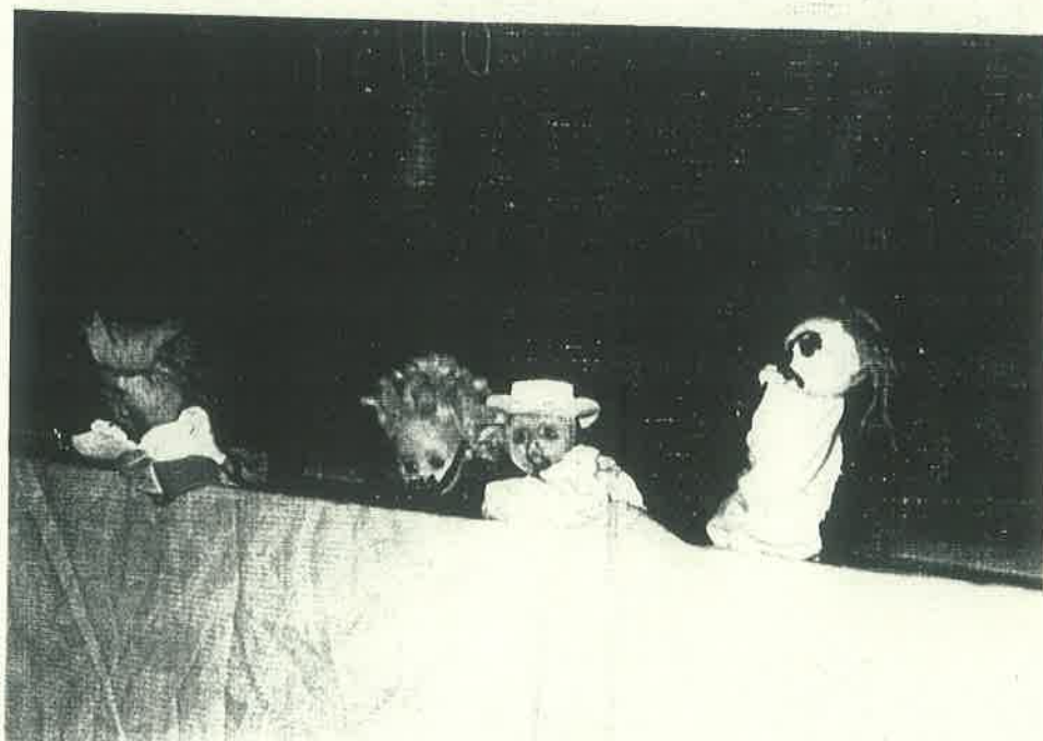
Figura No 4

Teatro de títeres relativo a la repartición de tierras