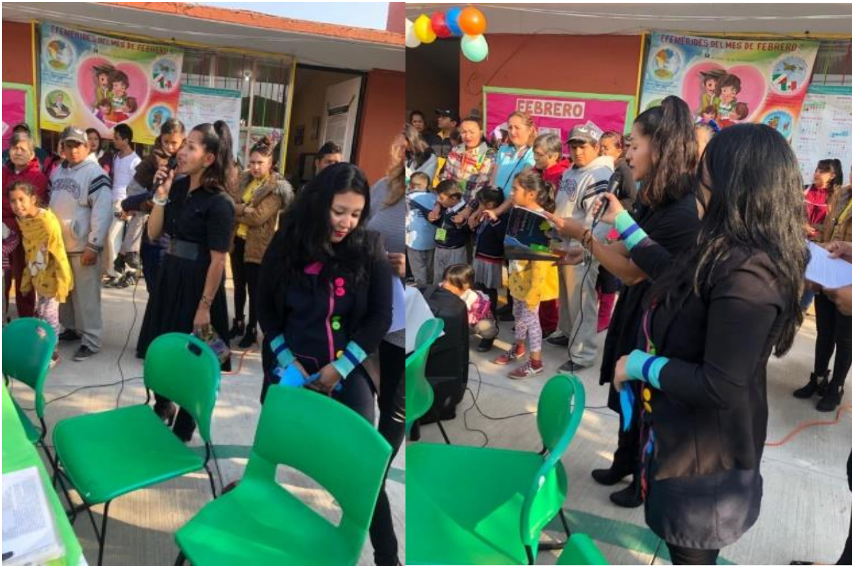
Lectura del cuento a la comunidad escolar