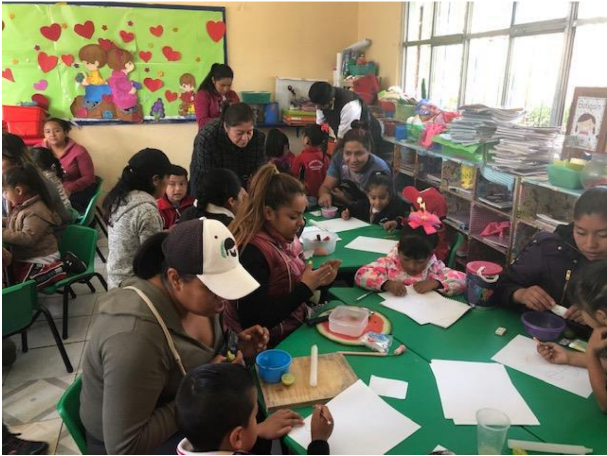
Padres ayudando a sus hijos en el escrito