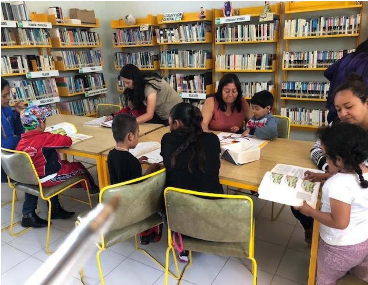
Padres leyéndoles a sus hijos