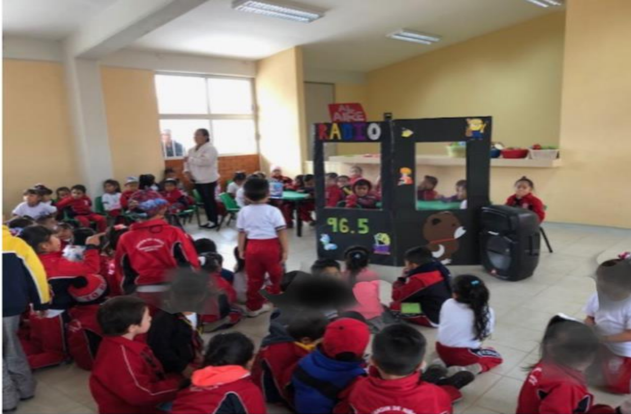
Niños como locutores de radio