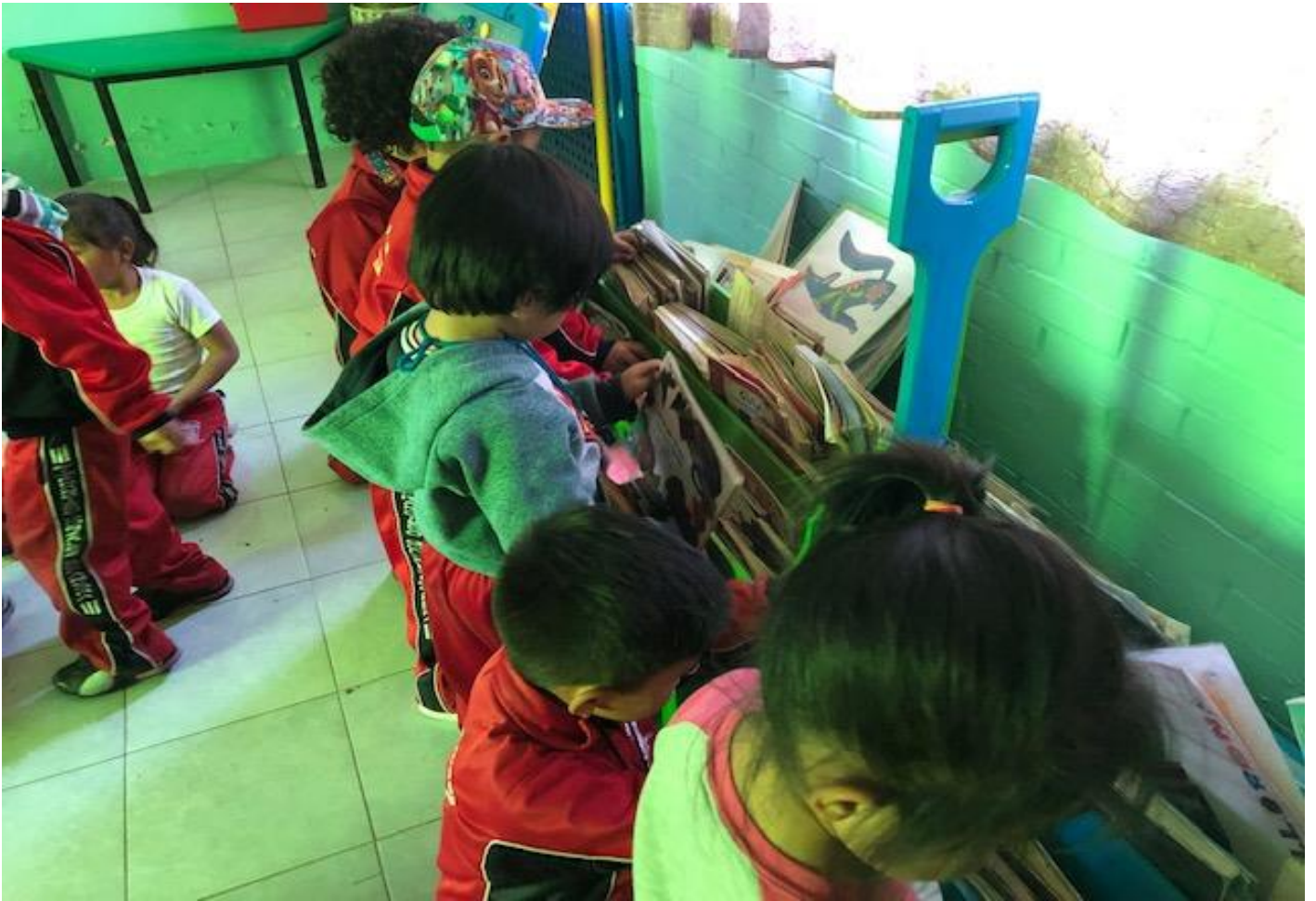
Niños en Biblioteca de la escuela