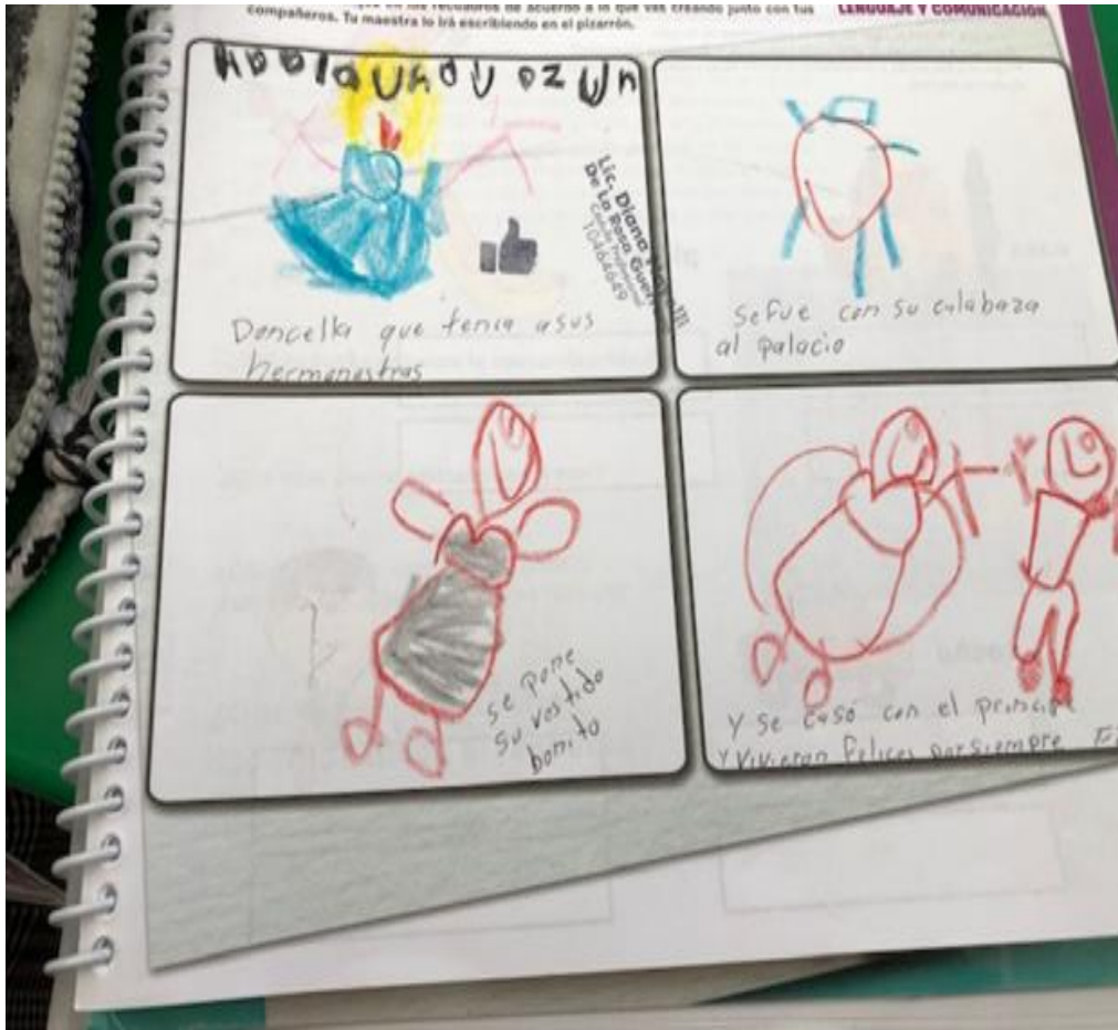
Trabajo de una alumna; mostrando los elementos de un cuento