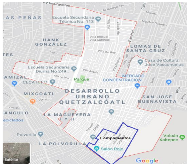
Ubicación de los campamentos

Los campamentos están situados en la parte sur de la colonia, esta es la zona que colinda con la alcaldía de Tláhuac, véase el siguiente mapa, en éste se ha señalado con líneas azules la demarcación de la que provienen los estudiantes que asistieron al taller de lectura (p: 14).