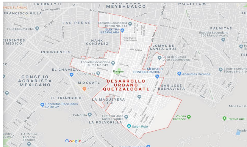
Ubicación de la colonia Desarrollo Urbano Quetzalcóatl

Para atender las necesidades de salud de la población, sólo se cuenta con un centro de salud, por lo que abundan los consultorios y clínicas privadas. Los hospitales, ya sean del IMSS o del Gobierno de la Ciudad de México, más cercanos se encuentran a 45 minutos de distancia en promedio.