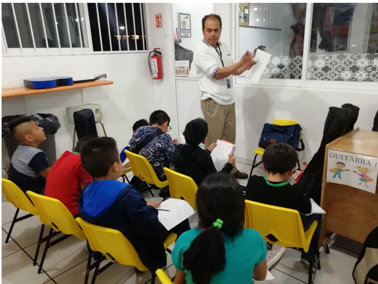
Taller de guitarra acústica 1, en el pasillo de cafetería

Esta imagen del taller de guitarra 1. denota que los alumnos son niños de primaria, en donde se comienzan a adentrar al conocimiento de la guitarra y la música, se mantiene la paciencia para con ellos y las explicaciones de los acordes se simplifican para su óptima aplicación, al igual que los minutos invertidos en ello son al rededor de 5-10 minutos para pasar a otra situación. Mientras que al final se pone en práctica lo aprendido el día del taller, al igual que los demás talleres y cursos al final del ciclo escolar se realiza un ensamble en donde se realiza una presentación con padres y alumnos dentro de la Kermes-Graduación.