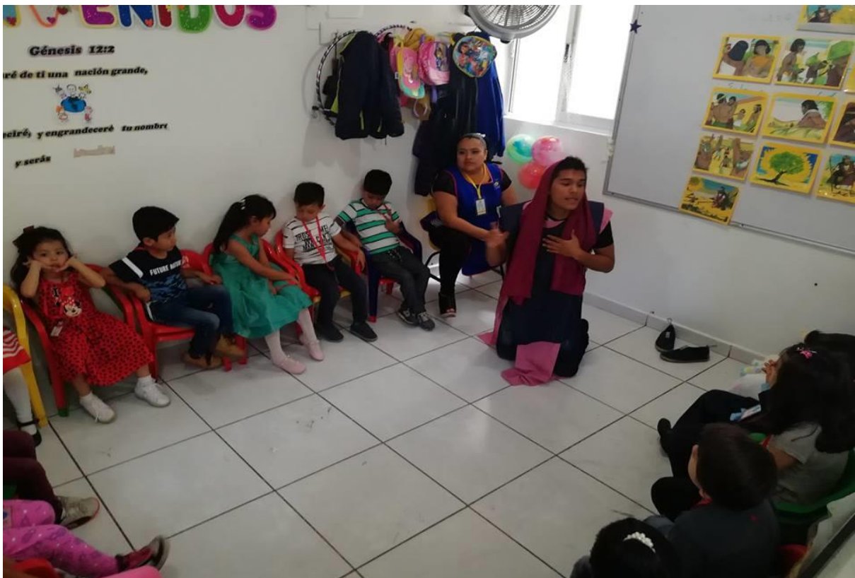
Clase de eventuales rojos

Esta última imagen tiene una muestra del tipo de clases que ofrecemos a los niños con representaciones de sus clases para así tener una mayor relevancia dentro de sus aprendizajes significativos y relacionados con la aplicación de los contenidos en