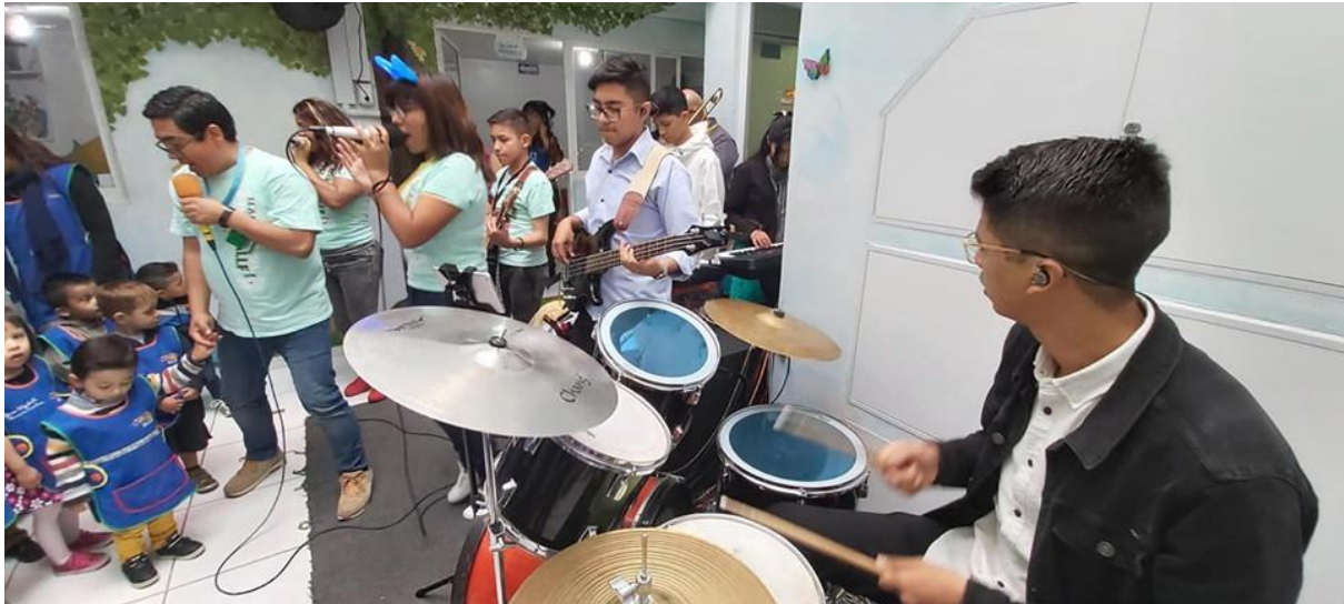
Música en vivo con danzas. Bloque 1 niños y bebés

Hay múltiples funciones para los profesores, como el atender a los niños con sus necesidades, de alimentación, fisiológicas y espirituales, aconsejándolos, orando por ellos y llevándolos al médico del instituto en algunas situaciones darles el ejemplo de lo que se debe de hacer y cómo se debe de hacer; son los encargados de propiciar un ambiente de aprendizaje para que el educando sea más receptivo y preste atención, realiza actividades como también juegos de repaso para establecer los conocimientos que se abordaron durante la clase; se encarga de la entrega de los niños y del aseo del aula, se revisa la clase por abordar para la siguiente semana y organizar roles por maestro ya que se cuenta desde 2 a 4 maestros por aula para cubrir de manera correcta e idónea con las funciones.