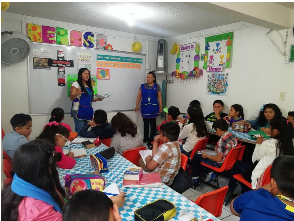
Clase de 3er grado con las muestras y su grupo, clase de evangelización.

Como se muestra en la anterior imagen las maestras y el grupo son de 3° de primarios, en donde están impartiendo la clase, abordando el curso acerca del evangelio y en este ciclo escolar se estudian los libros de Mateo, Marcos, Luchas y Juan; los cuales conforman el evangelio para concretar las convicciones en los niños acerca de Jesucristo, el cual tomamos como ejemplo dentro del Instituto.