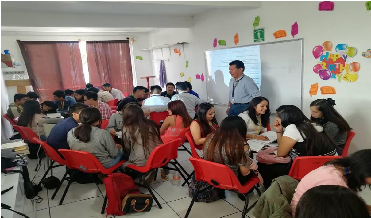
Clase de secundarios 2