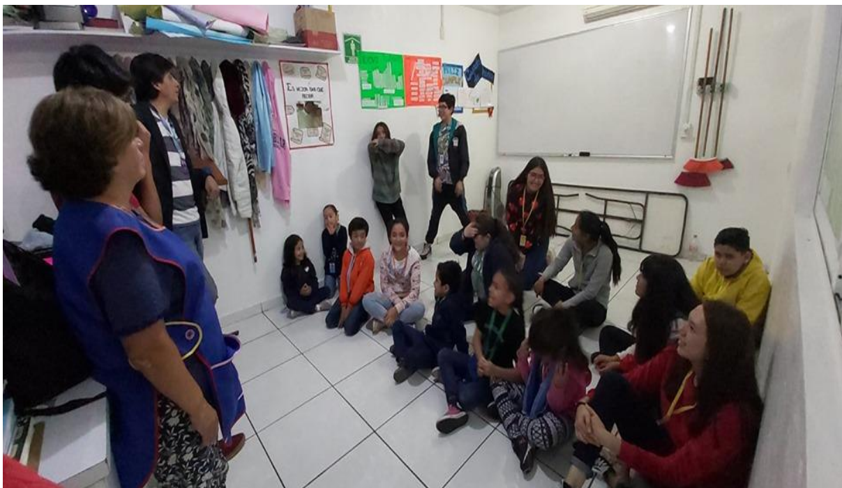
Reflexión y evaluación. Curso expresión corporal, salón: eventuales rojos

experiencias y se organizan para repartir el día entre los cuatro, brindándoles cada encargado parte de su trayectoria para que al final de cada día conjunten las distintas áreas y realizar una representación o interpretación para sus demás compañeros y encargados y así tener tres evaluaciones; la coevaluación, autoevaluación y la evaluación de los profesores como podemos contemplar en la siguiente imagen donde se nos muestra la reflexión final por parte de los profesores y encargados para los alumnos de las tres categorías.