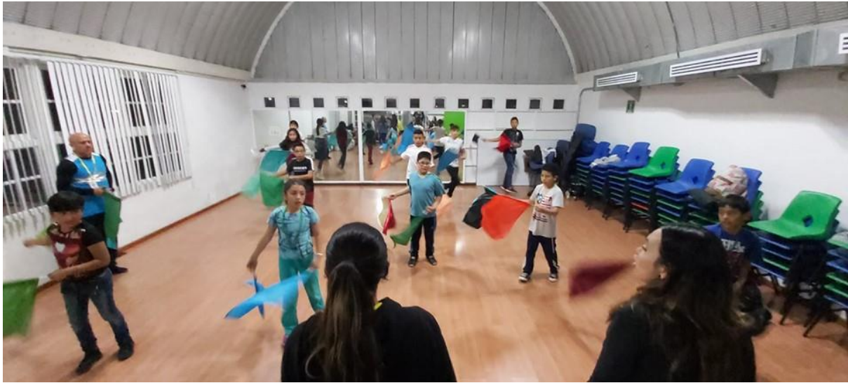
Taller de banderas en la duela del instituto

encuentran Panderos, Corros, Celestial Dancers y Banderas, este último es el que se muestra en el siguiente anexo. Los talleres se imparten un día a la semana y al igual que los cursos son en tres categorías, despiertan la activación física y de movimientos estéticos, para poder participar en los eventos que se realizan en la congregación de la cual depende el instituto, la Iglesia de Cristo Ministerios LLamada Final.