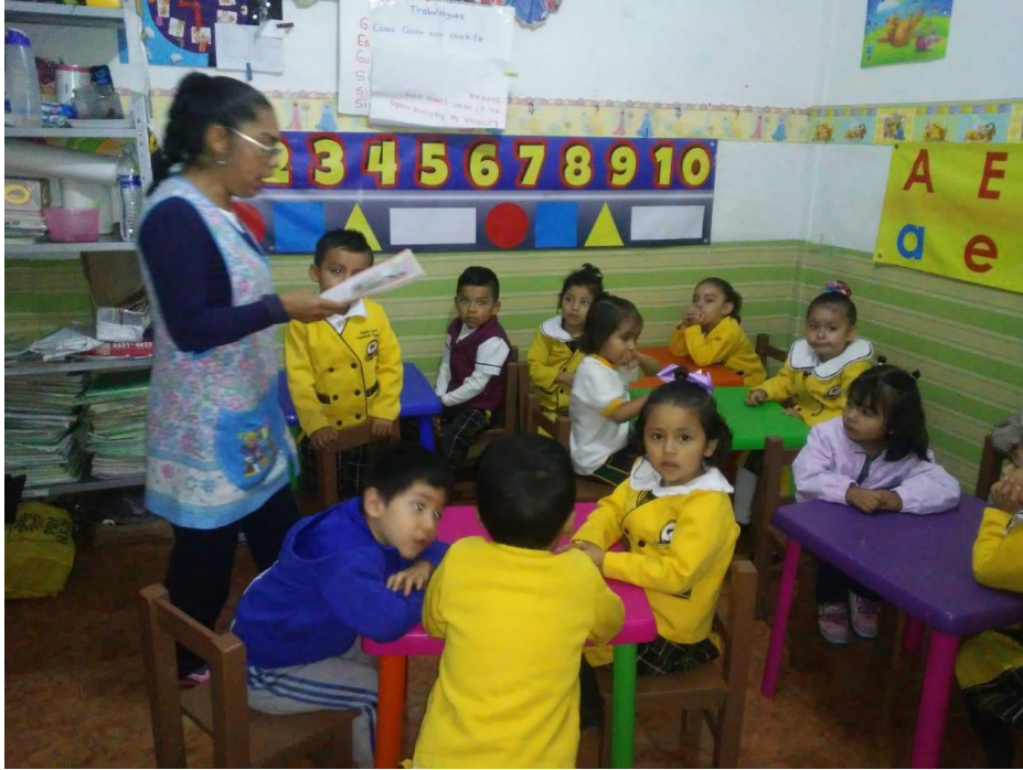
1.4 Usando la fantasía y la imaginación