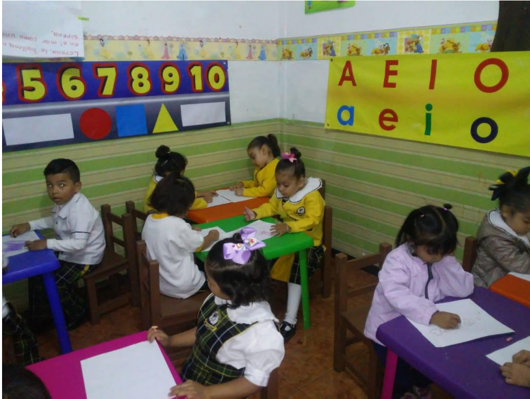
1.5 Relajándonos con la canción de los tres cochinitos.