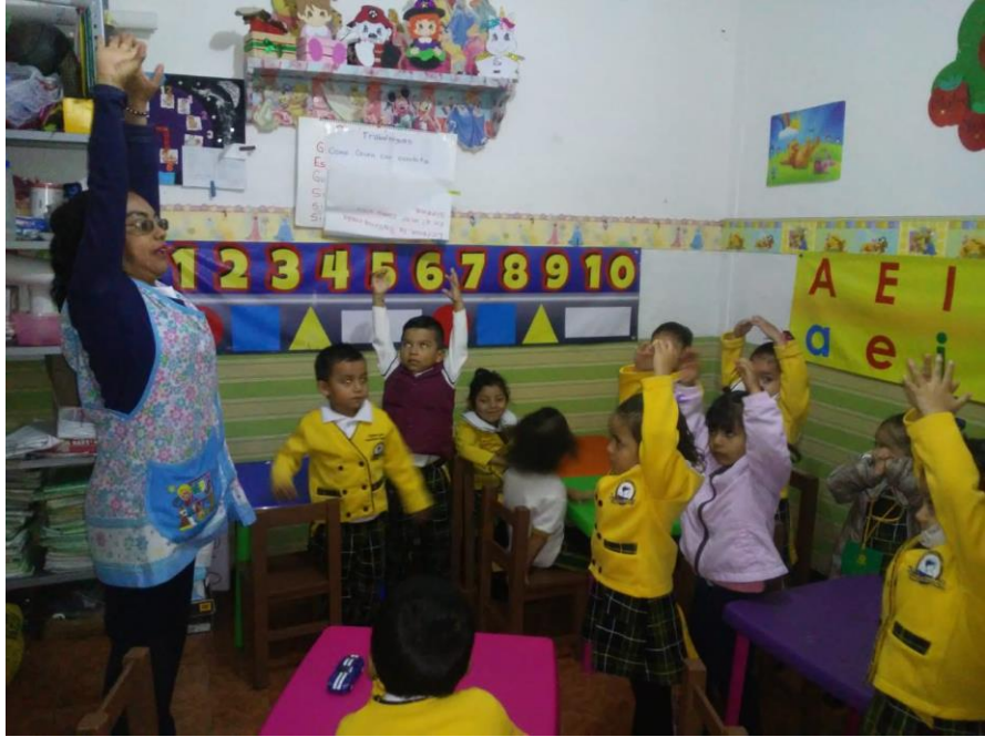
1.2 Los alumnos realizando sus imágenes de la lectura y del amor.