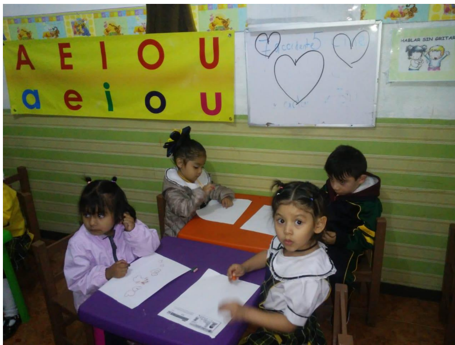
1.3. Estrategia número. 5 vamos a leer.