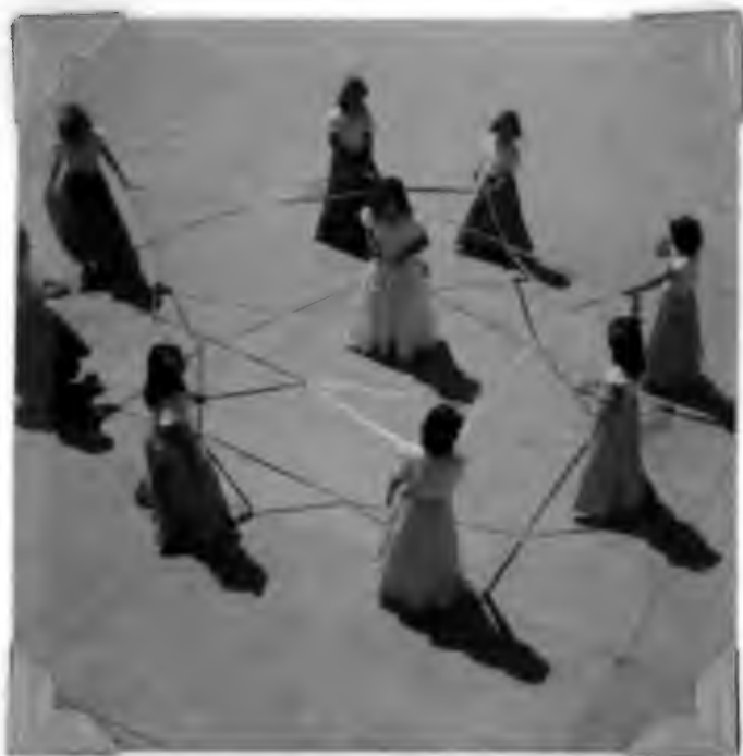
FESTIVAL DE LA ESCUELA