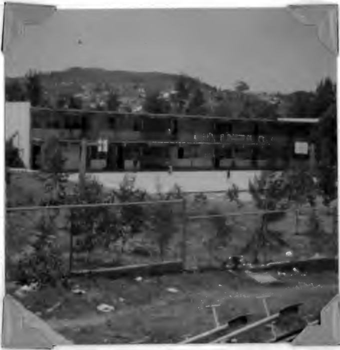
EXTERIOR DE LA ESCUELA DONDE LABORO