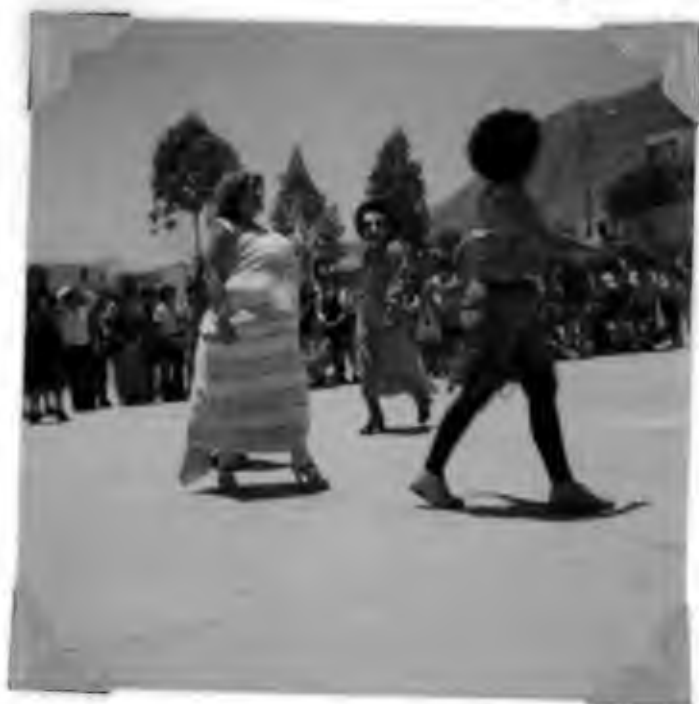
NOS UNIMOS DIRECTOR Y MAESTROS PARA CELEBRAR EL "DIA DEL NIÑO".