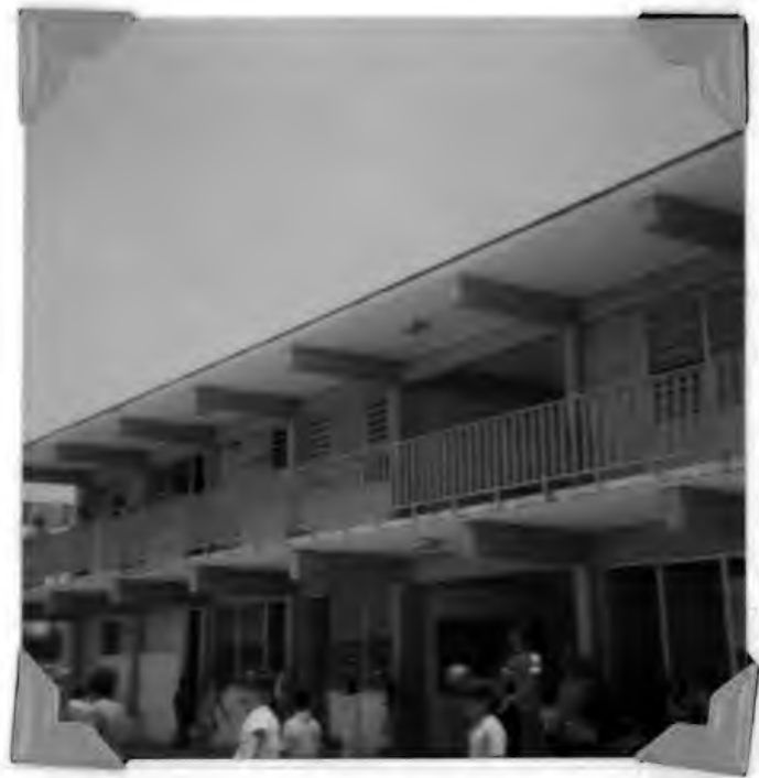
INTERIOR DE LA ESCUELA