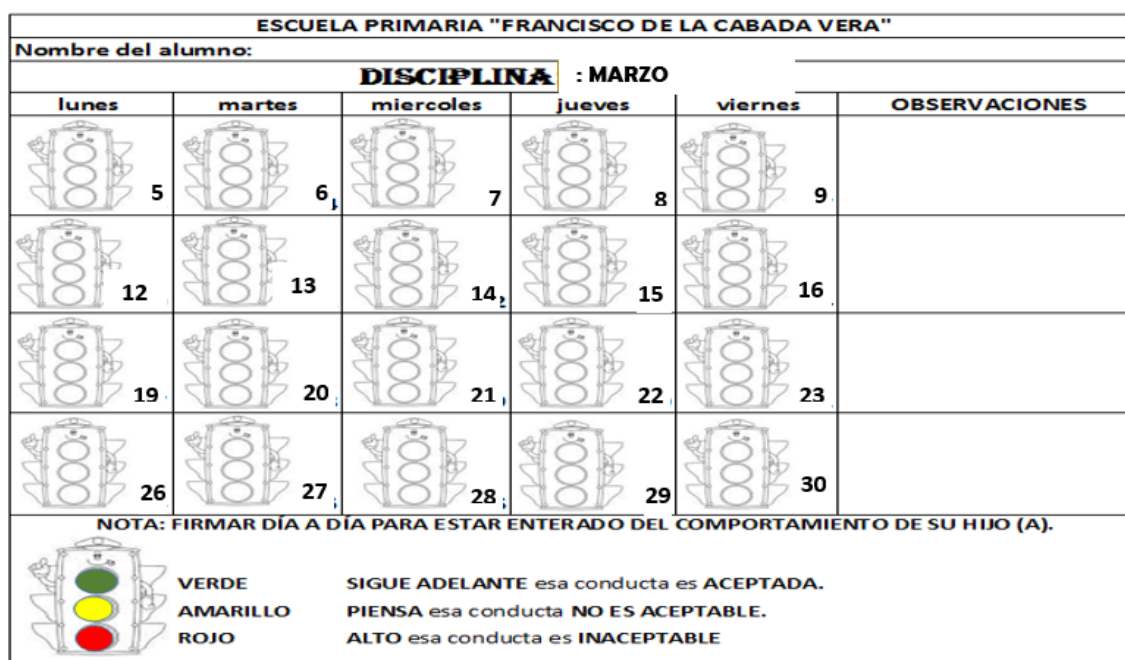
Figura 2. Semáforo de conducta valoral.

Otra acción que se acordó a partir de ese día, fue la aplicación del “semáforo de conducta”, estuvo vigente para el mes de marzo, y abril, tiempo en el cual se desarrolló la alternativa de solución, plantilla que se presenta a continuación: