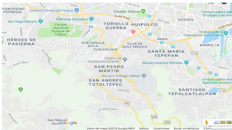
Imagen de la Ubicación del Centro Comunitario “Titina” 13

El Centro Comunitario “Titina” se encuentra ubicado, en el Pueblo de San Pedro Mártir.