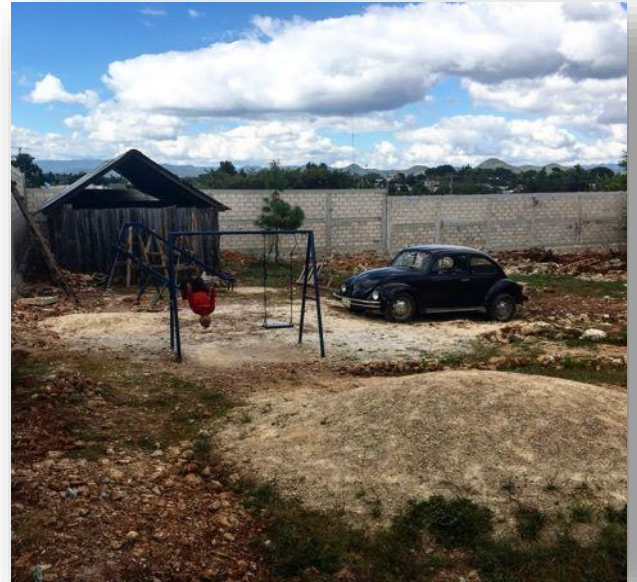
Foto 2. Escuela Bilingüe, Plan De Anenecuilco (Guillen, Alejandra, 2017)

Actualmente en la infraestructura hay un total de 10 aulas en servicio y la cual una de ellas es utilizada como dirección, por otra parte, la escuela también cuenta con una casita de madera que se utiliza para los desayunos escolares.