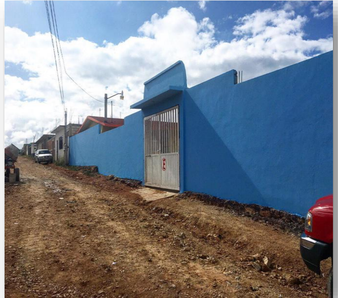
Foto 1. Escuela Bilingüe, Plan De Anenecuilco (Guillen, Alejandra, 2017)

La escuela Primaria Plan de Anenecuilco es catalogada en el municipio de Las Margaritas como “La escuela Bilingüe” o “la bilingüe”. No la conocen, ni mencionan por su nombre “Plan de Anenecuilco”. Es vista así por el tipo de población que atiende, generalmente los padres de los niños trabajan en el aserradero, de carpintería, de albañilería, trabajan de peones como también hay señoras que trabajan en radio taxis, la mayoría provenientes de familia humilde y migrantes; asisten niños de diversas culturas, algunos son los Q'ajob'ales pertenecientes de Guatemala, tojolabales , tzotziles , tzeltales , e hijos de americanos nacidos en