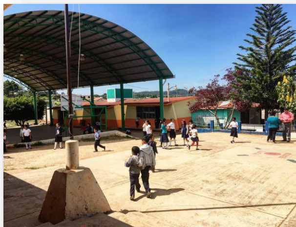
Foto 4. Escuela Bilingüe, Plan De Anenecuilco

Considero que una de las principales fortalezas encontradas en la Escuela Bilingüe es que la mayoría de los maestros que laboran en esta institución cuentan con más de 20 años de servicio, esto significa que hay mayores conocimientos y estrategias de enseñanza, pero que al mismo tiempo puede ser una amenaza, de acuerdo con Antonio Bolívar citando a Huberman en las fases de la carrera, la experiencia es puesta en cuestión ya que un conjunto de estudios corresponden a que 15 a 25 años de experiencia profesional y a los 35- 45 años de edad los se describe como una problemática.