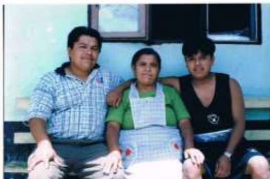
Familia característica de la comunidad de Santa Mónica, descansando.

Los varones que se dedican a las labores del campo tienen curtida la piel por el sol, al igual que sus manos se han endurecido por las faenas propias del campo como el cuidado de ganado vacuno, el corte de leña, la siembra de la parcela o huerto, etc.