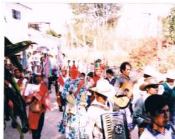
Procesión en recorrido por las calles del pueblo de Santa Mónica donde se observan los músicos, los danzantes y los mayordomos.

donde los pobladores tradicionalmente descansaban durante los días de la fiesta patronal para cumplir con sus obligaciones religiosas.