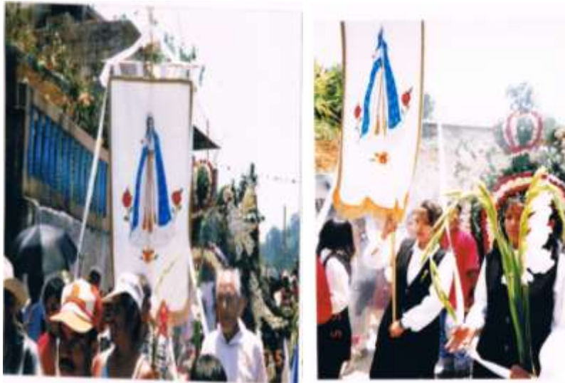
Vista de la Procesión y Estandarte con la imagen de Santa Mónica.

Aparte del estandarte, los feligreses también traen una virgen de bulto que llevan en un porta santos adornada con un arco de flores rojas y blancas (principalmente claveles); arriba del arco se forma una corona llena de flores y a los lados unas estrellas que adornan de la misma forma. Seguramente por lo pesado de la imagen y los adornos, las personas con una manda, o por agradecimiento, cambian de lugar o entra una nueva persona a cargar la imagen, quizá para no sentir lo pesado del trayecto, quizá para cumplir la promesa realizada con anterioridad. A todas las personas que asisten a la procesión se les obsequian flores, en especial gladiolas blancas, rosas y rojas, también otras flores como margaritas o nube, algunos llevan ceras blancas encendidas que acompañarán a la procesión en su andar hasta el centro del pueblo.