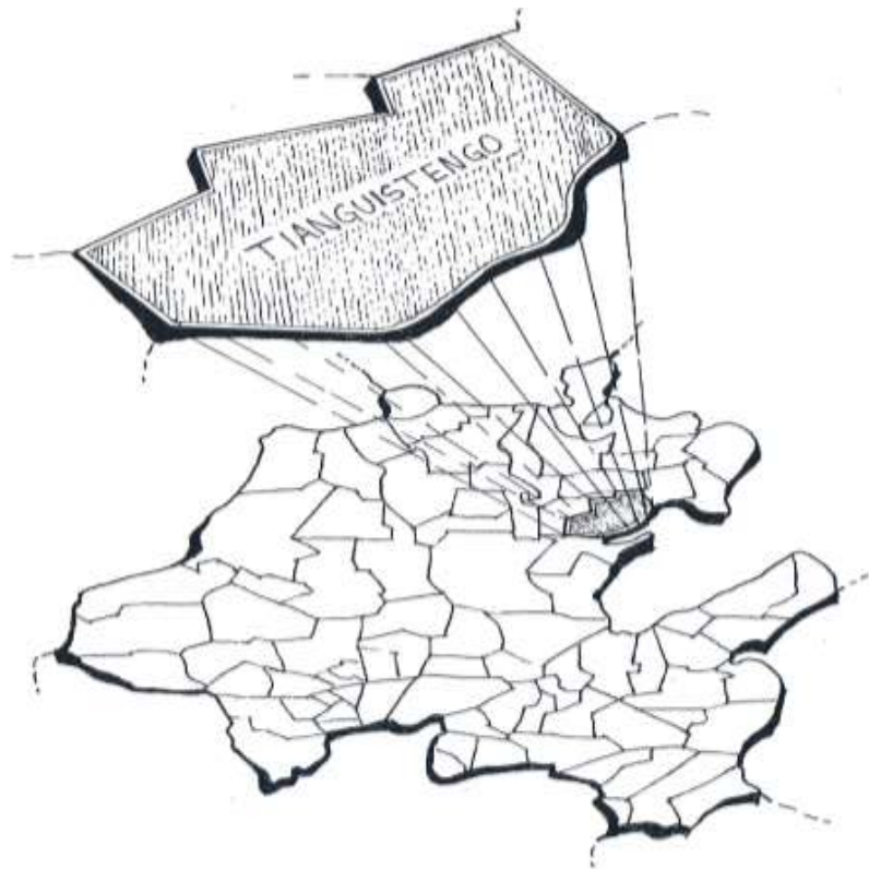
Ubicación del municipio de Tianguistengo en el estado de Hidalgo.

Aunque el territorio de Metztlán se haya dividido en encomiendas para los españoles, Cortés no siguió el mismo patrón de división que había establecido en el resto de la Nueva España; se ignoran las razones por las cuales las encomiendas de ese entonces tuvieron la misma distribución que había en la época prehispánica.