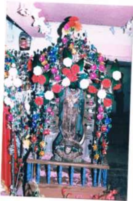
Porta Santos utilizados para las procesiones con las imágenes de Santa Mónica y la Virgen de Guadalupe.