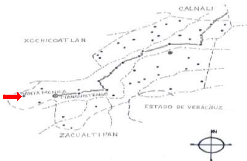
Mapa del municipio de Tianguistengo y ubicación de la comunidad de Santa Mónica.

Santa Mónica es la segunda comunidad en importancia dentro del municipio de Tianguistengo, en el año de 2015 tenía una población aproximada de 950 habitantes, se ubica en la parte suroeste del municipio en una región montañosa de la denominada Sierra Alta.