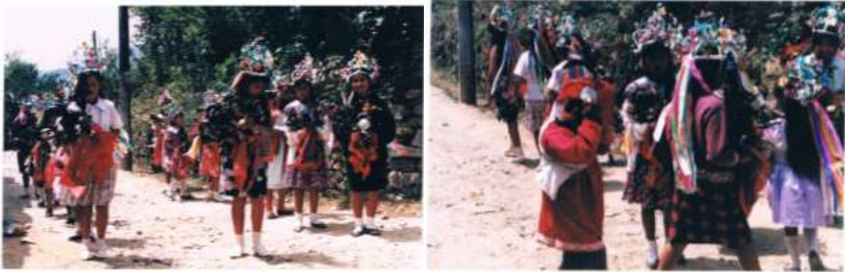
Jóvenes señoritas, niñas y niño interpretando un son de la danza Mantezomas.

ha pasado en los diferentes pueblos y en especial en el de Santa Mónica, con la presencia de la mujer en un contexto sobre todo festivo. Su participación concreta radica en todas aquellas funciones donde la mujer es importante para el funcionamiento de una sociedad en donde las actividades están muy bien definidas, tal como en la preparación de alimentos, el arreglo de los huertos y jardines, el aseo de la casa, el cuidado de los hijos, y en algunas ocasiones además como la persona que trabaja para llevar sustento a su hogar.