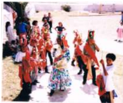
Danzantes de Xochimes en el atrio de la capilla después de la procesión del día 4 de mayo.

Al término de la celebración eucarística, los danzantes van a ejecutar la danza en casa del mayordomo en turno para agradecer las atenciones que se les brindaron por haberlos invitado a participar durante las fiestas; pero sobre todo, en honor a las imágenes de los santos que se reciben en la casa del propio mayordomo.