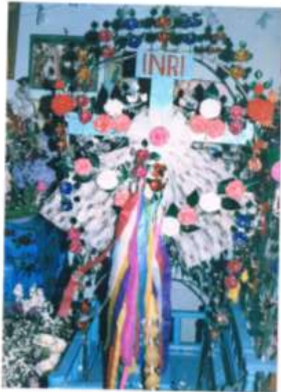
Porta Santos del Sagrado Corazón de Jesús y la Santa Cruz.