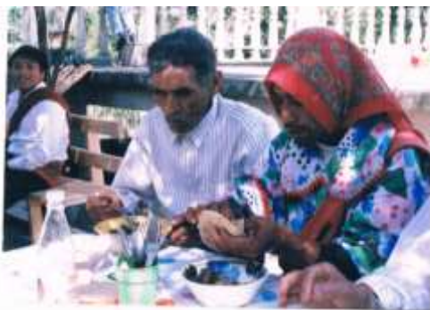
Después de recorrer las calles en un día de fiesta los danzantes comen en casa del mayordomo.

La alimentación básica de los pobladores consiste en: maíz (con el que elaboran tortillas, tamales, hojarascas, atoles, etc.), frijol, café, pan, chile, tomando tres alimentos al día, aunque su mayor y mejor comida la realizan alrededor de las 3 de la tarde cuando todos salen de la escuela, regresan del trabajo o del campo y llegan a casa para disfrutar de los alimentos.