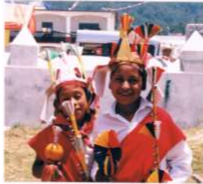
Detalle del vestuario donde se aprecia el Masuchil, la corona y la sonaja de Xochimes.

hacen en la comunidad durante los primeros días de mayo. También tendrá que ver con su cosmovisión, en relación a los fenómenos naturales, los puntos cardinales y todos aquellos acontecimientos que marcaban los ciclos de vida.