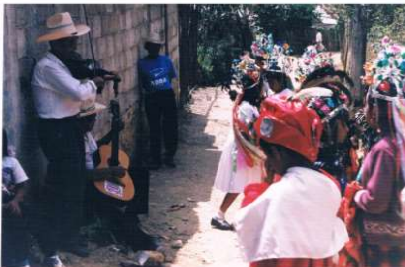
Los músicos acompañando en uno de los sones a los danzantes de Mantzomas.