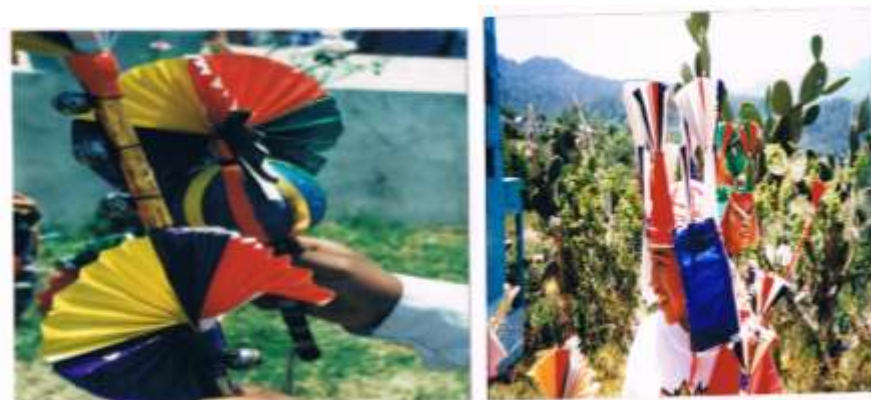
Detalles del colorido utilizado en la sonaja, el masuchil y la corona en la danza Xochimes