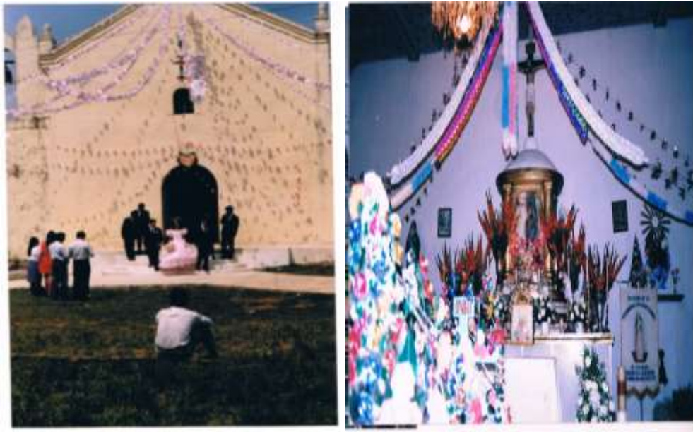
Fachada de Capilla en día de fiesta y Altar Principal con la imagen de Santa Mónica

La capilla es una sola pieza construida según información de los pobladores, en sus inicios con el techo de tejas de barro cocidas y con el piso de cal y arena, paredes de piedra y cantera. Al paso de los años las tejas se han cambiado por lámina de zinc y el piso que por un tiempo fue de cemento, se ha remodelado por mosaico. Algo que es muy peculiar de la capilla de Santa Mónica es su cielo raso interior que está hecho de tablas de madera pintadas en color azul cielo; dónde se ven claramente pintadas las figuras del sol, la luna, un cometa y diversas estrellas.