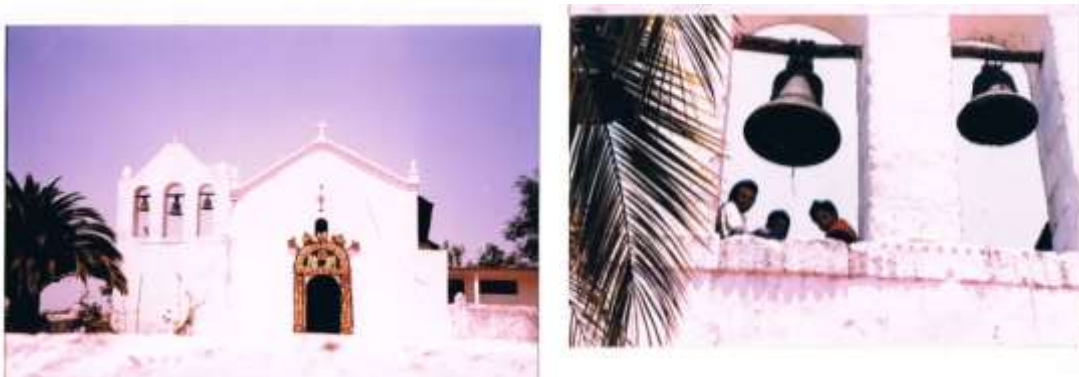
Fachada principal de la capilla de Santa Mónica y vista parcial del Campanario.

La capilla es una sola pieza construida según información de los pobladores, en sus inicios con el techo de tejas de barro cocidas y con el piso de cal y arena, paredes de piedra y cantera. Al paso de los años las tejas se han cambiado por lámina de zinc y el piso que por un tiempo fue de cemento, se ha remodelado por mosaico. Algo que es muy peculiar de la capilla de Santa Mónica es su cielo raso interior que está hecho de tablas de madera pintadas en color azul cielo; dónde se ven claramente pintadas las figuras del sol, la luna, un cometa y diversas estrellas.