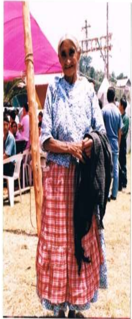
Vestimenta tradicional de mujeres mayores de la comunidad de Santa Mónica, donde resalta la blusa bordada en pepenado.