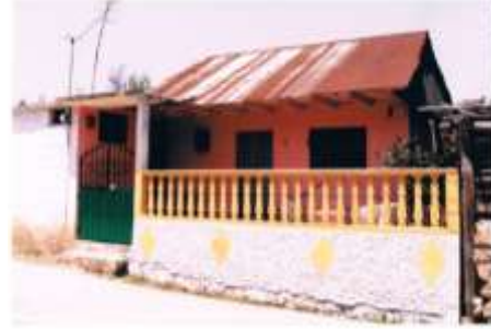
Foto de la izquierda casa tradicional hecha con materiales de la región, foto de la derecha casa habitación reciente, ambas en la comunidad de Santa Mónica.

Con el paso de los años y la comercialización de otros productos, algunas casas fueron construidas con cantera o piedra que abunda en la región, conservando el tapanco.