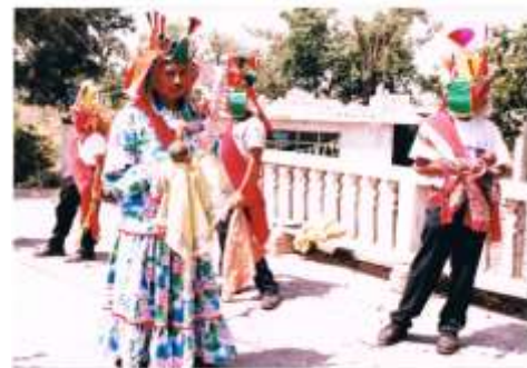
El Negro y La Monarca personajes destacados en la danza de Xochimes.

La danza de Xochimes se ubica dentro de las danzas de orden festivo-religioso ya que se interpreta en las fiestas patronales o en las celebraciones religiosas más relevantes para los pobladores. Las fiestas de mayor realce en la comunidad van muy ligadas a las