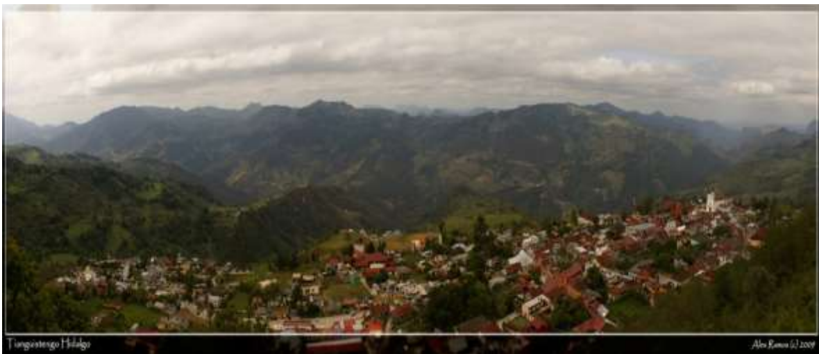
Vista panorámica de la cabecera municipal de Tianguistengo.

Entre los lugares que aparecen en estas relaciones se encuentran: Mastlatla (actualmente en Santa Mónica), Ochpantla (hoy Oxpantla), Zoyatla ( Soyatla), Tenexco (Tlacuechac y Zacatipan); aparece también Tlacolula, que en el siglo XVIII era cabecera, sin embargo se cree que se cambia al actual pueblo de Tianguistengo porque Tlacolula se sitúa geográficamente en los límites con el estado de Veracruz.