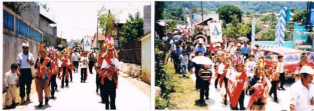
Recorriendo las calles del pueblo en Procesión y llegada a la Capilla de Santa Mónica.

El grupo de danzantes que acompañaron a la virgen durante éste año fueron los llamados “Xochimes”, al igual que la banda musical que acompaña a la procesión, participan en el trayecto con mucha devoción y entrega de manera alternada, aunque en la última parte del trayecto de la procesión los danzantes y la banda unen su danza y su música para hacer una mezcla de sonidos y movimientos que hacen más vivaz y alegre esta celebración.