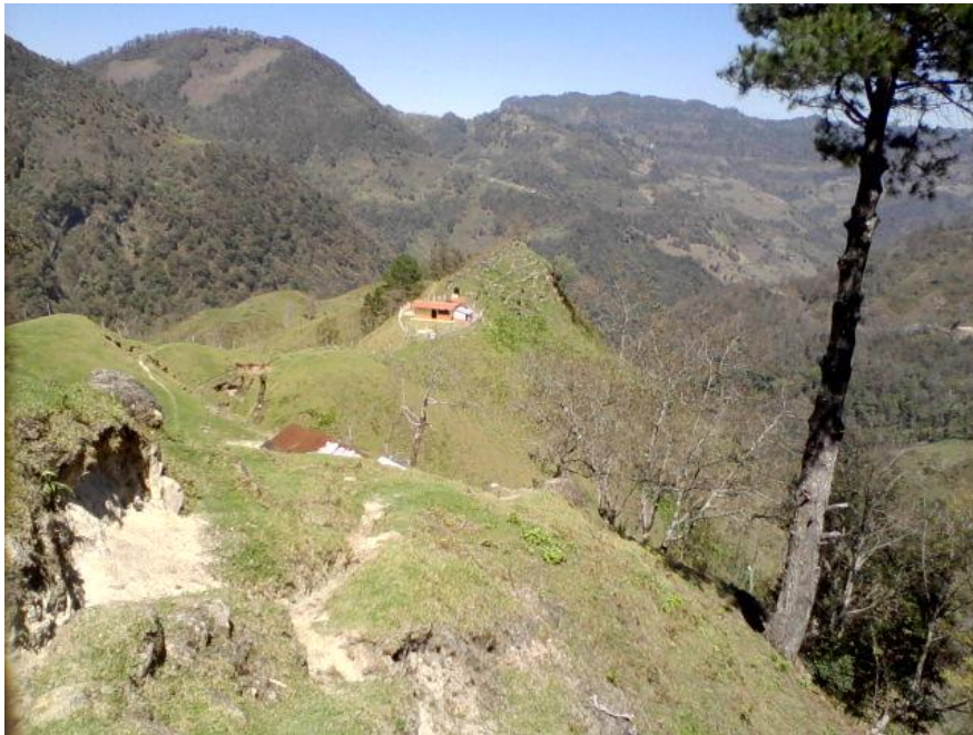
Imagen 2. Comunidad del Rincón. La dispersión de sus casas impide una relación estrecha entre sus habitantes.