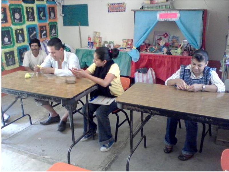
Imagen3. Taller con padres de familia del Rincón, actividad que consistía en conocer que tanto los padres conocían los intereses de sus hijos, con la cual se comprueba que hay poca comunicación con los hijos donde la importancia radica en acudir a la escuela para conservar una beca.