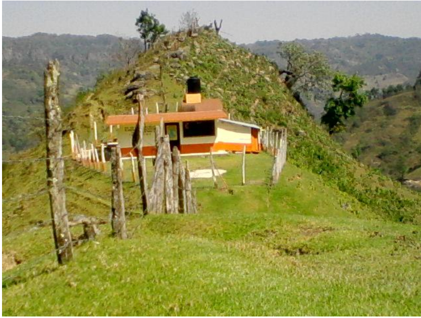
Imagen 1. Escuela comunitaria del Rincón y punto de reunión de los habitantes de la localidad.