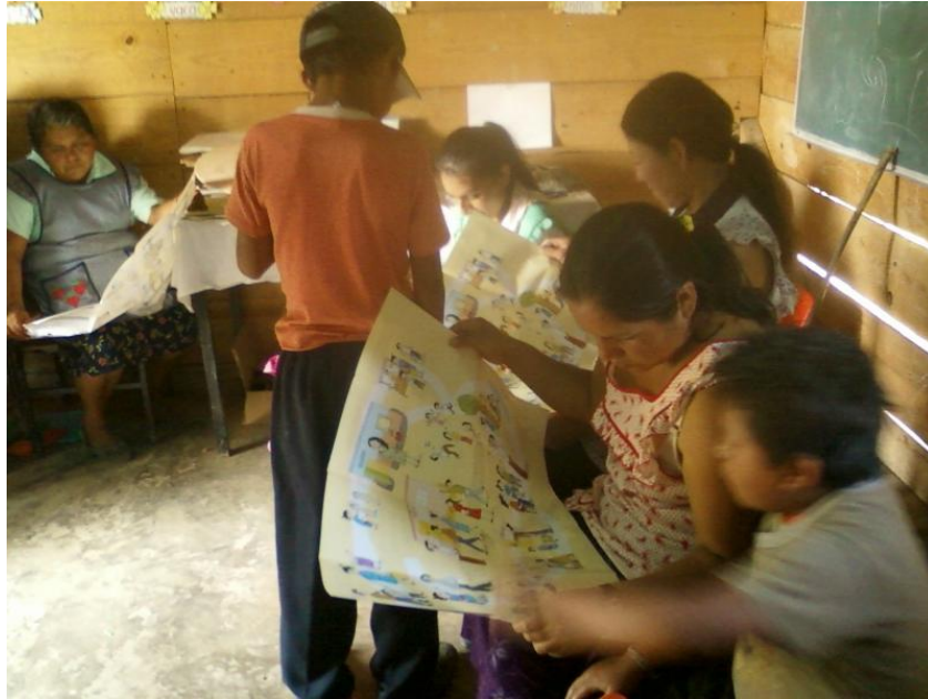
Imagen 5. Taller con padres de familia e hijos, se les menciona la importancia de que sus hijos acudan a la escuela. En dicha reunión surgieron varios comentarios de Oportunidades como mayor preocupación de estos. La asistencia a las reuniones en esta localidad es única de las mujeres, pues los varones mencionan que son ellas las que reciben el apoyo y que son ellas las que deberán acudir a todo tipo de reuniones.