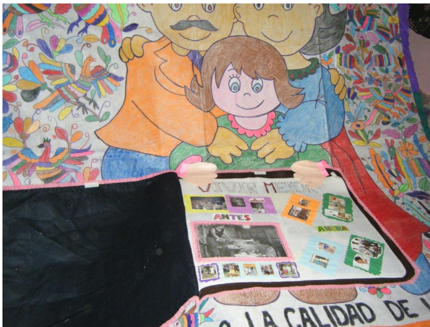
Imagen 6. Mural realizado por las madres de familia sobre Oportunidades. Actividad en la cual se esmeran y ocupan gran cantidad de tiempo para quedar bien con el programa y hacerles saber que dicho apoyo ha contribuido para mejorar su calidad de vida, aunque no sea así.