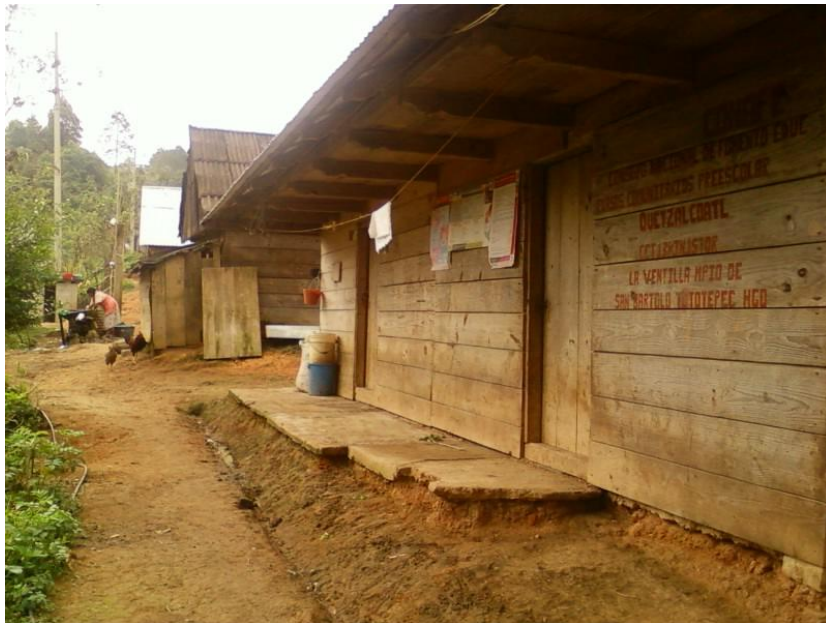
Imagen 4. Escuela y comunidad de la Ventilla, población indígena beneficiaria del programa Oportunidades.