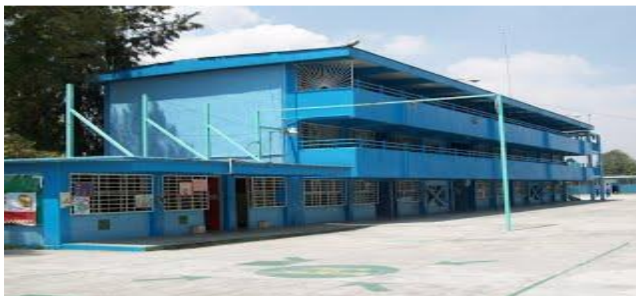
Escuela secundaria diurna # 226

resultado de la prueba ENLACE (Evaluación Nacional del Logro Académico en Centros Escolares) y PLANEA (Plan Nacional para la Evaluación de los Aprendizajes) actualmente la escuela se ubica en el lugar 831 de 1342 en la Ciudad de México con relación al aprovechamiento escolar.