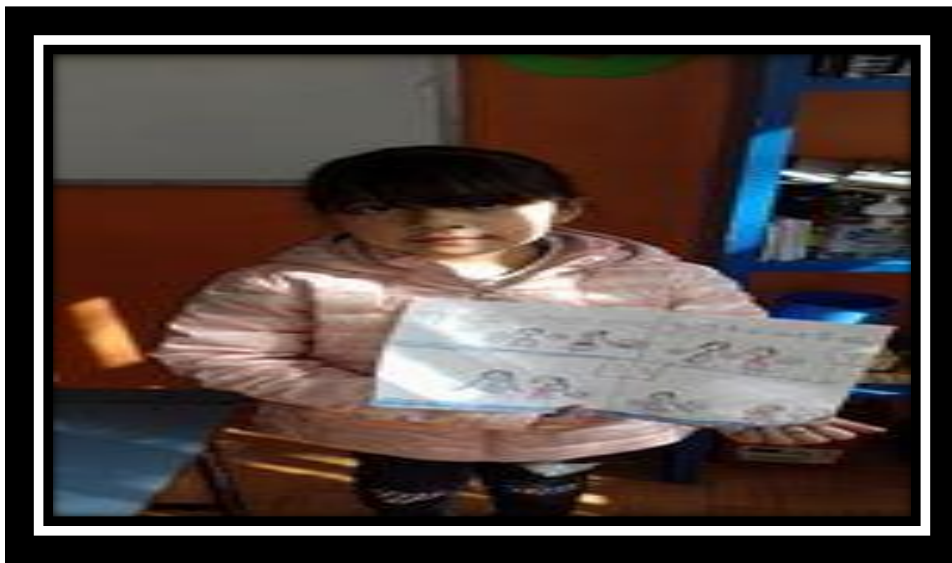
Ilustración 5 Dibujo de Abril

Aquí nos muestra en su dibujo ¿Como le gusta que la traten?