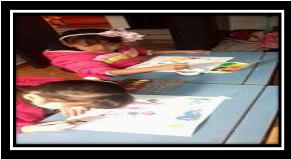
Ilustración 4 Se expresan por medio de un dibujo

Cada una de las niñas expresan como les gusta ser tratadas por medio de un dibujo.