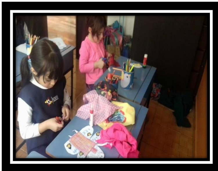
Ilustración 3Elaboración de títere

Los niños y niñas diseñaron su propio títere con diferentes materiales que ellos mismos eligieron.