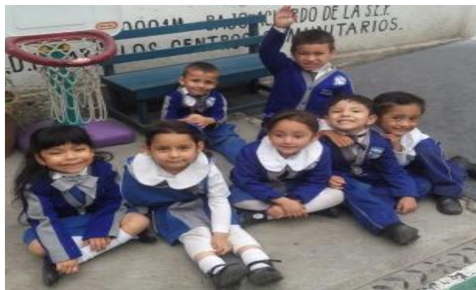
Foto 4. Alumnos de preescolar 2.

Esto genera preocupación entre las docentes al ver que a los niños se les dificulta cumplir las reglas que les dan para realizar cualquier acción, causando en el niño sentimientos de frustración afectando de esta manera la relación con los demás, (Ver foto 4)