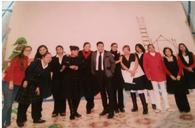
Foto 3. Profesores del Colegio Infantil Año 2000.

Directora de primaria y otra de Preescolar, un subdirector, seis profesores de primaria, tres de preescolar, una señora de intendencia, una persona en lo administrativo y cinco profesores de materias extras como Música, Danza, Tae kwo do, Educación Física y Computación, (Ver foto 3) , se observa el equipo de trabajo del colegio. 11