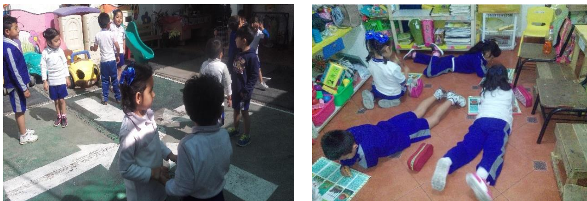
Foto 6. Actividades dentro y fuera del salón.

La mayoría realiza las actividades con interés y entusiasmo cuando son llamativas e innovadoras para ellos, en algunas ocasiones no quieren participar y les cuesta trabajo expresarse frente a los demás, debido a su falta de seguridad, por tal motivo necesitan de motivación y seguridad para que participen. En la foto 6 , se observa cómo se desenvuelven en las actividades en el patio y salón.