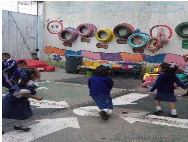
Foto 28: Organizándose para el juego.

Al terminar de escuchar sus respuestas, me percaté que la mayoría desconocía el juego, lo que me llevó a explicarles las reglas y en qué consistía el juego; de esta manera comenzaron a jugar (Ver foto 28) .