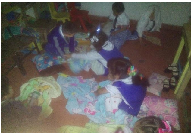
Foto 30: Acomodándose para escuchar el cuento.

Se les dijo, que leeríamos un cuento, para ello, se les solicitó que con sus pertenencias buscaran un lugar para poder acostarse. Ya cuando estuvieron acomodados se comenzó la lectura del cuento sorpresa, se les pidió que encendieran sus lámparas hacia el cuento para poder observar las imágenes, Alex estuvo jugando con su lámpara (Ver foto 30) .