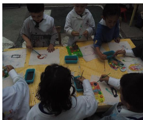
Foto 24: Estación 1: Pintando a sus amigos.