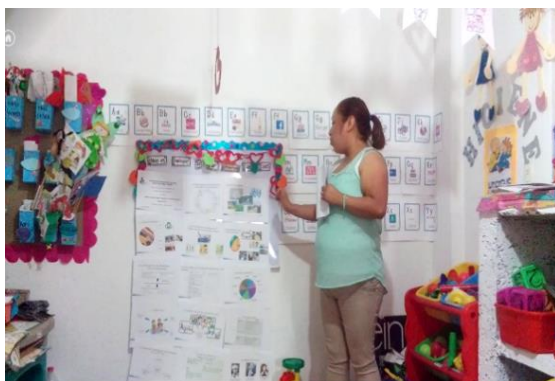
Foto 9: Plática con Directora y Maestras.

Se llevó acabo la fase de sensibilización en el cual se presentó el proyecto a la Directora del Colegio y docentes (Ver foto 9) .