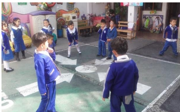
Fotos 5. Juegos tradicionales con los dos grupos de preescolar.

Con el grupo de segundo de preescolar se realizan juegos de rondas tradicionales (El lobo feroz, cinco ratoncitos, el mosquito) para lograr la convivencia y el respeto a las reglas, durante estos juegos se observó que los alumnos tienen problemas para relacionarse a la hora de convivir con sus compañeros en las diversas actividades grupales ya que no respetan turnos, no comparten, se enojan y en ocasiones responden con agresiones físicas (pellizcos, mordidas, caras feas o empujones (Ver foto 5) ).