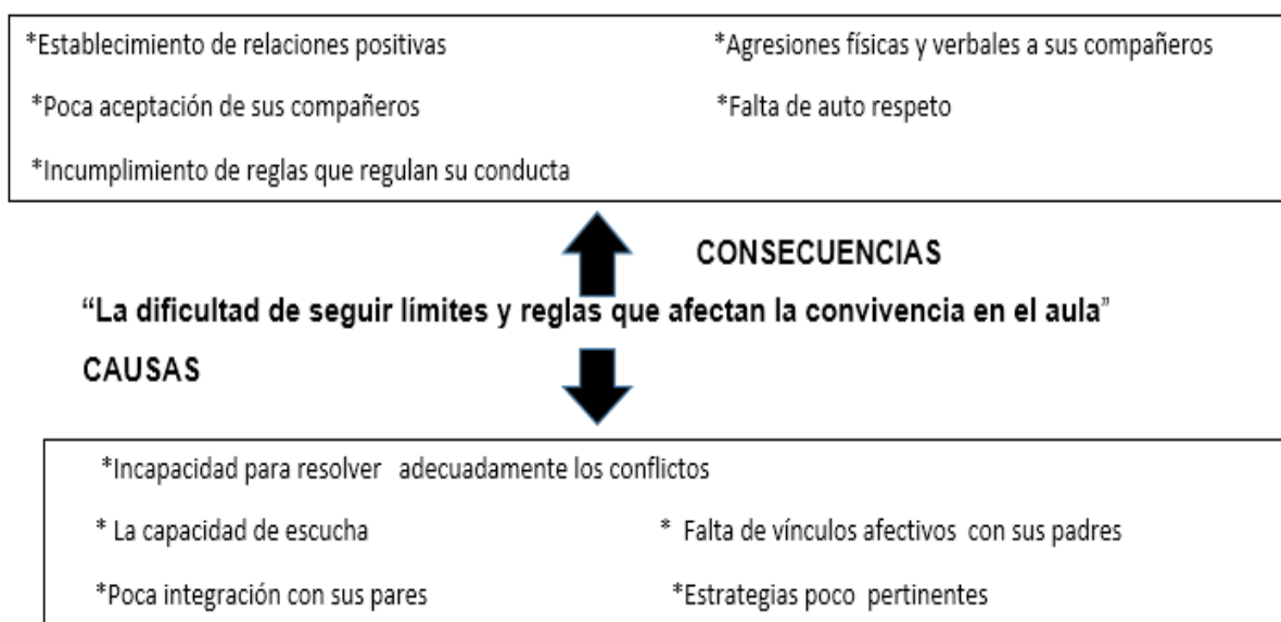
Tabla 2. Árbol de problemas

La problemática identificada es la dificultad de seguir límites y reglas que afectan la convivencia en el aula; para ubicarla utilicé la técnica del árbol de problemas, “Es una técnica metodológica que permite describir un problema, además conocer y comprender la relación entre las causas que están originando el problema y los posibles efectos que se derivan del mismo, en el cual se debe formular el problema central de modo que sea claro y preciso, así como identificar quiénes son los sujetos directos que se ven afectados por el problema” 20 porque me permite identificar las causas y consecuencias que se genera en mi aula (Ver tabla 2) .