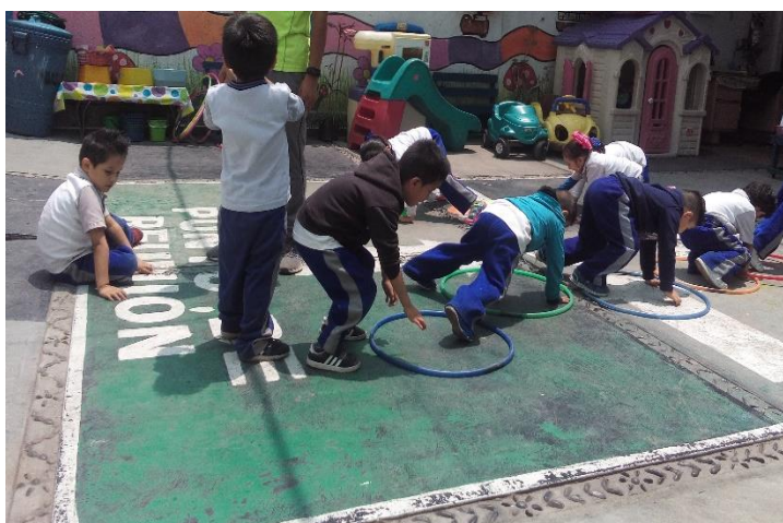
Foto 7: Interacción con otros niños.

Para registrar los resultados, se utilizó una lista de cotejo para el diagnóstico grupal en base a la convivencia en el aula. (Ver tabla 3).