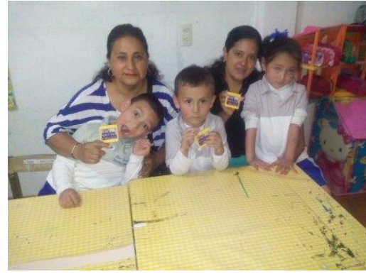
Foto 39: Las mamás con su llavero terminado.

Para evaluar la situación didáctica se elaboró una lista de cotejo ( No. 14 ) en que se muestran los resultados de cada indicador y podemos ver cómo han logrado integrarse y seguir las reglas en compañía de sus mamás en la actividad.