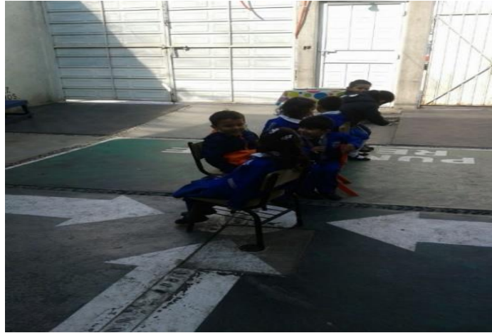
Foto 21: Los niños acomodan sus sillas al iniciar el juego.

Al terminar de explicar sus ideas, se les recordó cuáles eran las reglas del juego, que al escuchar la música debemos de bailar alrededor de las sillas sin tocarlas y sin empujar a los compañeros y cuando pare la música buscar un silla aunque no sea de ellos y sentarse, el que se quede parado tendrá que salir del juego hasta que haya un ganador.