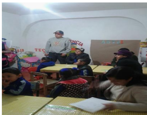
Foto 10: Plática con Padres de familia.