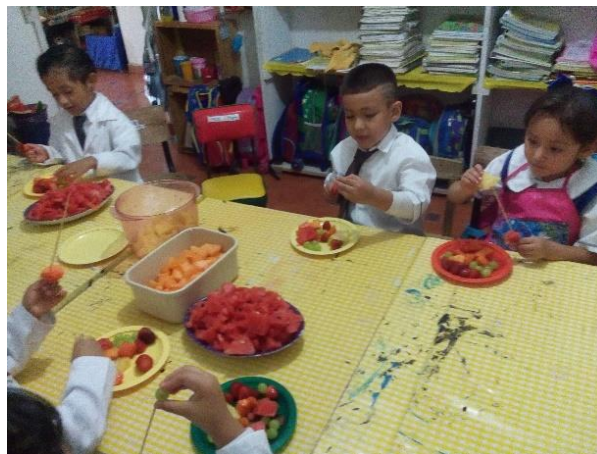
Foto 35: Insertando la fruta con cuidado.

Al terminar de cortar la fruta se les entregó el palito para brocheta, siempre mencionando que deben de tener cuidado de no lastimarse, aunque Alexander quería solamente uvas y no las quería compartir con los demás ( Ver foto 35 ).