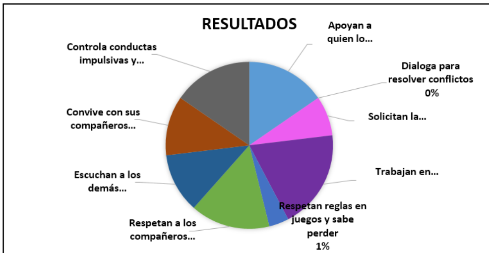
Gráfica 1: Resultados del diagnóstico

La problemática presente en los alumnos de 2º. de preescolar del Colegio Infantil Año 2000, se identificó con base a los resultados obtenidos del diagnóstico por medio del árbol de problemas, las actividades realizadas en el salón y la lista de cotejo, se hizo la codificación y se representaron los resultados en una gráfica ( Ver gráfica 1 ); destacan las actitudes de agresión física y verbal a los compañeros, (empujando, se enojan constantemente si cambian de amigos o amigas, intolerancia, faltas de respeto, no cooperan para guardar los juguetes, no respetan turnos de participación y la capacidad de escucha hacia sus compañeros, se les dificulta solicitar la palabra para expresarse y si no se les hace caso en el momento gritan para llamar la atención)