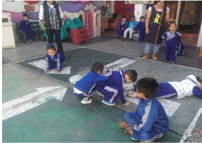
Foto 8: Hora del recreo.

reglas que no contribuyen al trabajo en equipo, esto pasa entre los niños de preescolar 2 en la hora del recreo al igual que en el aula. (Ver foto 8).