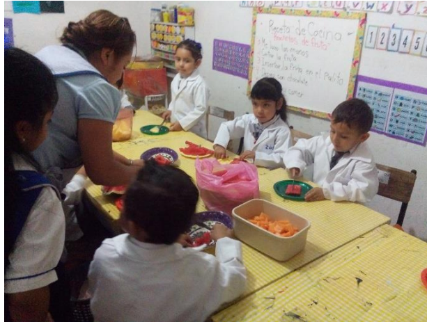
Foto 34: Cortando la fruta con cuidado.

Comenzamos a cortar la fruta y dejarla en los recipientes ( Ver foto 34 ).