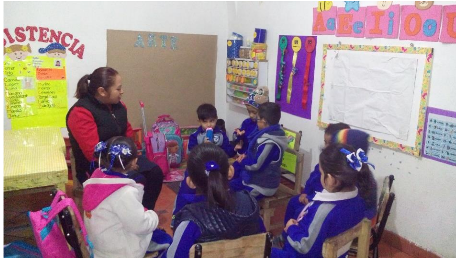
Foto 12: Los niños expresan sus ideas.

Para expresar sus ideas se les mostró el micrófono y se les mencionó que para poder hablar tendrían que utilizarlo y esperar su turno, escuchando con atención a los demás. (Foto 12).