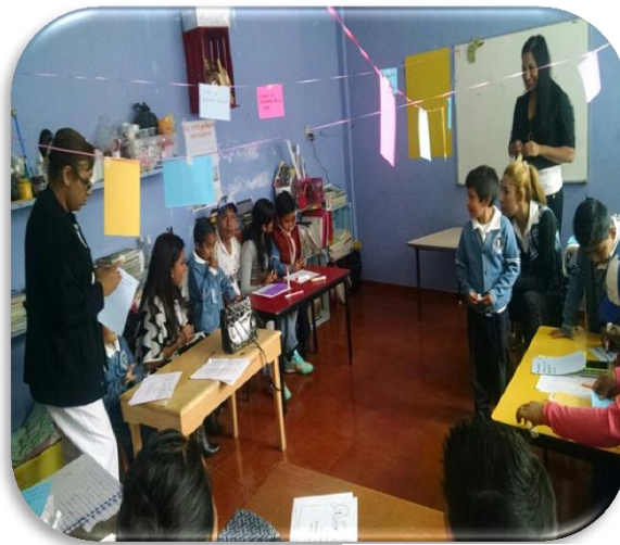
Foto 11. Taller con alumnos y padres de familia.

El trabajo que realizan las docentes con los padres de familia es fructífero, ya que apoyan en todo momento (ver foto 11)