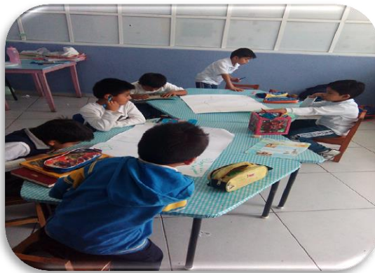
Foto. 14. Actividades dentro del salón.

Los temas se refuerzan con tareas e investigaciones por parte de los alumnos o bien nos apoyamos del uso de las tecnologías y se les deja ver videos para que los alumnos realicen comentarios.