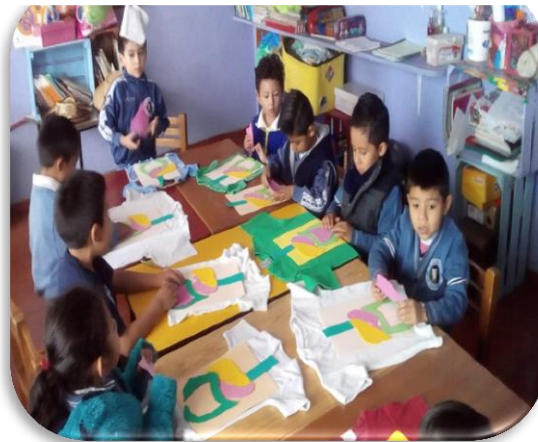
Foto 10. Salón de clases durante el desarrollo de actividades

Cuando en las aulas hay más catorce alumnos la docente cuenta con un apoyo para realizar actividades.