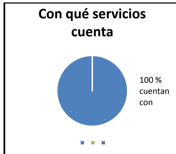
Gráfico 3. Servicios con los que cuentan las casas

f). Los hogares de las familias de los alumnos cuentan con los servicios principales como luz, agua, teléfono, drenaje, internet entre otros (ver gráfico 3). Los alumnos viven decorosamente en lugares céntricos con todos los servicios que brinda el pueblo como lo son: tiendas, farmacias, dentistas u otros servicios; teniendo en la vía principal el paso de transporte público así como taxis, e incluso automóvil propio.