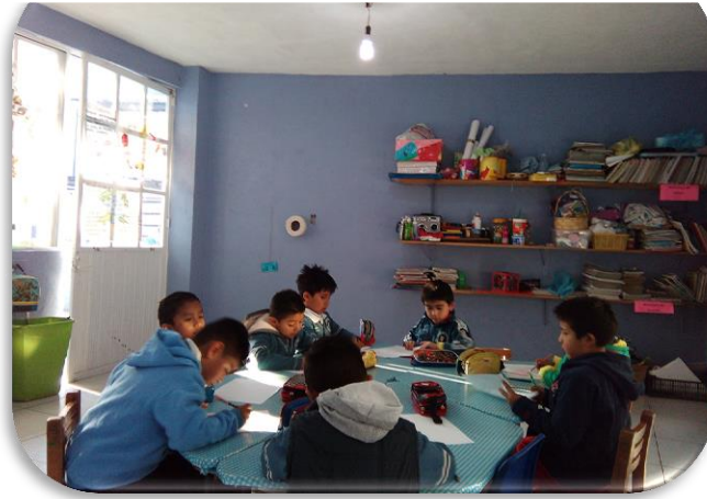
Foto 25.Elaboración de boceto para elaborar carrito

Los alumnos crearon un boceto para crear a su propio Chipirilo, en el patio de la escuela se colocan cajas de huevo ya con resortes para que se puedan montar en sus carros, pinturas, papel de colores y diversos materiales, los alumnos seleccionaron los materiales con los que iban a decorar su propio carro.