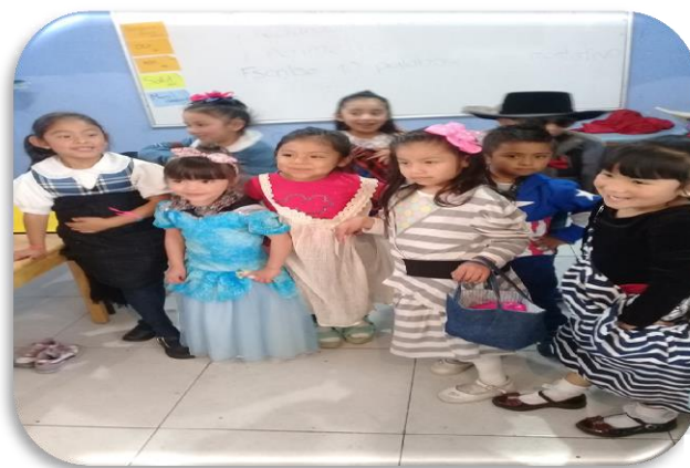
Foto 24. Representación de disfraces.

Los alumnos con la caja de disfraces recrearon una historia que tenia implícito un problema y se tenia que resolver mediante el dialogo (ver foto 24)