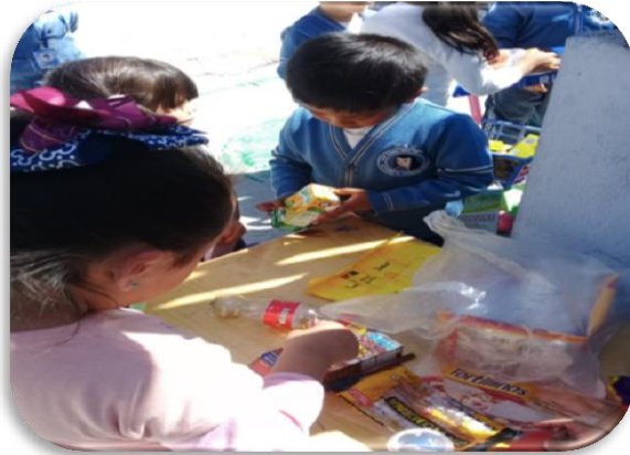
Foto. 12. Actividades con material didáctico

Durante las actividades son niños muy participativos, así como también muy entusiastas (ver foto 12)