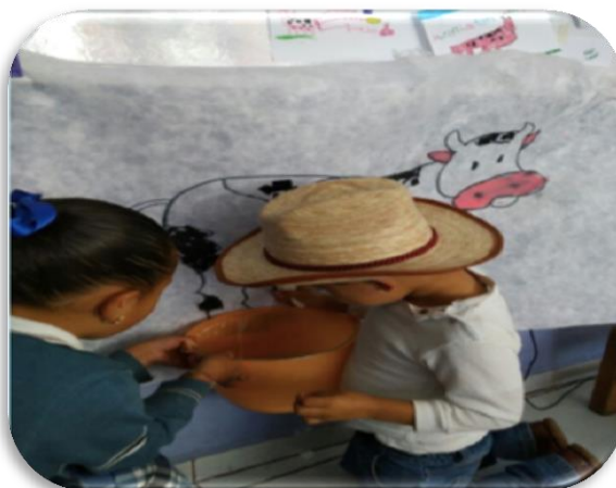
Foto. 13. Actividad la granja.

Entre los principales juegos que realizan los niños se encuentran: juegos simbólicos donde utilizan el material de construcción, o bien manipulan material para experimentos o realizan actividades al aire libre (ver foto 13)