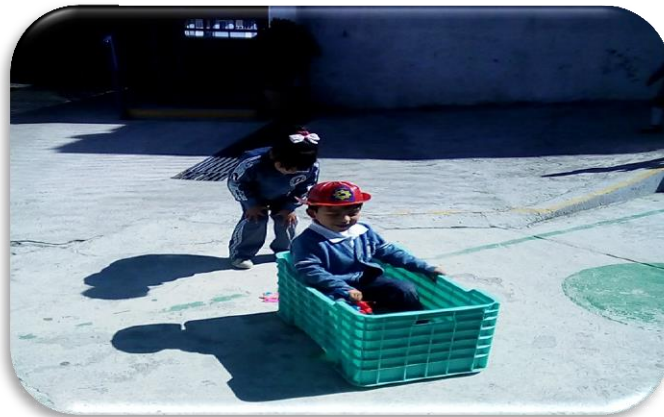
Foto 26. Cuido a mi amigo

A cada alumno se les asigno una pareja para trabajar a la hora de recreo, cada equipo tomo una tarjeta con una deficiencia ya sea visual, motora, del habla, escucha etc. Un amigo tenía que cuidar al otro ya que el que no podía ver se cubrió los ojos con una mascada, o se les inmovilizo una manita o no podían hablar solamente a señas (ver foto 26)