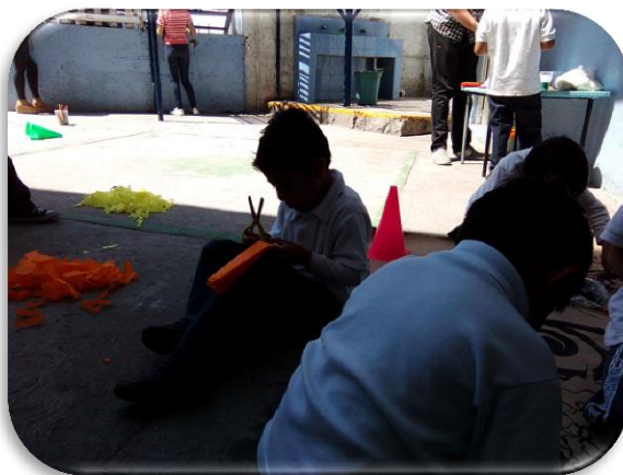
Foto. 15. Actividades de artes.

Para el trabajo de los Campos Formativos la docente es la responsable de la programación de ellos, en lo particular trabajo un Campo Formativo diario dándole mayor peso a lenguaje y comunicación y pensamiento matemático incorporando la transversalidad en el trabajo.