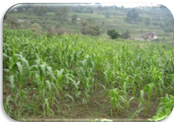
Foto 1. Comunidad semirural.

En el centro del pueblo hay tiendas, papelerías, carnicerías, puestos de comida y un mercado ambulante tipo tianguis que trabaja todos los días de la semana , junto al corral de toros hay una unidad de servicios médicos para los beneficiarios que otorga el Programa Oportunidades .