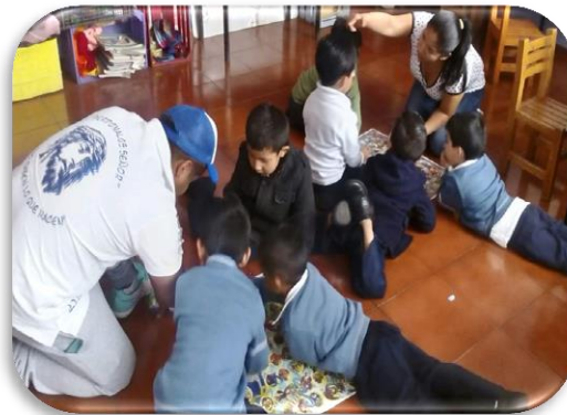
Foto 7. Padres de familia participando en juegos

La participación activa de los padres de familia marca la diferencia de aptitudes y disposición de los alumnos para llevar a cabo diversas actividades ya que, al verlos involucrados, hay motivación y entusiasmo para participar en las actividades (ver foto 7)