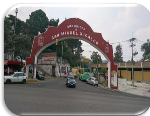
Foto 2. Arco del pueblo de San Miguel Xicalco