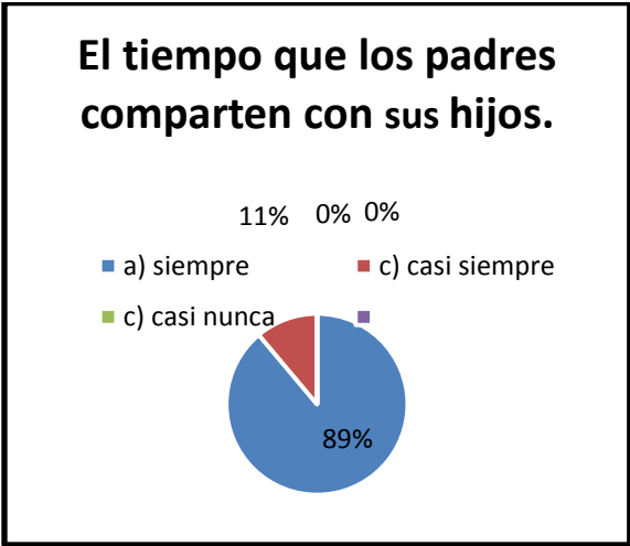
Gráfico 1. Tiempo compartido de los padres de familia con sus hijos.

Los padres de familia tratan de compartir tiempo de calidad para dar seguridad y apoyo al alumno (ver gráfico 1)