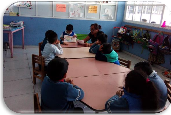
Foto. 16. Actividad de lectura por parte de una mamá

Para la realización de las situaciones de aprendizaje me apoyo de diversos materiales didácticos como: fichas, domino, lotería de números, cuentas para el conteo, aros, pelotas de goma, regletas etc.