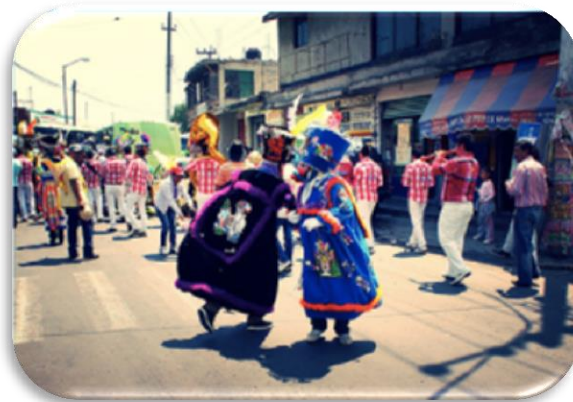
Foto 3. Danza típica chinelos

Todas las noches en el atrio de la Iglesia se encienden fuegos pirotécnicos conocidos como “castillos”, hay banda musical amenizando la noche, se presentan bailes tradicionales como los chinelos, santiagueros, moros, arrieros (ver foto 3)