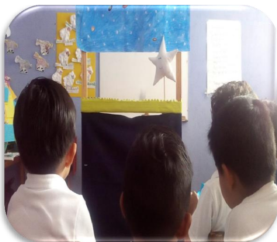
Foto 9. Participación de lectura por madre de familia.

De consumo de alimentos saludables en las ceremonias cívicas se expone el plato del bien comer y se recomienda la jarra del buen beber y la importancia de llevar una vida sana, para el cuidado del medio ambiente y limpieza del entorno escolar se realizan carteles del uso y cuidado del agua, luz y otros recursos naturales.