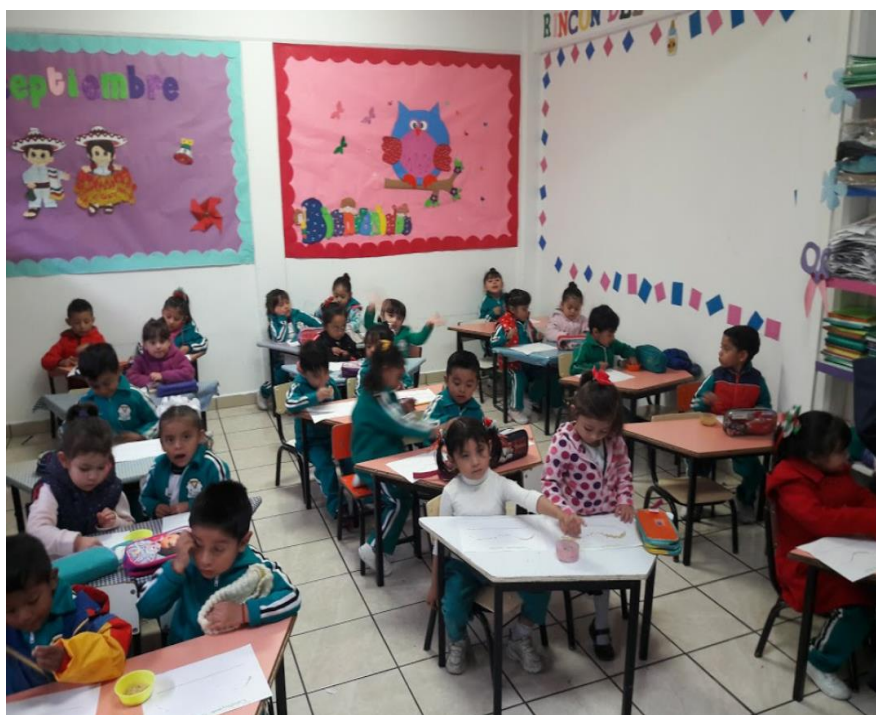
Foto.7 Foto del grupo Elaboración propia

En cuanto a la psicomotricidad se observa que les cuesta agarrar las crayolas en forma correcta y solo 5 de ellos lo hicieron bien. El trabajo de motricidad fina y gruesa adquieren relevancia para el desarrollo integral de los niños, les agrada salir al patio a realizar actividades que implican movimiento corporal como jugar con pelota, materiales o bailar canciones, jugar con material de ensamble y plastilina.( Ver foto, N. 8)