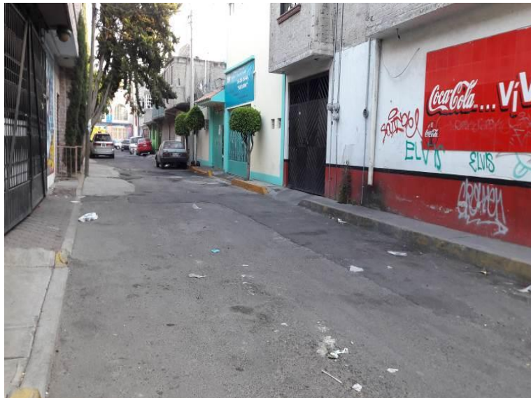
Foto 2. Aspecto de la comunidad.