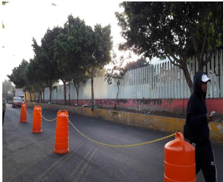
Foto 3. Calle de la Comunidad Elaboración