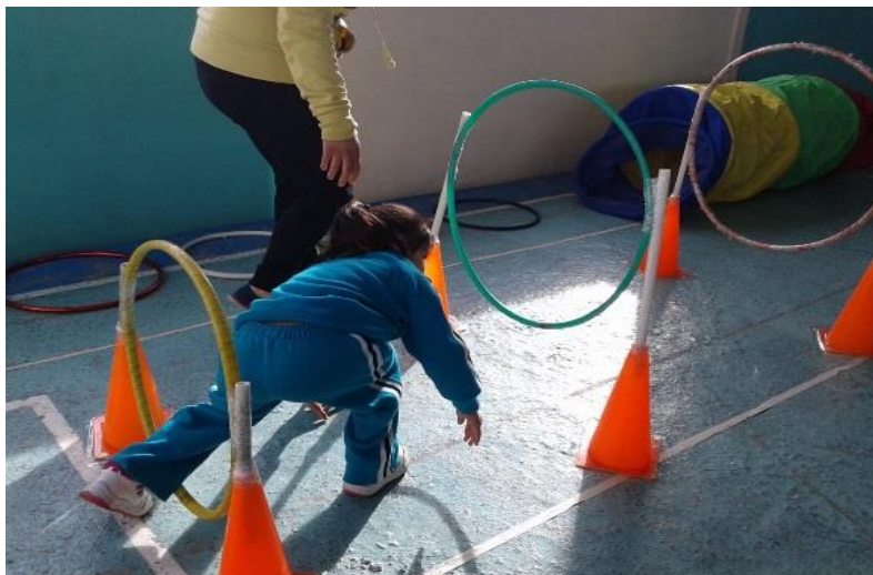
Foto. 9 Mini olimpiadas

Para seguir reforzando el desarrollo motor en los alumnos y dar seguimiento a la problemática ya mencionada que se presenta en el grupo se realizaron algunas planeaciones en las que se plantean situaciones didácticas y en ellas se desarrollan diversas estrategias como correr, saltar, caminar, bailar, mover el cuerpo en general, se trabajaron de manera semanal. En ellas se atendieron las siguientes nociones: coordinación fuerza y equilibrio de manera paralela y continua.