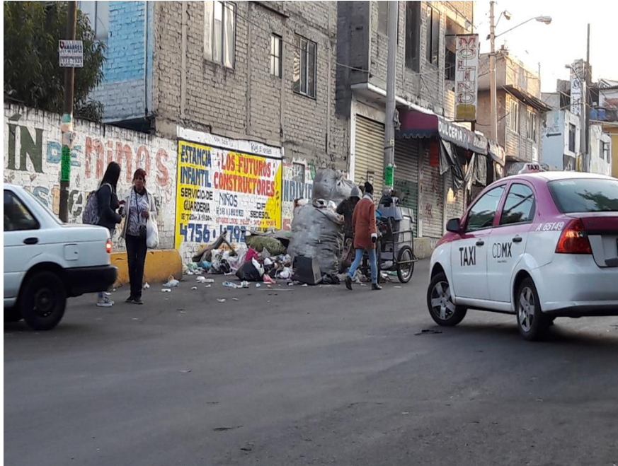
Foto. 5 Acumulación de basura en las calles de la colonia

Antes el camellón que se encuentra a lo largo de la calle principal que da a la escuela tenía árboles y la gente colocó enrejado para protegerlos, sin embargo; esto resultó peor porque ahora es ahí donde se concentran los drogadictos y se quedan a dormir en la calle.