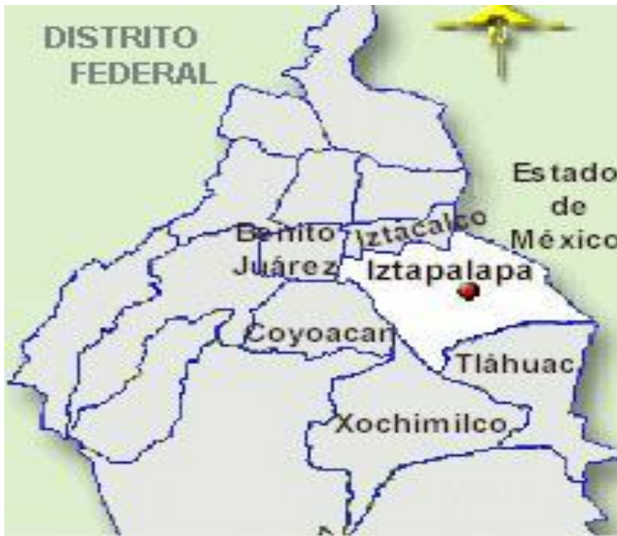
Foto. 1 Localización geográfica de la delegación Iztapalapa

En la proximidades de Culhuacán cerca de la conquista española, se desarrolló Iztapalapa, siendo uno de los valles reales que rodeaba Tenochtitlan, a la cual abastecía y protegía. Fue gobernada por Cuitláhuac, hermano de Moctezuma II, desde los últimos años del siglo XVI, hasta la llegada de los españoles, Hernán Cortés asignó seis pueblos como propios de la ciudad de México entre ellos Iztapalapa, Mexicalzingo, Culhuacán y Churubusco. Durante la centuria y hasta principios del siglo XX, en el pueblo de Iztapalapa existieron grandes haciendas: La soledad La Purísima, San Juanico, Santa Cruz Meyehualco, Santa María Acatitla, Santa María Ixtlahuaca, Tlaltenco y San Lorenzo Tezonco.