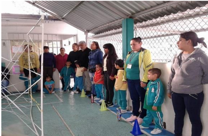
Foto. 8 Mini olimpiadas