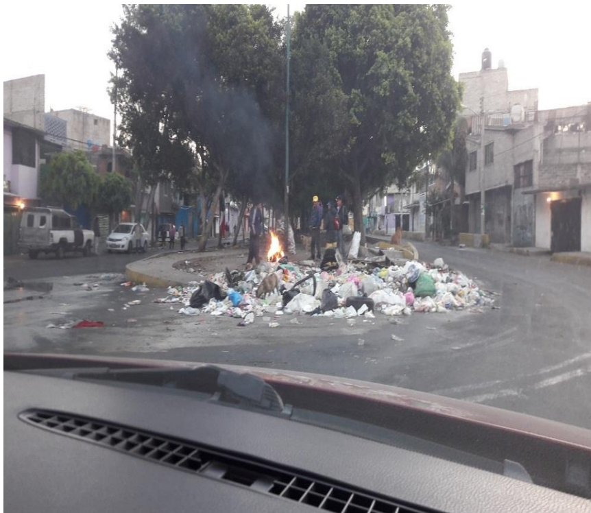
Foto. 4. Elaboración propia Problemas de basura que enfrenta la comunidad

tapa el drenaje evitando que el agua se vaya de manera normal, provocando inundaciones al grado que los automóviles les cuesta trabajo pasar. (Ver foto, N. 4)