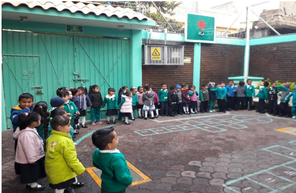
Foto. 6 Elaboración propia Los alumnos durante el desarrollo de actividades

El grupo jamás se queda solo cuando alguna de las dos docentes por alguna razón llegara tarde está la otra maestra; cabe mencionar que mi hora de entrada es a las 7: 40 am con tolerancia de 10 minutos; sin embargo, siempre llego muy temprano a las 7:00 am y el resto de mis compañeras dentro de su hora de entrada señalada. (Ver foto, N. 7)