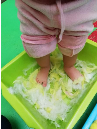
Foto 14. Alumnos trabajando la textura de plumas de ave con los pies.