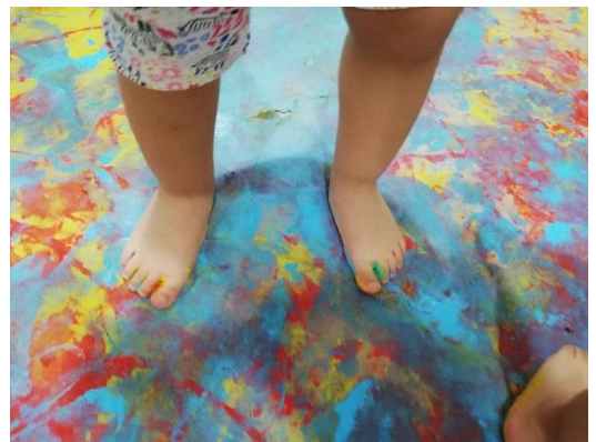
Foto 7. Sellos y maras realizadas con pintura y plantas de los pies de los alumnos de Maternal A .