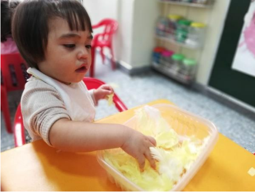
Foto 18. Alumna trabajando la textura de plumas de ave.