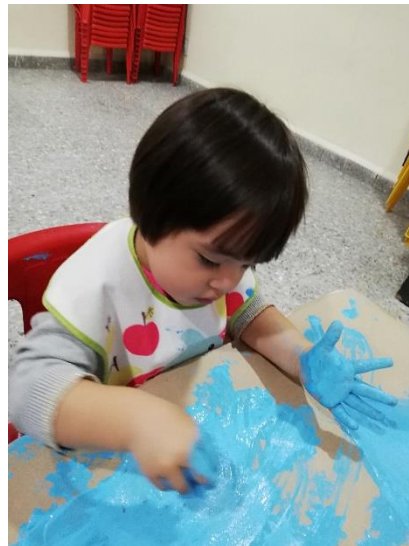
Foto 3- alumna experimentando con pintura, texturas y colores.