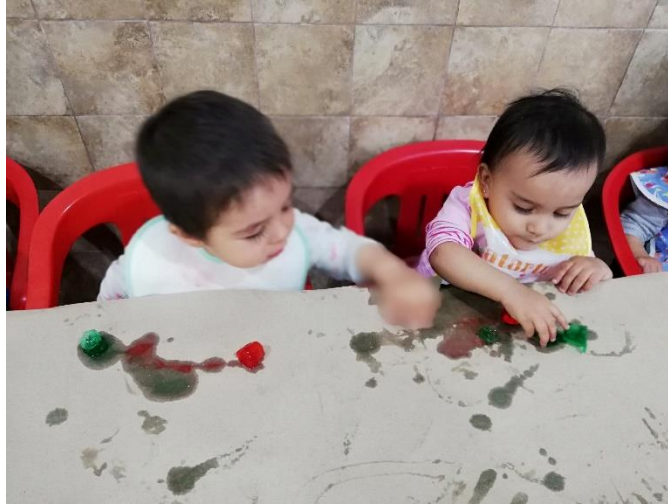
Foto 22. Alumnos garabateando con hielos de colores.