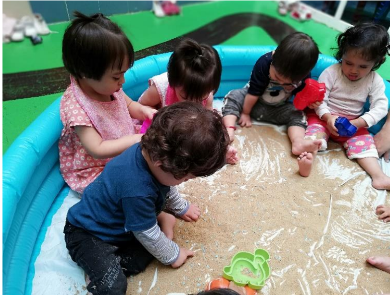
Foto 25. Alumnos experimentando sensaciones en la alberca de arena.