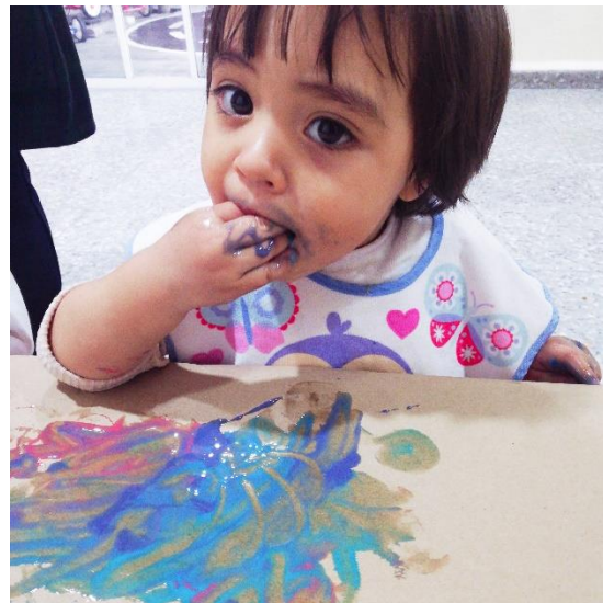
Foto 11. Alumna experimentando con sabores colores y texturas.