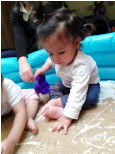
Foto 26. Alumna trabajando texturas con manos y pies.