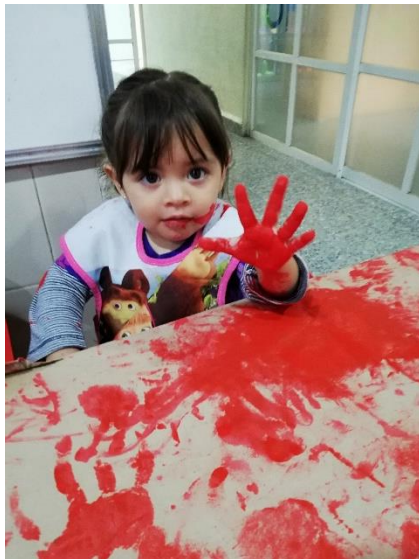
Foto 2. Alumna experimentando con pintura y dejando huellas con las palmas de sus manos.