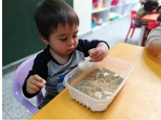
Foto 19. Alumno trabajando con textura de arena y conchas y caracoles de mar.