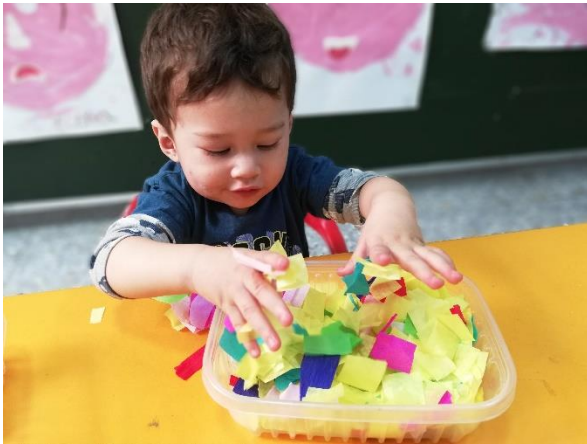
Foto 20. Alumno trabajando con la textura de papel china de colores.