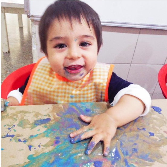
Foto 10: Alumno trabajando con pintura comestible.