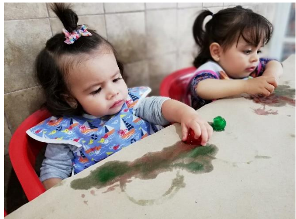
Foto 24. Alumnas experimentando con temperatura, colores y texturas.