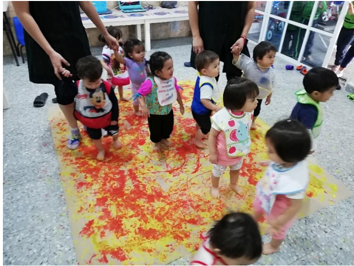
Foto 4. Alumnos experimentando con pintura base agua y pies.