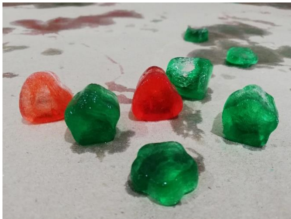
Foto 23. Hielos elaborados con pintura vegetal para experimentar con color y sensaciones.