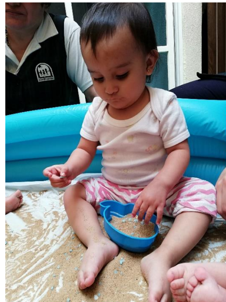
Foto 27. Alumna trabajando con moldes de figuras y arena.