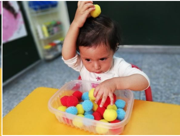
Foto 21. Alumna trabando con la textura de pompones de colores.