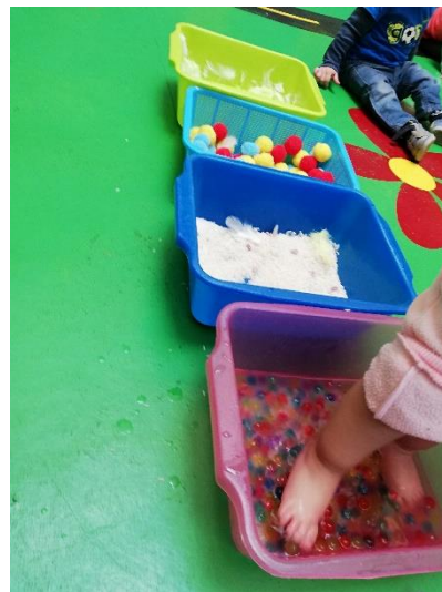
Foto 17. Recorrido por tinas sensoriales utilizando plantas de los pies. Fuente propia