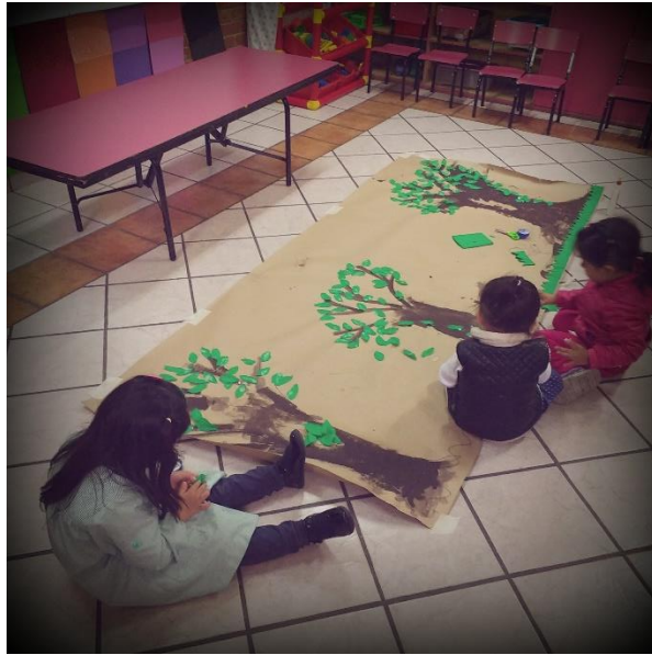
Foto 8. Alumnos realizando un collage a partir de diferentes materiales y texturas.