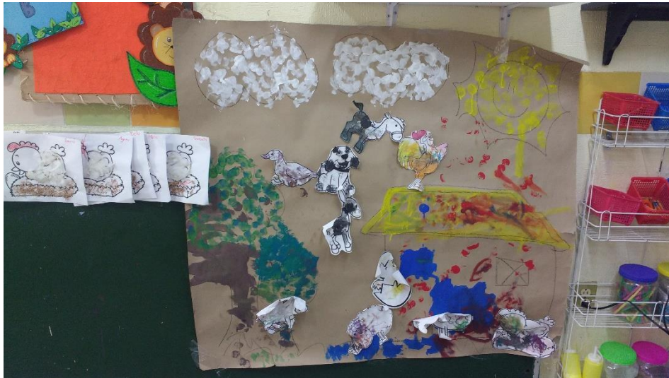
Foto 9. Collage resultado del trabajo de los alumnos sobre el tema de la granja.