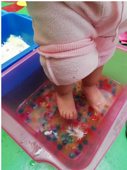
Foto 16. Experimentando la textura agua y bolitas de hidrogel.