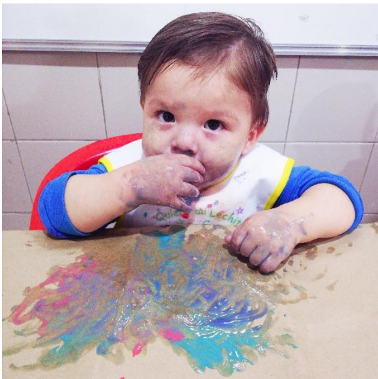
Foto 12. Alumno utilizando el sentido del tacto y gusto.