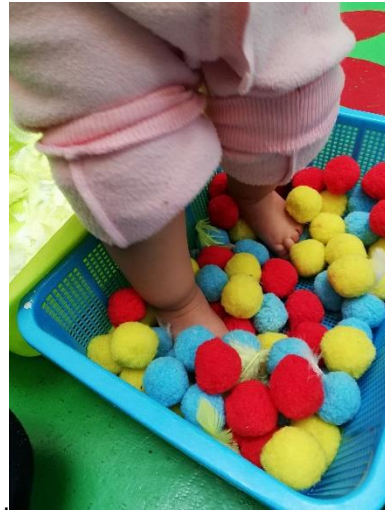
Foto 15. Experimentando la textura de pompones con los pies.