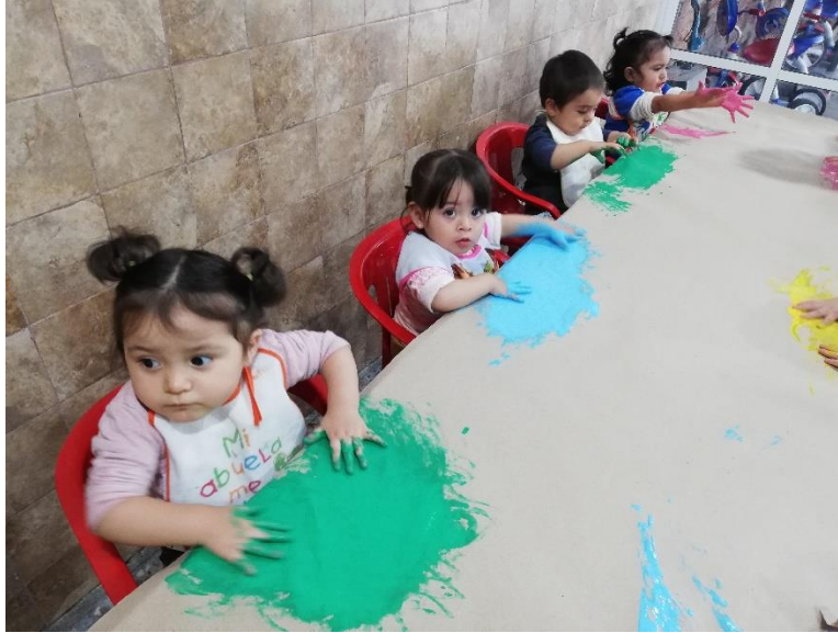
Foto1. Niños experimentando libremente con pintura base agua.