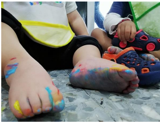
Foto 5. Alumno experimentando texturas con las plantas de sus pies.