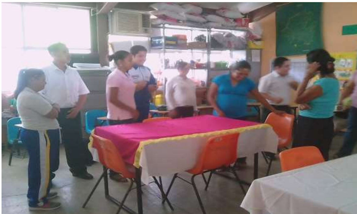
Anexo 17 Actividad de la Meta # 2

En esta imagen se puede observar la involucración de algunas madres de familia, al participar con sus hijos.