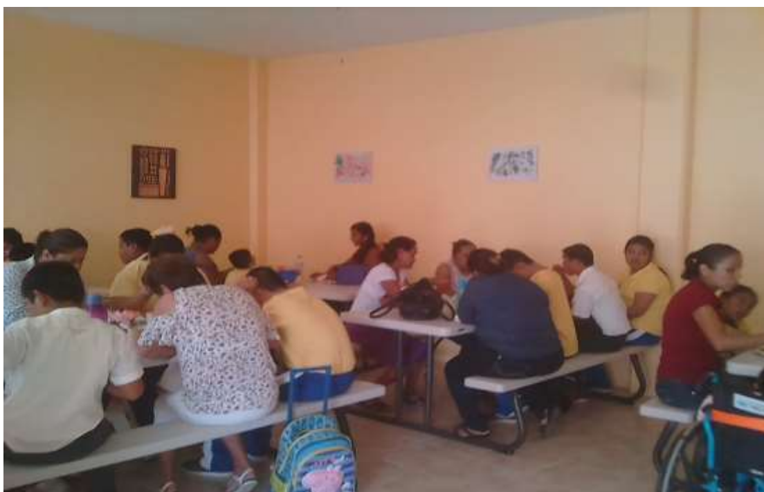
Anexo 18 Actividad de la Meta # 2

En esta imagen se puede observar la involucración de algunas madres de familia, al participar con sus hijos.