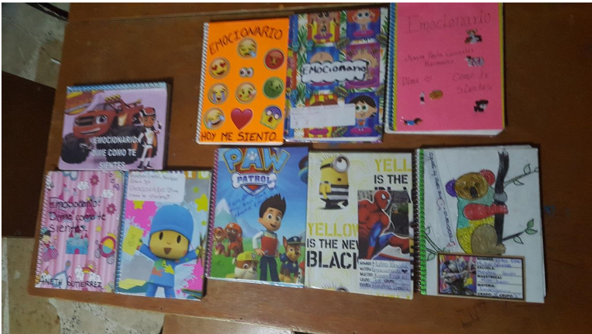
Emocionarios personalizados con apoyo de los padres de familia.