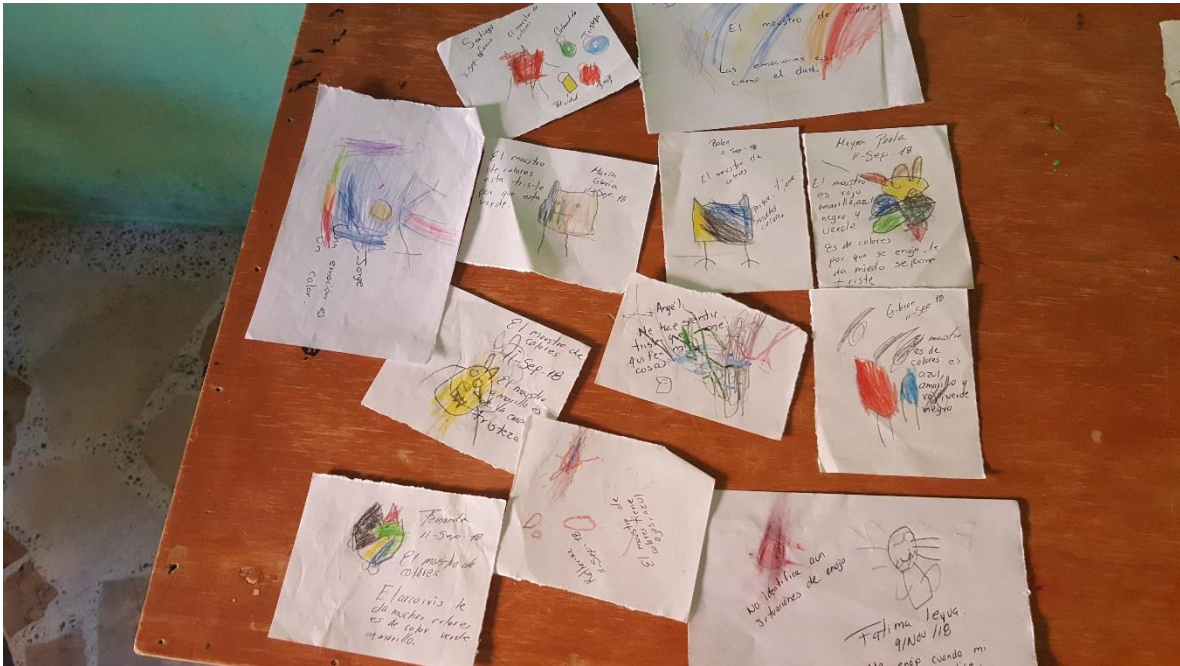
Producciones de los alumnos del monstruo de colores, describiendo como es para ellos el monstruo, porque es de colores y como es.