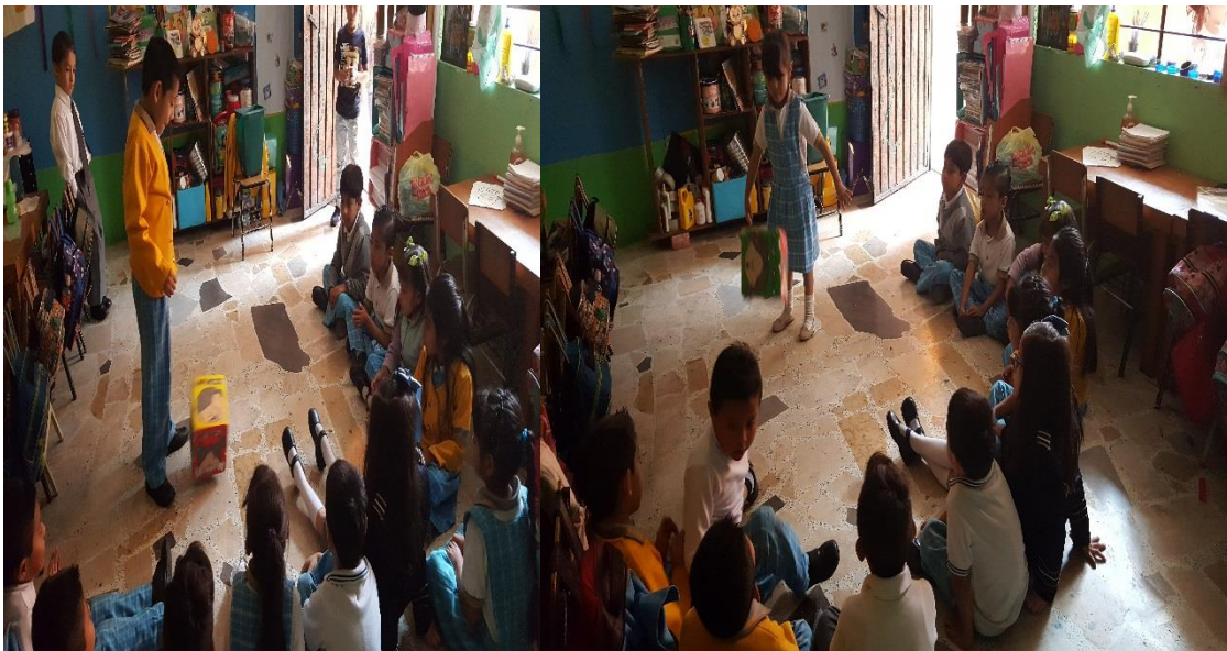
Los niños y las niñas lanzando el dado, representando la emoción mediante gestos y mencionando algún momento en que se hayan sentido así y porque.