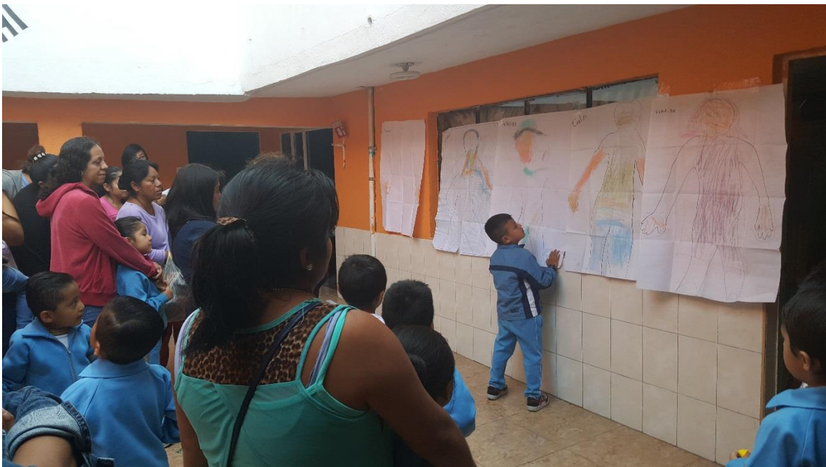
Los niños logran expresar sus emociones, como son y cómo se sienten en la clase abierta a padres de familia.