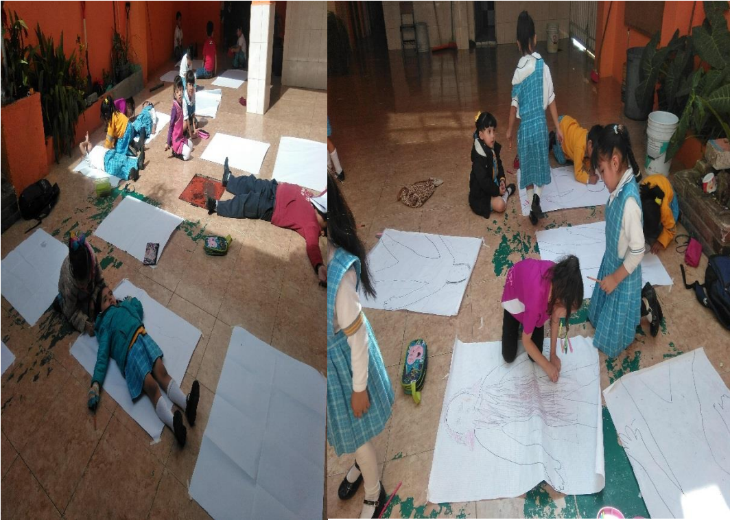
Realizando la silueta de su cuerpo con ayuda de sus compañeros y expresando las emociones que en ese momento sienten.