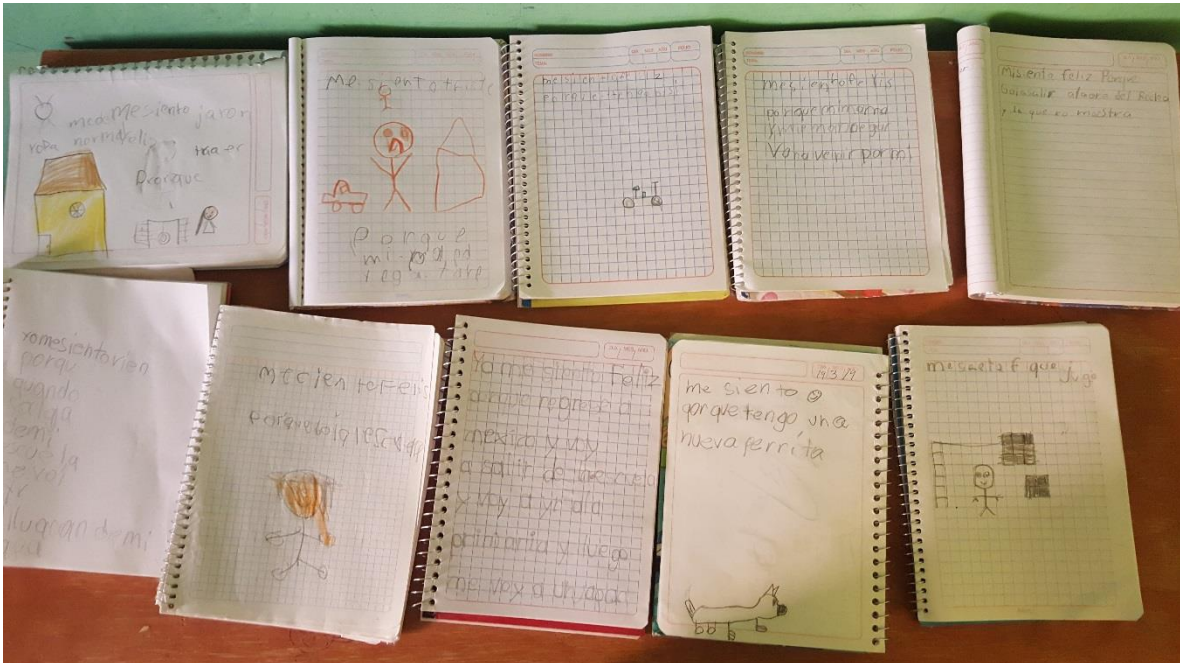
Niños y niñas logran expresar sus emociones mediante la escritura en su emocionario, identificando como se sienten en ese momento.