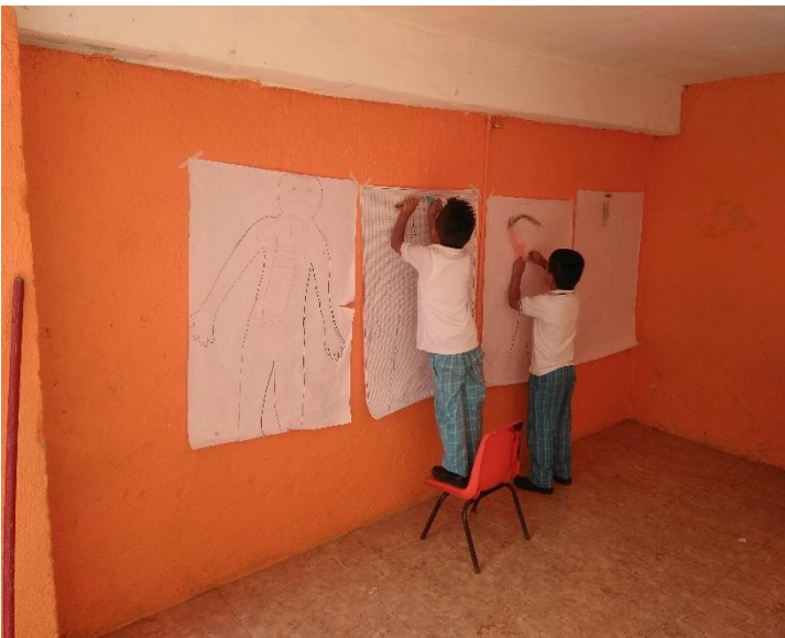
Personalizando su cuerpo con la emoción que sienten en ese momento y como se reconocen.