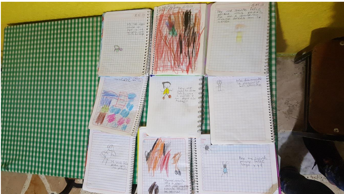
Primeras producciones de los niños y niñas de tercero de preescolar en su emocionario, donde expresan sus emociones mediante el dibujo y explican a la docente como se sienten.