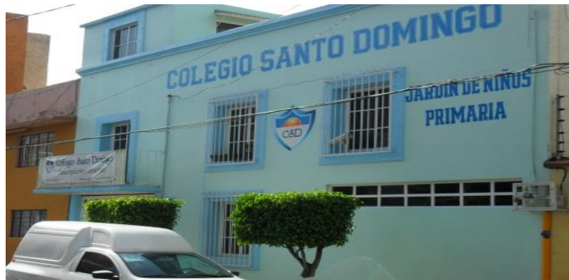
Fachada del "Colegio Santo Domingo" 19

La Escuela es un edificio de 3 pisos, en su mayor parte construida por concreto.