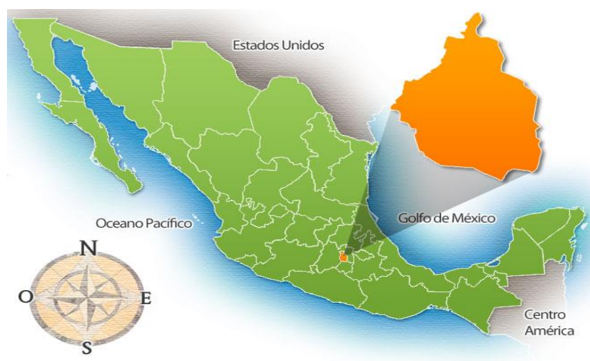
Localización Ciudad de México 4

Ubicación de la escuela en la cual se establece la problemática: El nombre de la Institución es Colegio “Santo Domingo”, se encuentra ubicado en la República Mexicana, en la Ciudad de México, Delegación Coyoacán, en la Calle de Ocozal Número 13, Colonia Pedregal de Santo Domingo, en la Delegación Coyoacán.