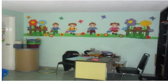
Salón de kínder 2

Cada salón de kínder tiene su Profesor y un Asistente Educativo.