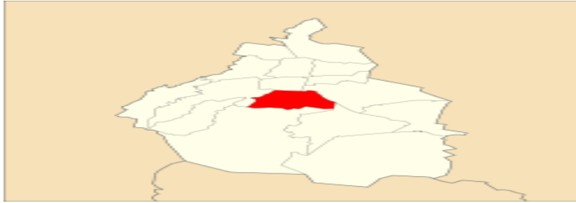
Mapa de la Ciudad de México, Delegación Coyoacán 5