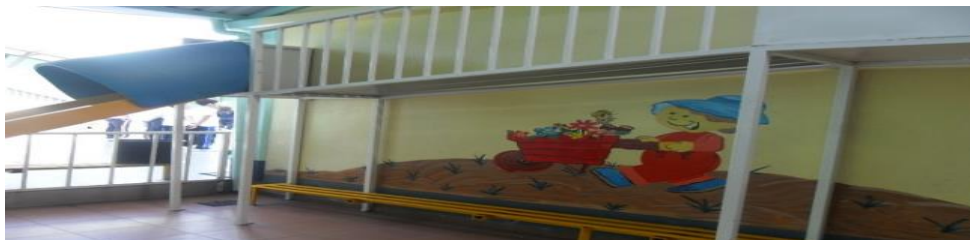
Área de juegos para jardín de niños. 21

Se tiene un patio de aproximadamente 20 X 20 metros, tanto para Kínder como para Primaria y un área de juegos exclusiva para niños de Kínder y Cooperativa Escolar; así como un sótano y un consultorio médico.