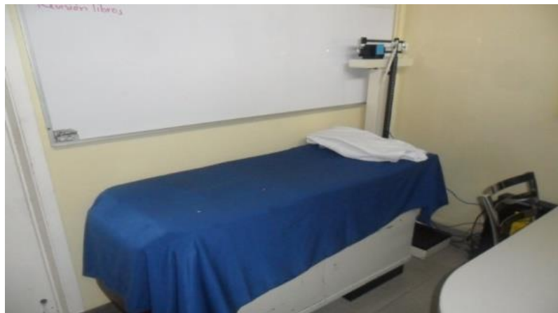
Consultorio médico. 22

El plantel cuenta con Servicio Médico y Apoyo Psicológico, tanto para alumnos como para Profesores.