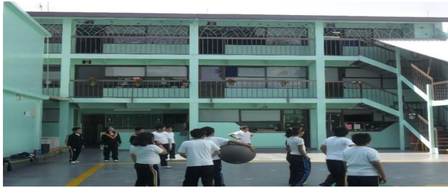
Interior del Colegio Santo Domingo 20

Al fondo se encuentran los salones. La planta baja la ocupa Jardín de Niños, con 4 salones (Maternal, Kínder I, Kínder II y Preprimaria).