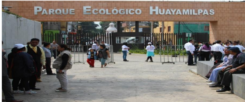
Parque ecológico Huayamilpas 12