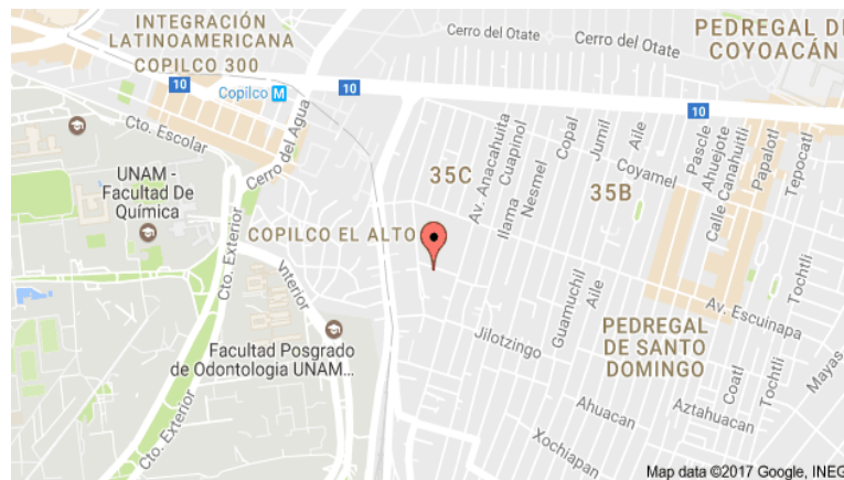
Croquis de la ubicación de la Institución 18