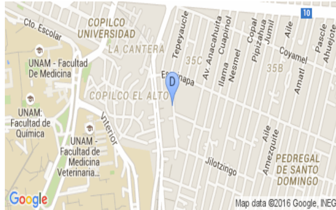
Mapa de ubicación 10