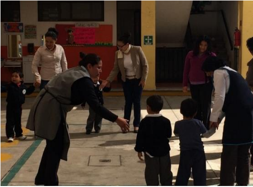
Ronda con padres de familia y alumnos reciclaje