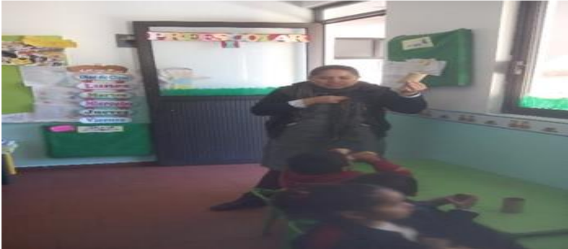
Recolectando rollos de cartón

Se muestran imágenes de actividades donde se reciclaron los rollos donde propusieron crear una lapicera.