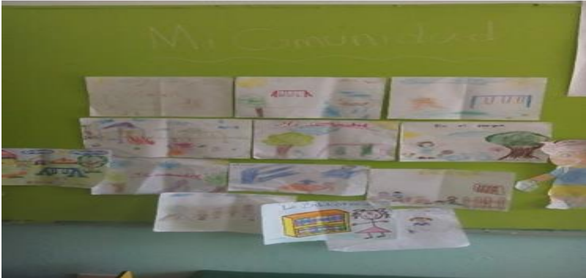
Mural de investigaciones de la comunidad.