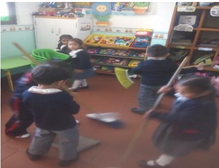
Organizando la limpieza del aula