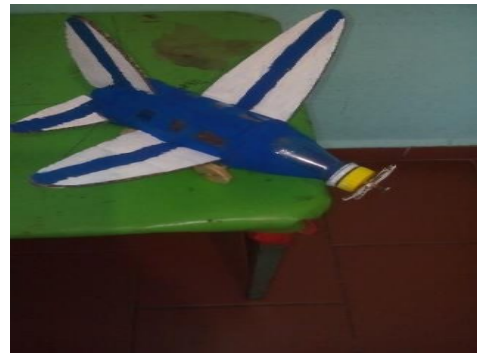
Avión elaborado con botella de refresco