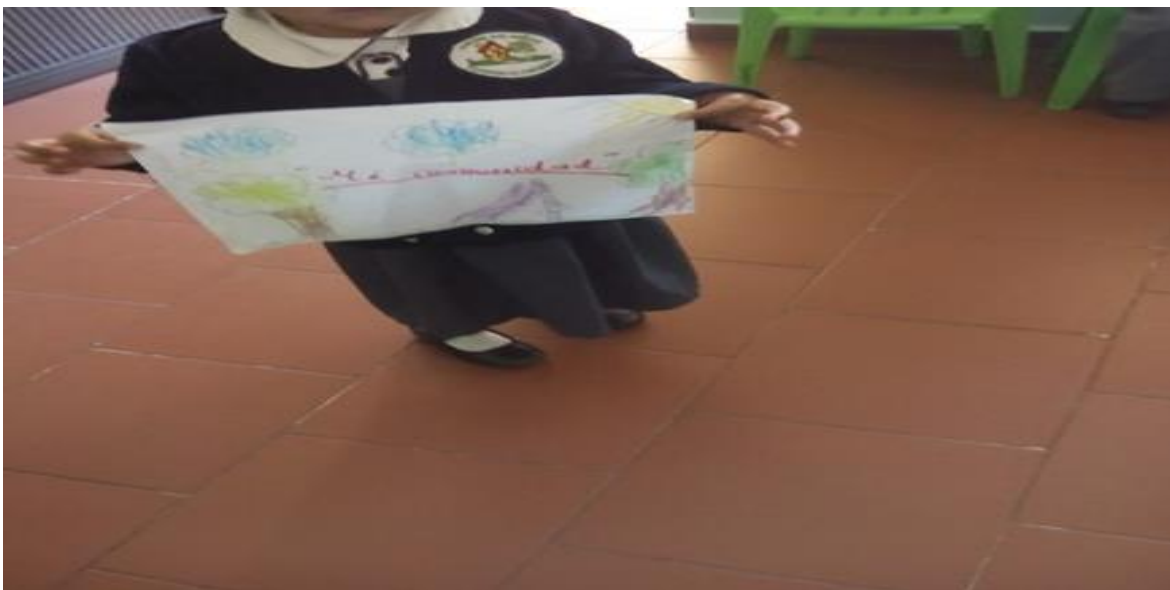
Compartiendo su experiencia de su comunidad.

Todos los niños de preescolar 1, pegaron sus imágenes de su comunidad en la pared y les causo emoción que tomará en cuenta lo que investigaron y compartir sus experiencias, aunque surgen dudas como que es la contingencia y les pedí que siguiéramos investigando en casa para comentar en la escuela la importancia de cuidar el medio ambiente. Pude notar que les gusta apreciar los espacios de su comunidad.