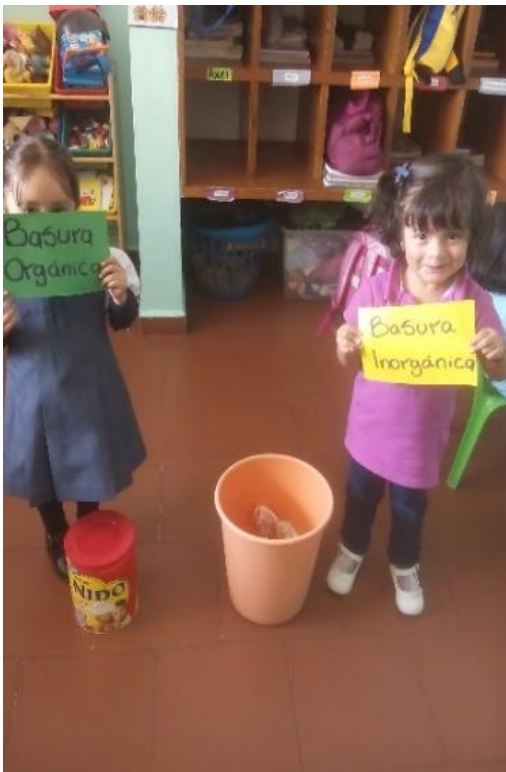
Aprendiendo a separar la basura

Los niños participaron en la decoración de los botes y fue así como identificaran con facilidad la clasificación de basura orgánica e inorgánica.