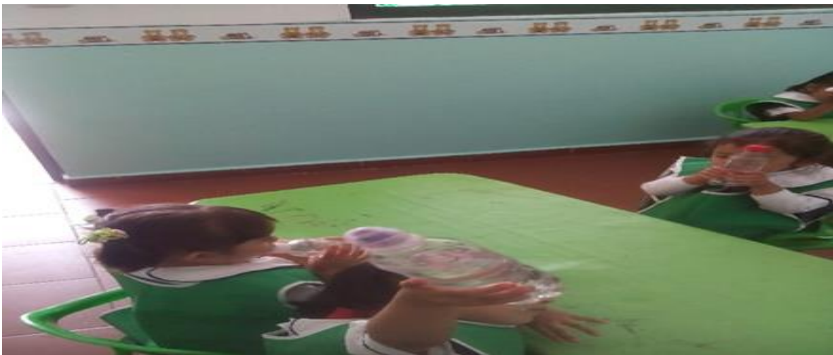
Los niños mostrando las botellas que se pueden reciclar

En los niños provoqué el interés de guardar su botella de agua y durante el día fueron persistentes para realizar su manualidad e identificaron materiales que se pueden reciclar.