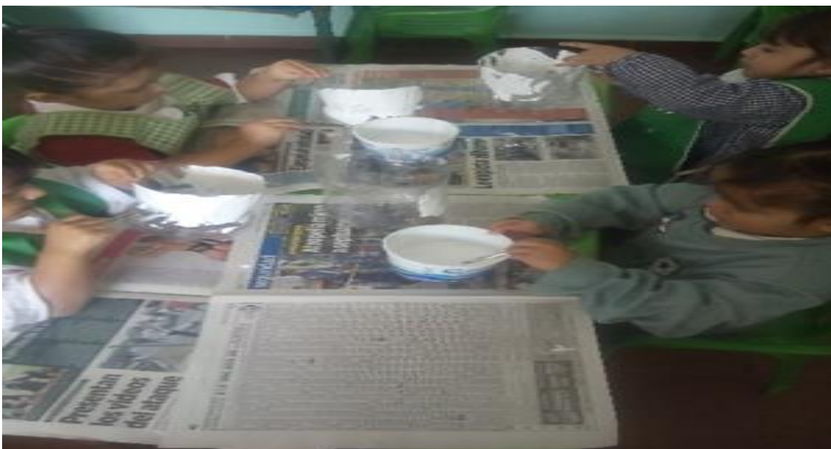
Pintando botellas de plástico

Esta sesión fue de gran importancia para los niños conocer qué tipo de materiales se pueden reutilizar ya que los niños no sabían que podían crear una manualidad con diversos materiales, al ver los resultados de lo que crearon con su botella fue de gran interés ya que dan sugerencias y comparten lo que saben de su medio ambiente.