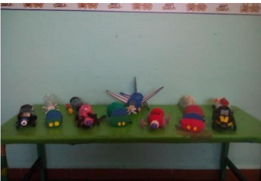
Manualidades creadas con materiales de reciclaje

La asistencia fue solo de la mitad del grupo pero se comprometieron a apoyarme con las actividades.