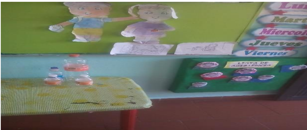
Recolectando botellas de plástico