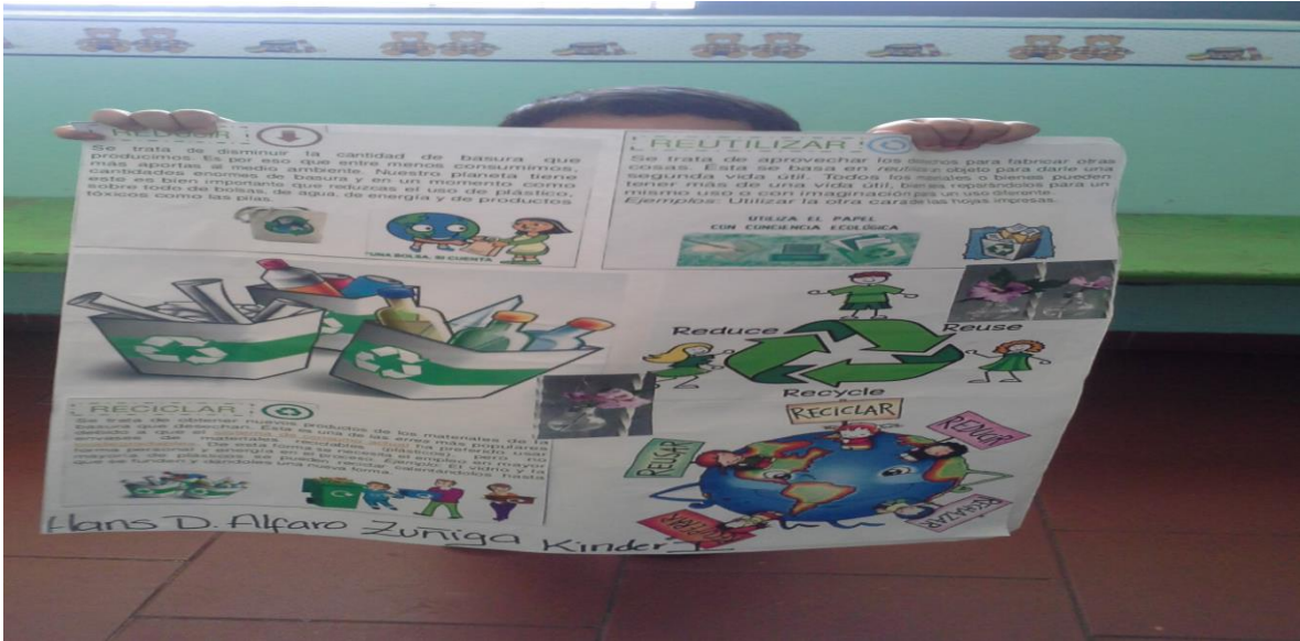
Exposición del reciclaje

A continuación se muestran las imágenes donde los alumnos exponen acerca del cuidado del medio ambiente.