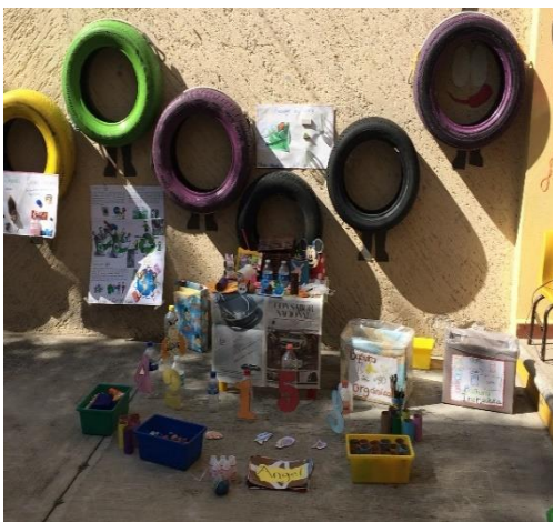
Exposición de materiales de reciclaje

Después que puse dos botes uno pequeño de color naranja de plástico y uno pequeño metálico los niños empezaron a cuestionar y argumentar que para que dos botes a sí que les dije uno es para la basura inorgánica y otro para la orgánica me dijeron que es eso, no comprendían los conceptos a sí que les expliqué que la inorgánica es donde se tiran todas las envolturas, botellas, papeles y la orgánica podremos depositar los residuos de los alimentos.