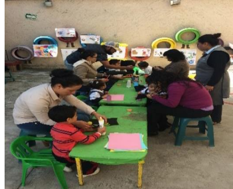
Creando manualidades con materiales de

Les pedí apoyo para los proyectos con los materiales, e investigaciones que se realizarían. Para ampliar el tema y realizaron una manualidad utilizando botellas de agua, elaboraron un medio de transporte para sus hijos.