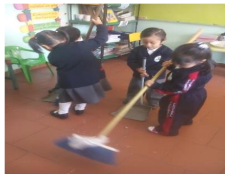
Los niños limpiando su aula

Así que les proporcioné escobas, trapos, recogedor y los coloque en parejas para realizar limpieza dentro del aula, la intención era limpiar el patio pero debido a la contingencia limpiamos el salón.