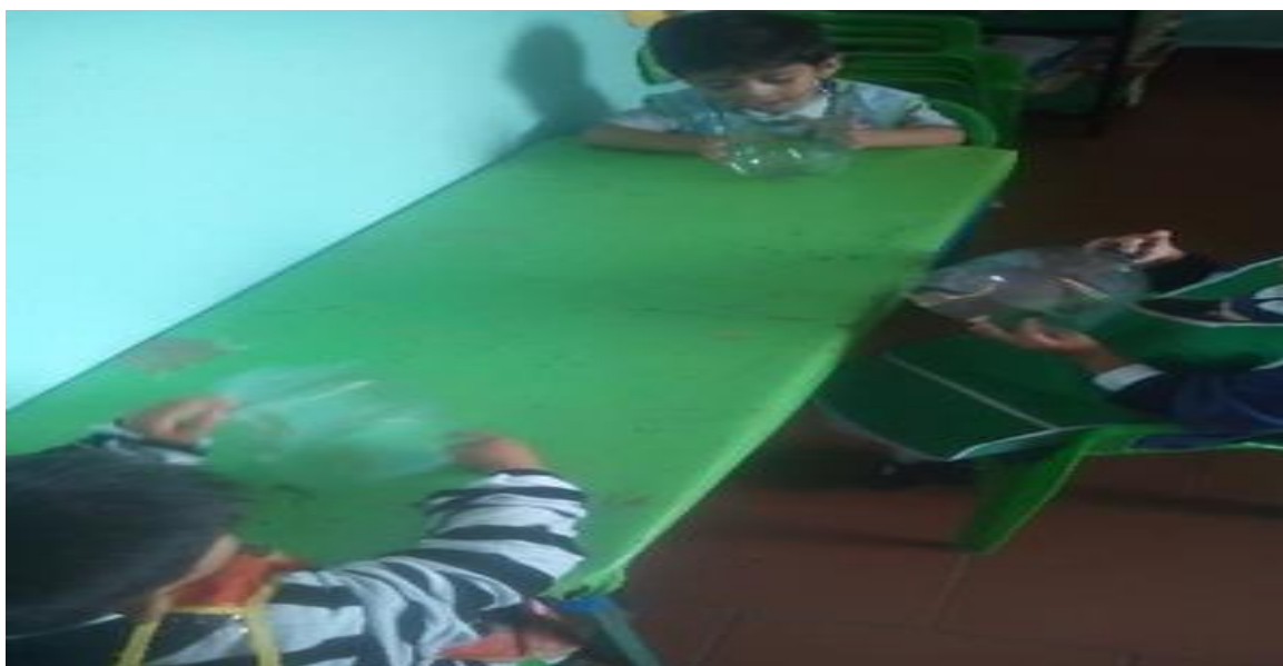
Creando un dulcero con botella