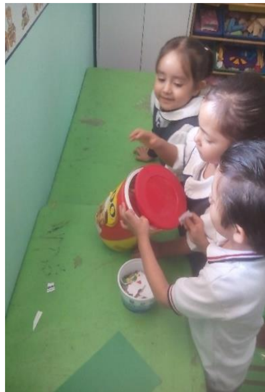
Decorando los botes de basura

Los alumnos se quedaron con ganas de seguir con actividades del tema conocimiento del mundo propusieron un germinado o una parcela, pero por falta de tiempo el proyecto se quedó en proceso.