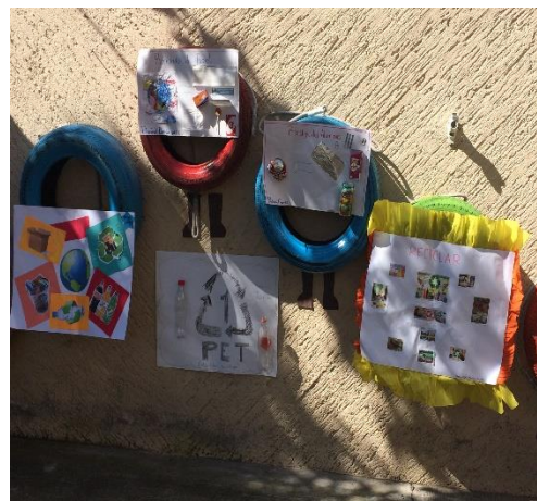
Láminas de cómo se debe reciclar

Les mencioné que realizaríamos una investigación para que comprendan lo que es la separación de basura, entonces los niños comenzaron a cuestionar: