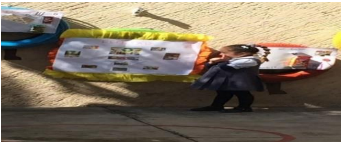
Expresando sus conocimientos

Los aspectos que desarrolle en los proyectos son del mundo natural donde los niños, reflexionen, indaguen, expresen sus ideas, busquen soluciones, conversen sobre problemas del medio ambiente, comprendan que forman parte de él aprendan a cuidarlo.