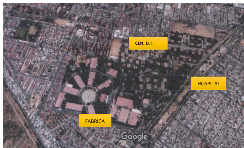
Foto1: Unidad Militar, CEN.D.I. Hospital y FA.V.E.

El Cendi presta servicio a todos los hijos de militares activos de la 1er Zona Militar y en general son militares en el activo que prestan sus servicios en el Hospital Militar de Zona y en la Fábrica de Vestuario y Equipo (FA.V. E)