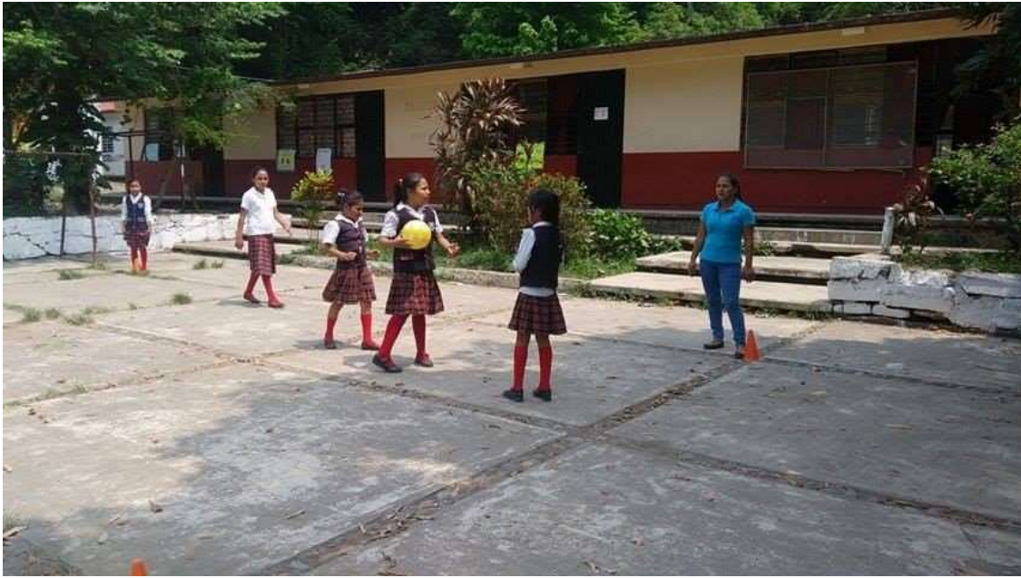
Poniendo en práctica los valores morales para una convivencia libre de violencia con la dinámica de: la búsqueda del chango