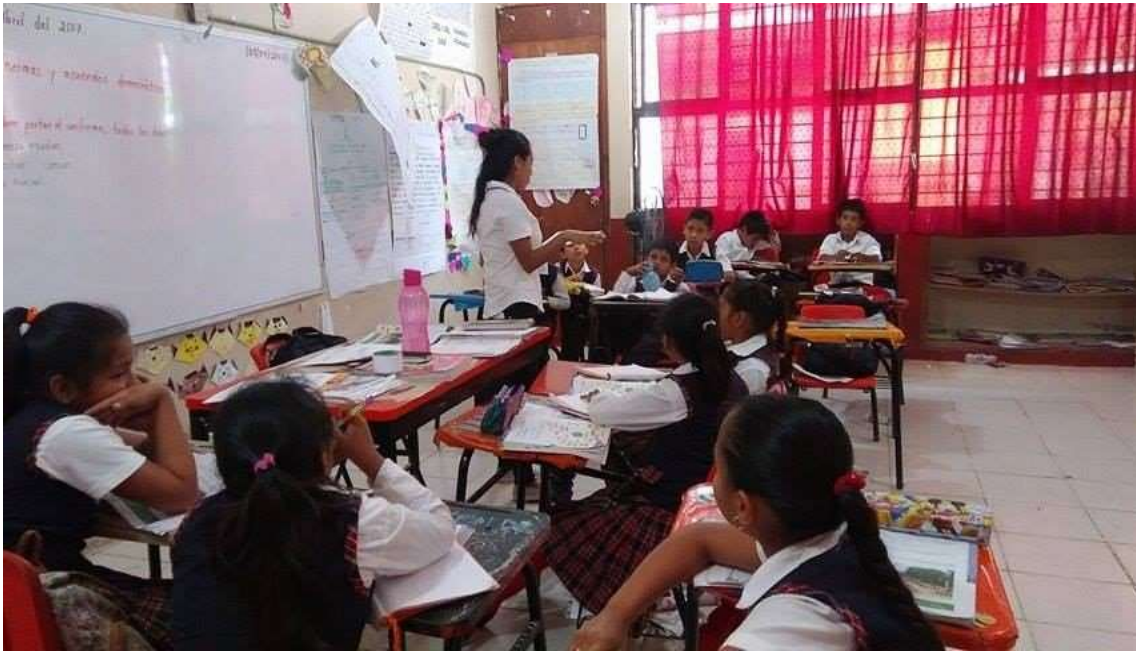
En esta imagen se muestra la presentación del proyecto.