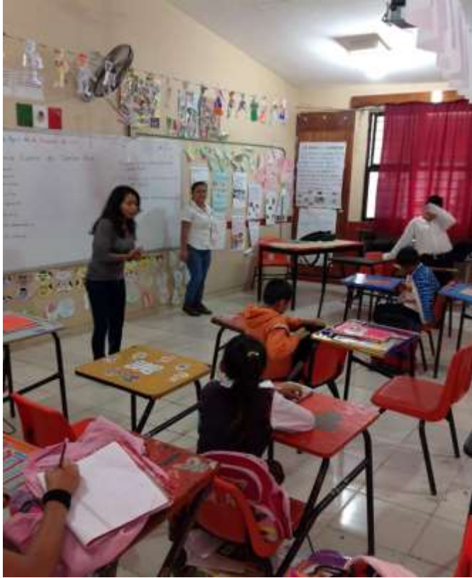
Promoción de los valores morales. morales.