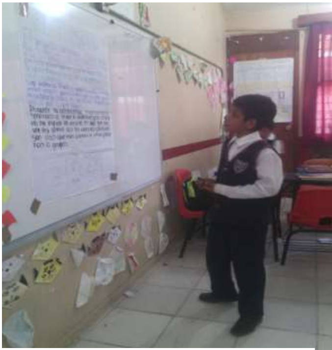
Presentación de los dilemas cotidianos.