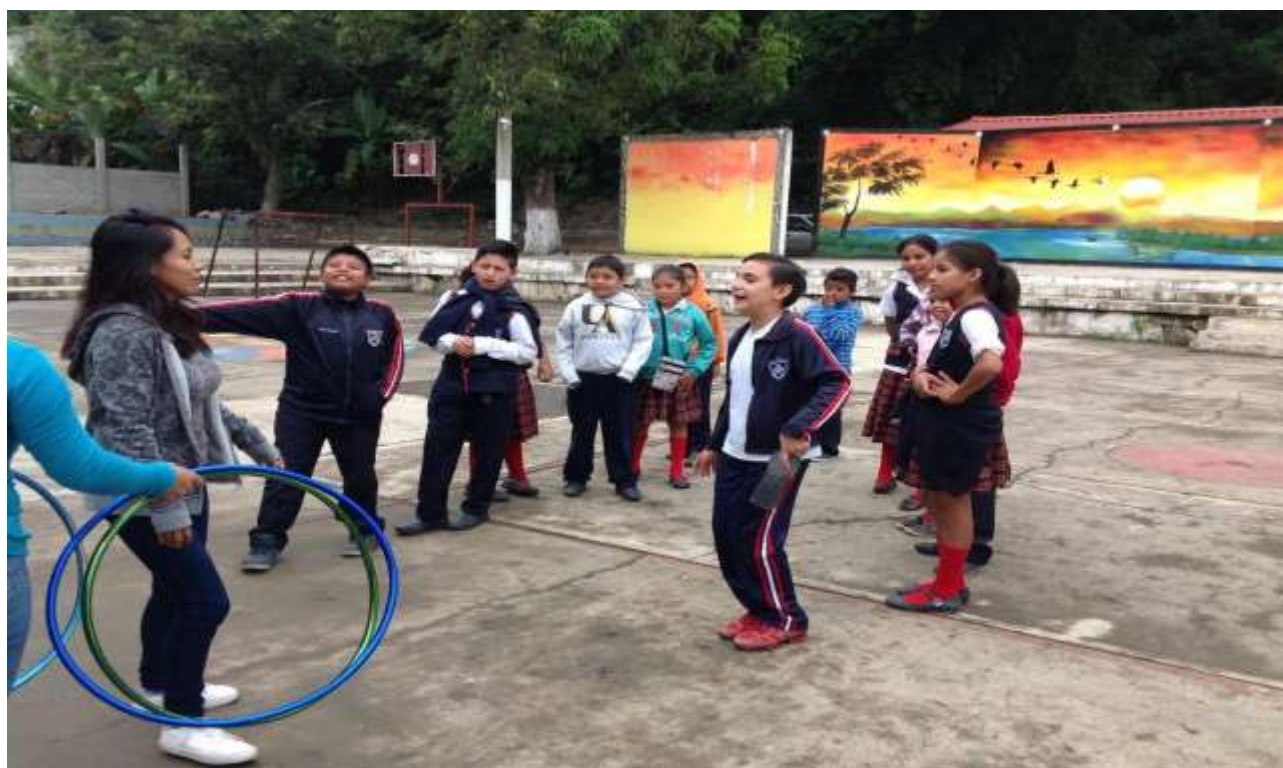
Trabajando dilemas para la reflexión de modo individual con la actividad: “salir del círculo”.