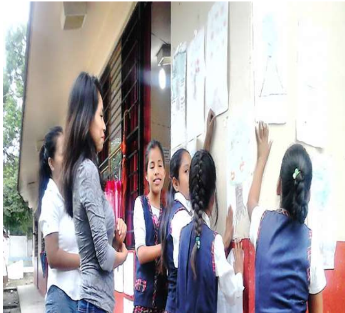
Explicación de conflictos personales y sociales.