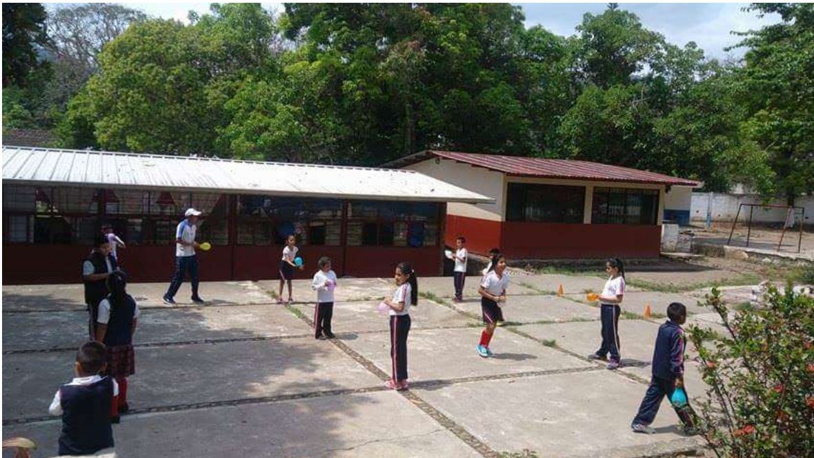
Juego las cuatro esquinas