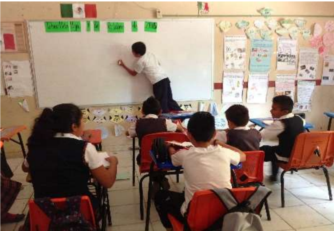
Representación de la resolución de conflictos.