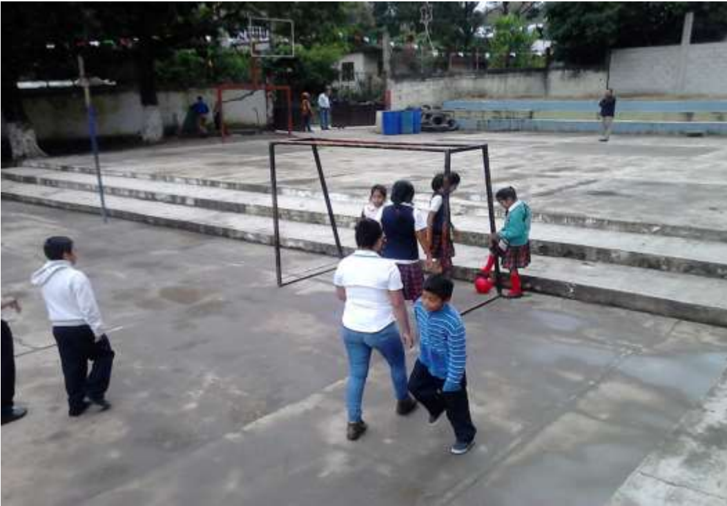
Realizando juegos cooperativos y a la vez poniendo en práctica los valores morales.