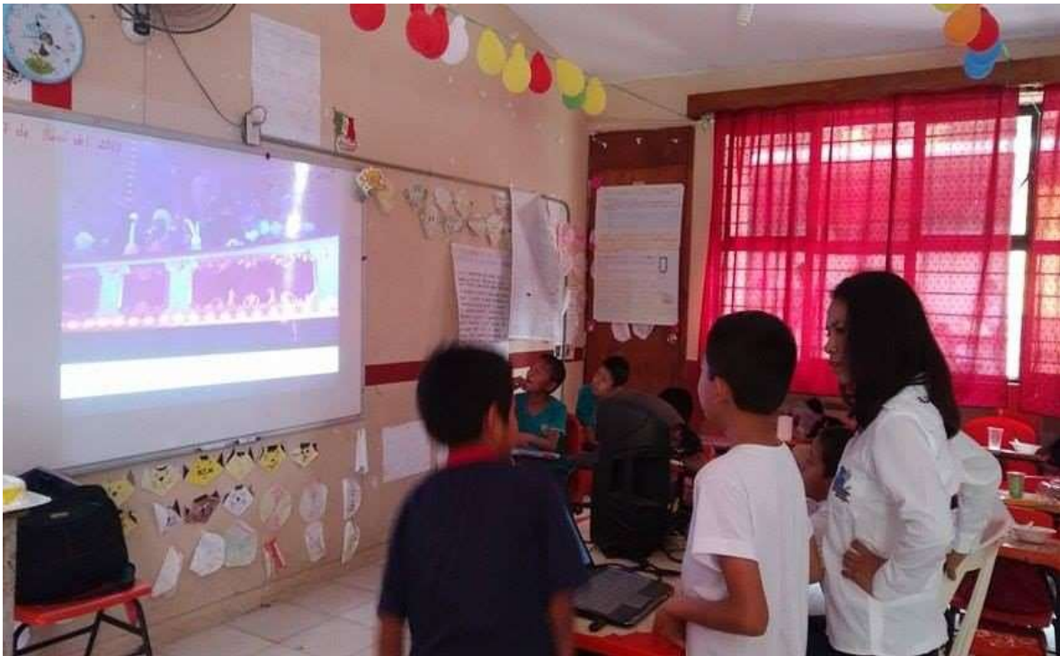
La videoconferencia sobre los valores.