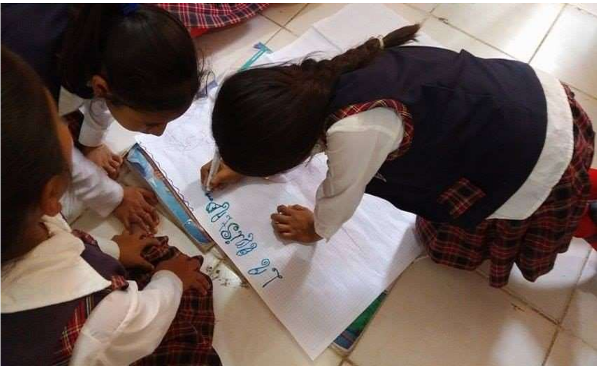
Temática del valor: Amistad