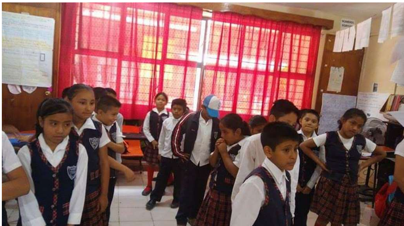
Representaciones de dinámicas de grupo