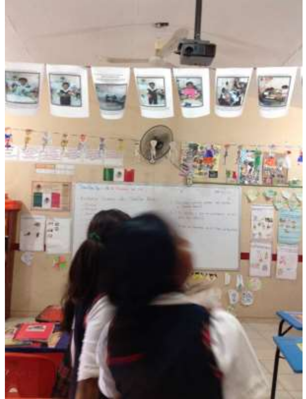
Reflexión de los valores