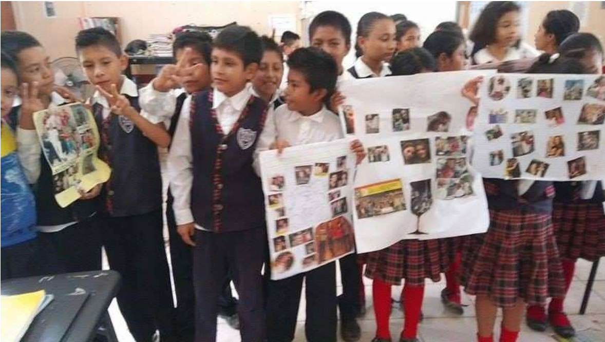
Temáticas de los valores.