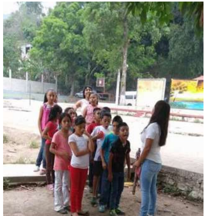
Juego de la suma de los sentidos