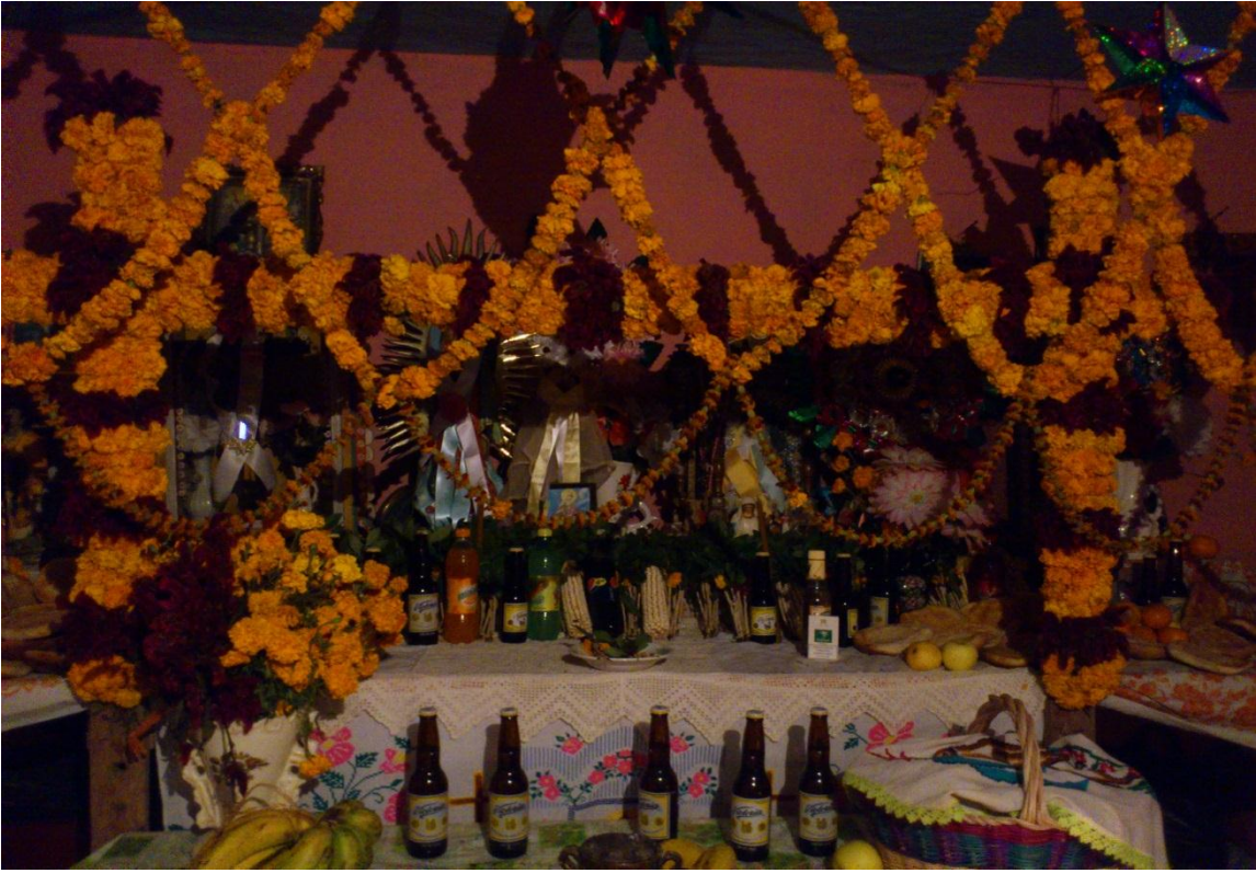
Tradición que se lleva a cabo en la comunidad de Piedra Ancha