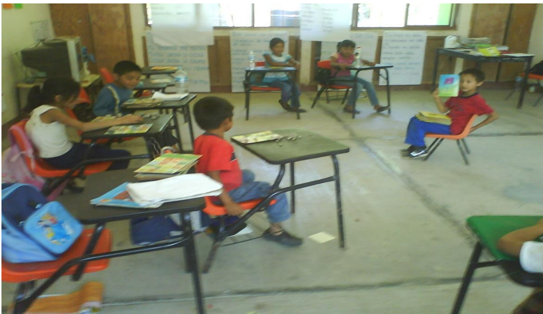
Juegos lúdicos que se desarrollan para acercar a la lectura el alumno además se utiliza la imagen para la predicción de imágenes