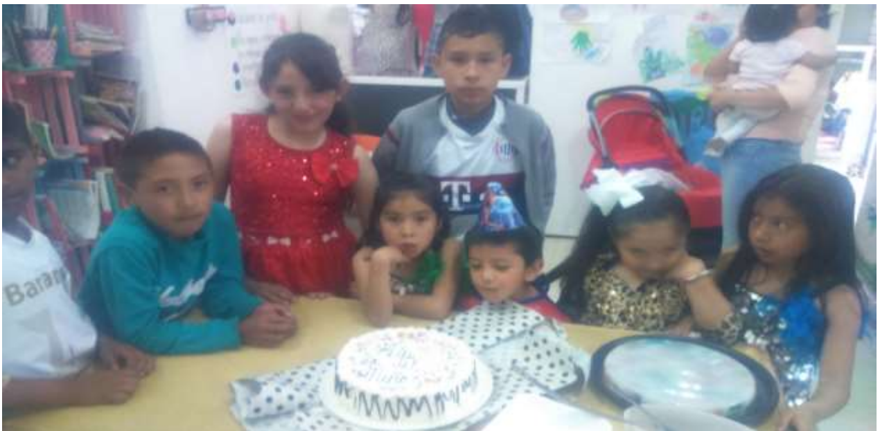
Festejo del día del niño.