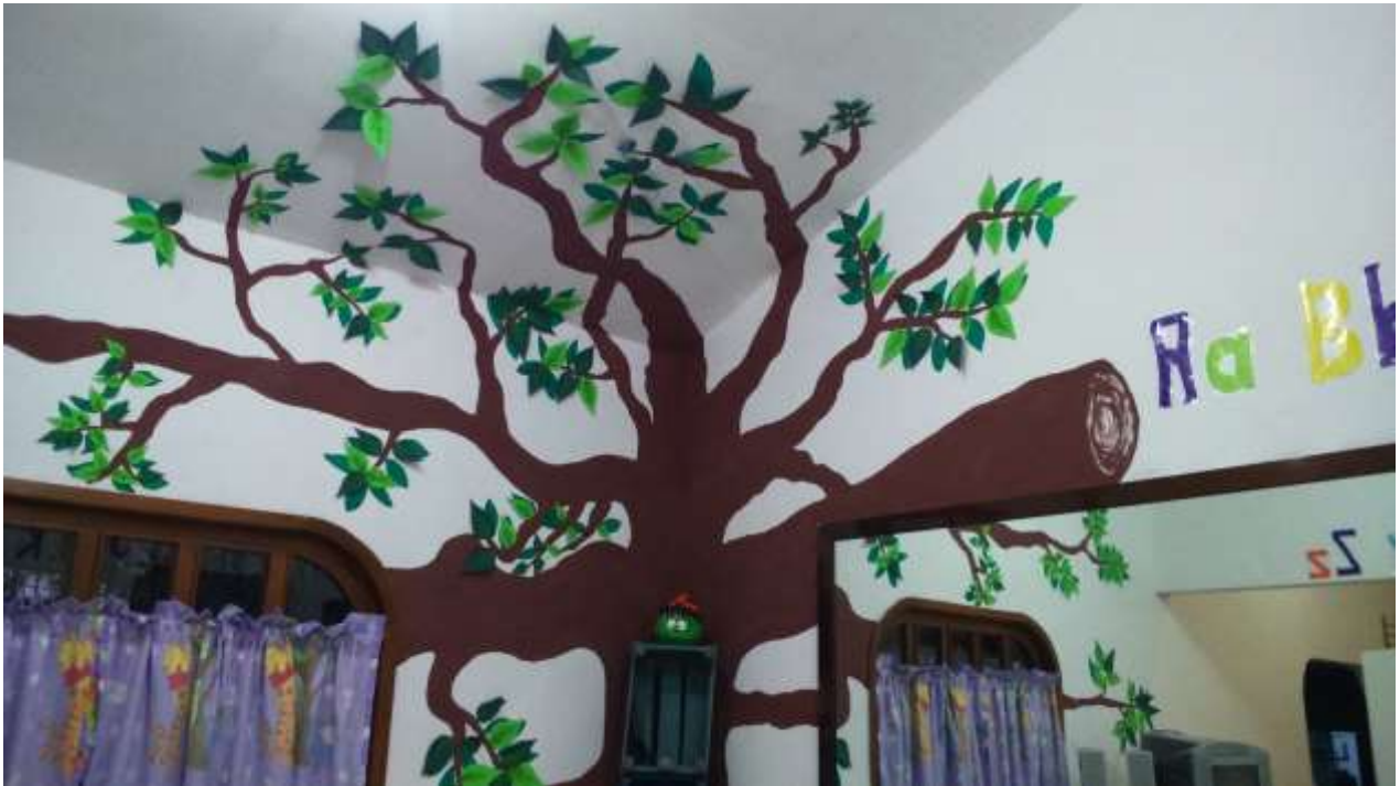
Árbol lector del aula principal.

El principal atractivo del aula es el árbol lector el cual se encuentra pintado en uno de los muros, techo y ventana, se dibujó y se tiñó su tronco y hojas para que el árbol pudiera tener mayor atracción y se viera más real.