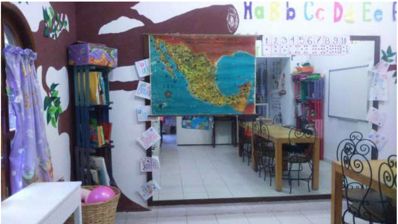
Aula principal donde se desarrollan la mayor parte de actividades

Además del aula donde se encuentra el árbol lector también se cuenta con una segunda aula la cual no se encuentra tan atractiva como la anterior, solo está pintada en color verde, cuenta con una mesa grande con sus sillas en la cual pueden atenderse varios alumnos, así como un escritorio y su pintarrón. Esta aula es ocupada por un profesor que imparte clases de Inglés avanzado los días viernes y sábado de cada semana, por lo tanto no interfiere en las sesiones del taller ya que éste se trabaja de lunes a jueves; hay otro salón más donde sólo lo llegamos a ocupar para realizar alguna actividad que requiera de mayor espacio del que contábamos en el aula principal, el espacio también cuenta con un sanitario que es de uso exclusivo para los niños del taller. También hay un espacio de área de recreo que es de mis hijas pero se puso a disposición de los asistentes al taller donde se encuentra una casa del árbol en el cual cruzan un puente para poder descender por una resbaladilla que además tiene un columpio y argollas.