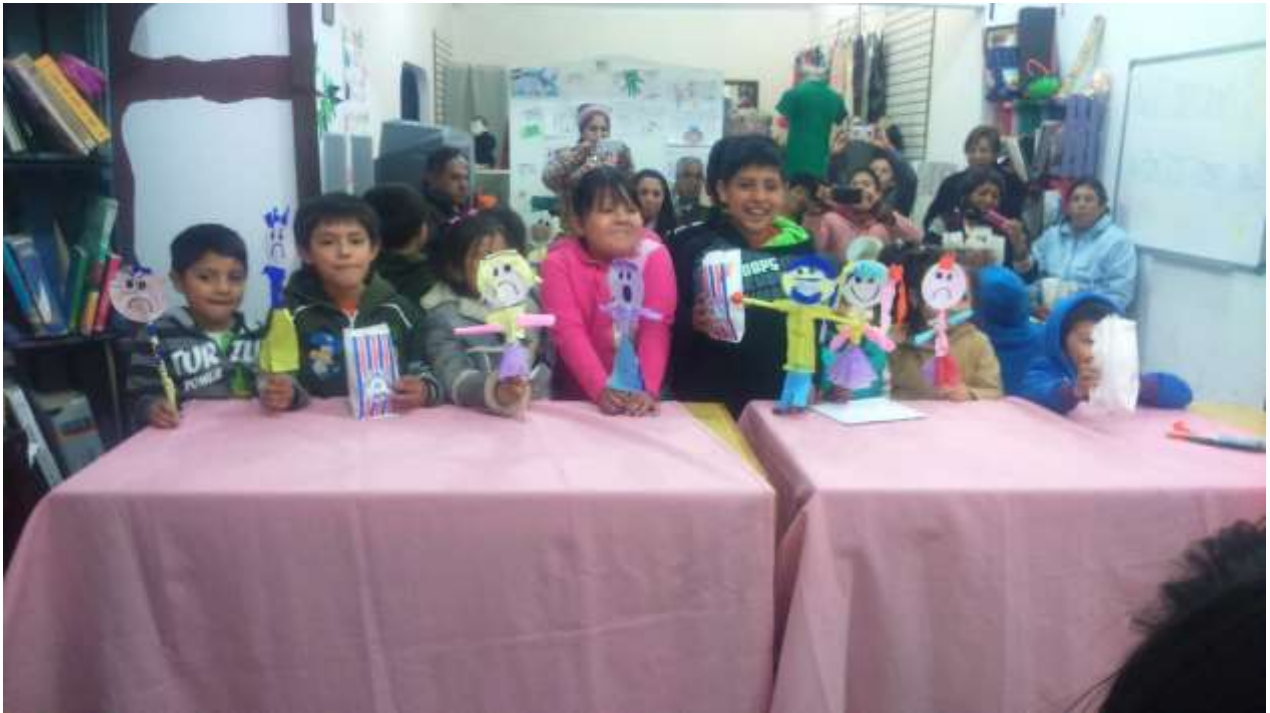
Presentación de la obra de teatro “Las emociones”, donde los niños elaboraron sus títeres.