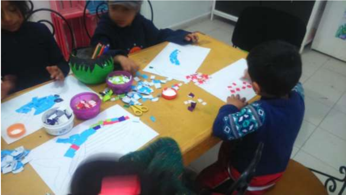
Niños preescolares trabajando en collage, después de haber desarrollado la lectura.