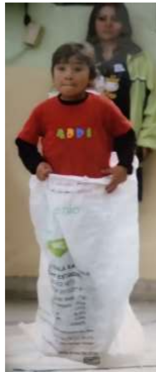
Actividades realizadas en el Jardín de Niños “Carlos Mérida”.