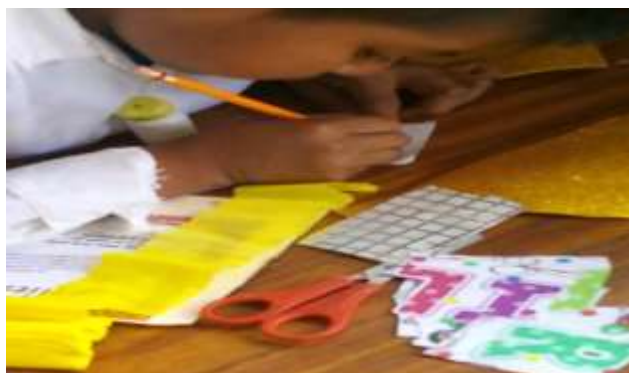
Anexo 11. Participación en diferentes juegos poniendo en práctica el respeto, trabajo en equipo.