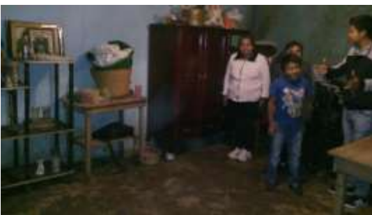
En la actividad 4. Organizándonos para la dramatización del tema-situación “Jorge es un niño introvertido y callado”.