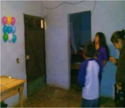
En la actividad 12, realizando la dinámica “Rompe el globo”