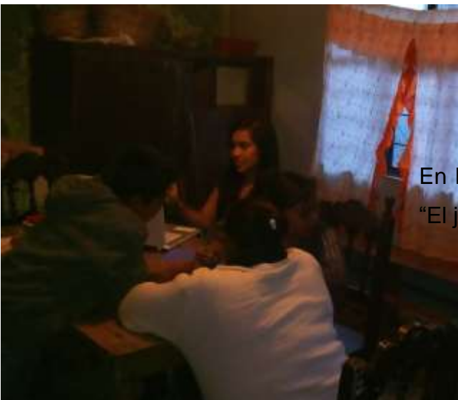
En la actividad 8, explicando la dinámica “El juego de los cubiertos”