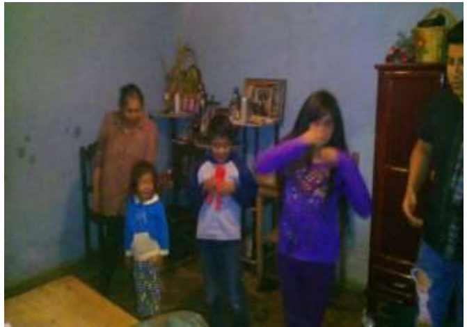
En la actividad 13, realizando la dinámica “El BUM”.