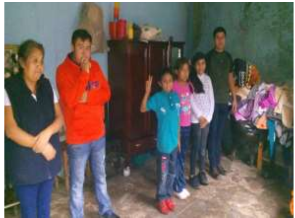
Dando indicaciones para la dinámica “Las olas”