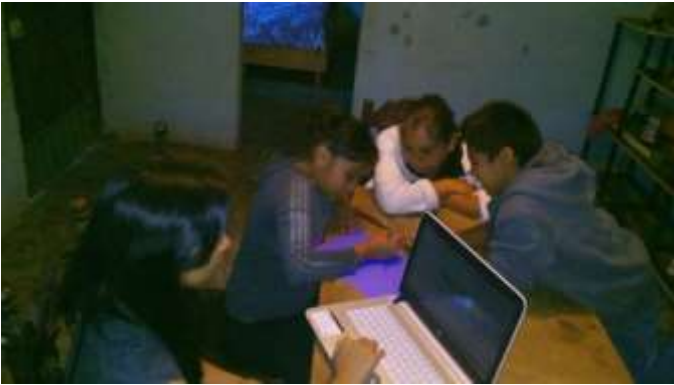
En la actividad 9, jerarquizando los valores compartidos.

Describiendo y explicando entre todos, el concepto de valor y virtud.