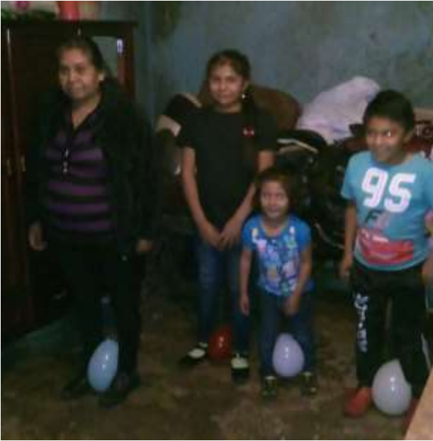
Llevando a cabo la dinámica “Salta con globos”

Cuestionando a la madre de familia sobre, ¿Cómo poner límites sin violencia?