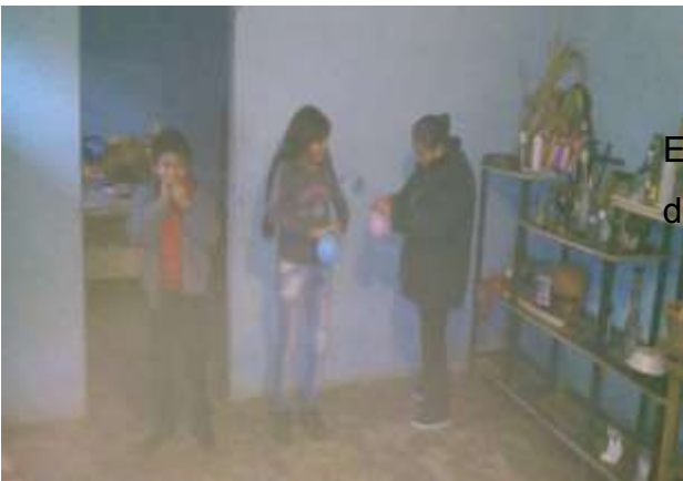
En la actividad 13, realizando la dinámica “Corre por el globo”.