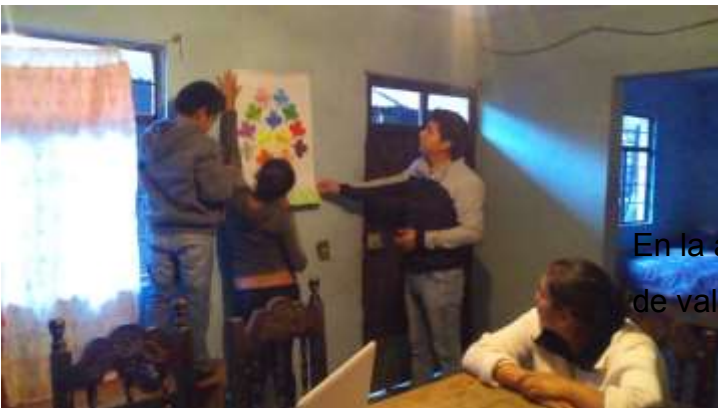
En la actividad 9, colocando el “Árbol de valores”.