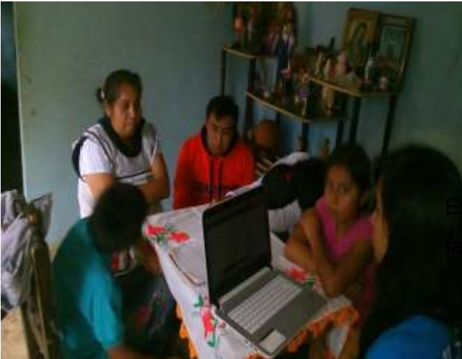
Explicando el tema “Autoridad familiar”.