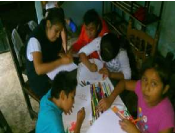
Resolviendo el cuestionario “Para reflexionar”.