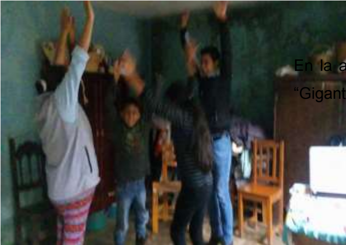
En la actividad 7, jugando a la dinámica “Gigantes y enanos”.

En la actividad 7, explicándoles la actividad de realizar una historia de una persona, dándoles algunas palabras para guiarse.