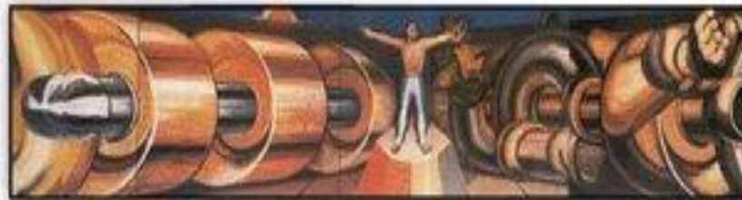
El hombre, amo y no esclavo de la técnica David Alfaro Siqueiros (1952)