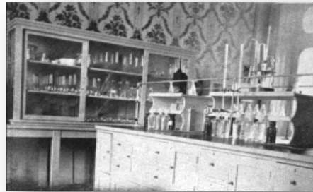
Laboratorio de la Escuela Nacional de Bacteriología.