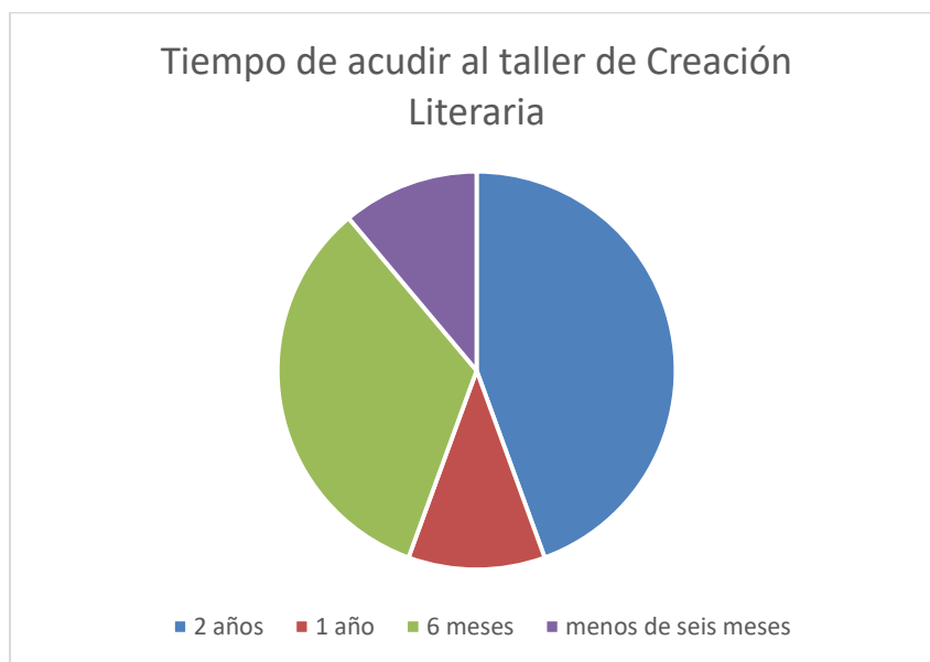
Elaboró: Mónica Durán Velasco.