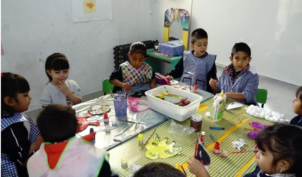
Creación de máscaras por el grupo de preescolar II.

permitió que construyeran el aprendizaje en colaboración con los otros tal y como lo plantea la teoría de Vigotsky “el aprendizaje se considera como la apropiación del conocimiento” (Bodrova E y Leong, 2004)