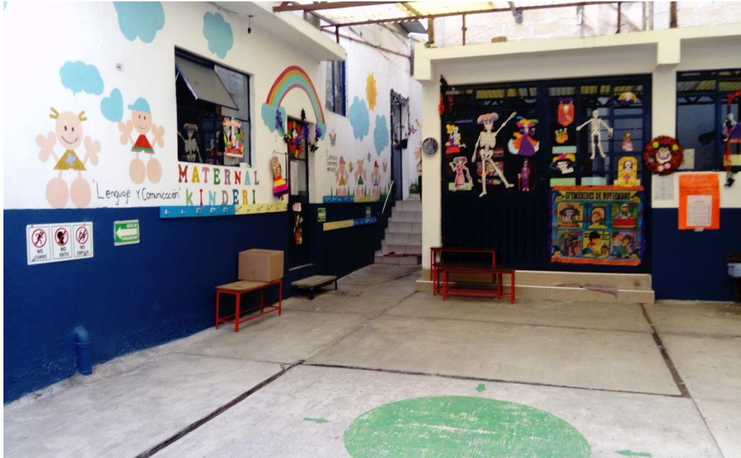
Vista del interior del Centro Infantil "Cometa"

El centro infantil Cometa actualmente cuenta con una matrícula de 37 alumnos seis de preescolar I, catorce de preescolar II y diecisiete de preescolar III, además de la directora hay tres docentes, una en cada grupo de preescolar.