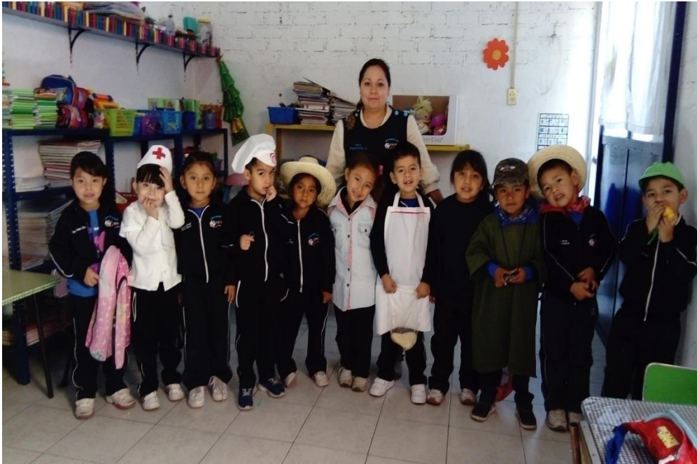
Grupo preescolar II

El grupo que atiendo es el de preescolar II, son quince alumnos entre los tres y cuatro años, la mayoría de los alumnos necesitan desarrollar las competencias relacionadas con el lenguaje oral, así como la regulación de emociones para mejorar su interacción dentro del ambiente escolar, ya que con frecuencia realizan rabietas y usan las agresiones para resolver conflictos, esto ocurre dentro y fuera del ambiente escolar.