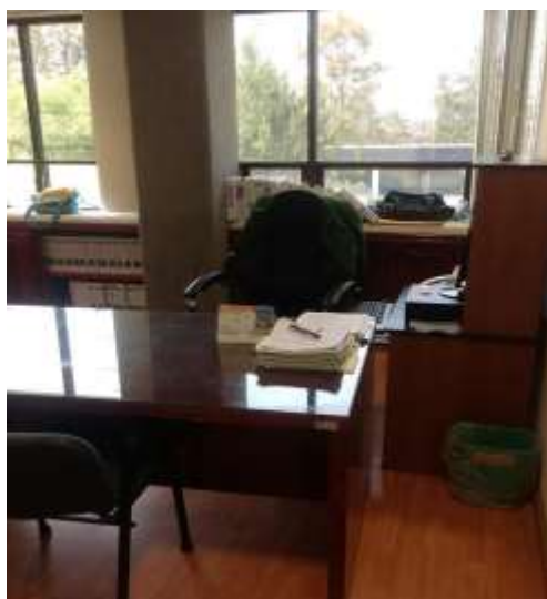
Fig. 3: Se observa que no se encuentra la Titular de esta área