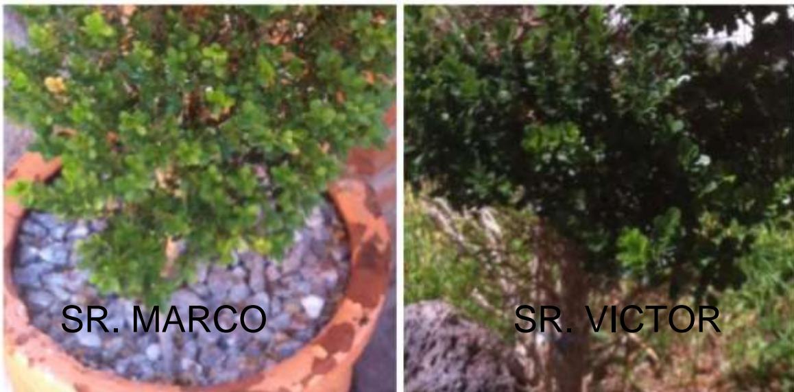
Fig. 14: Arbolitos plantados por los trabajadores en su hogar