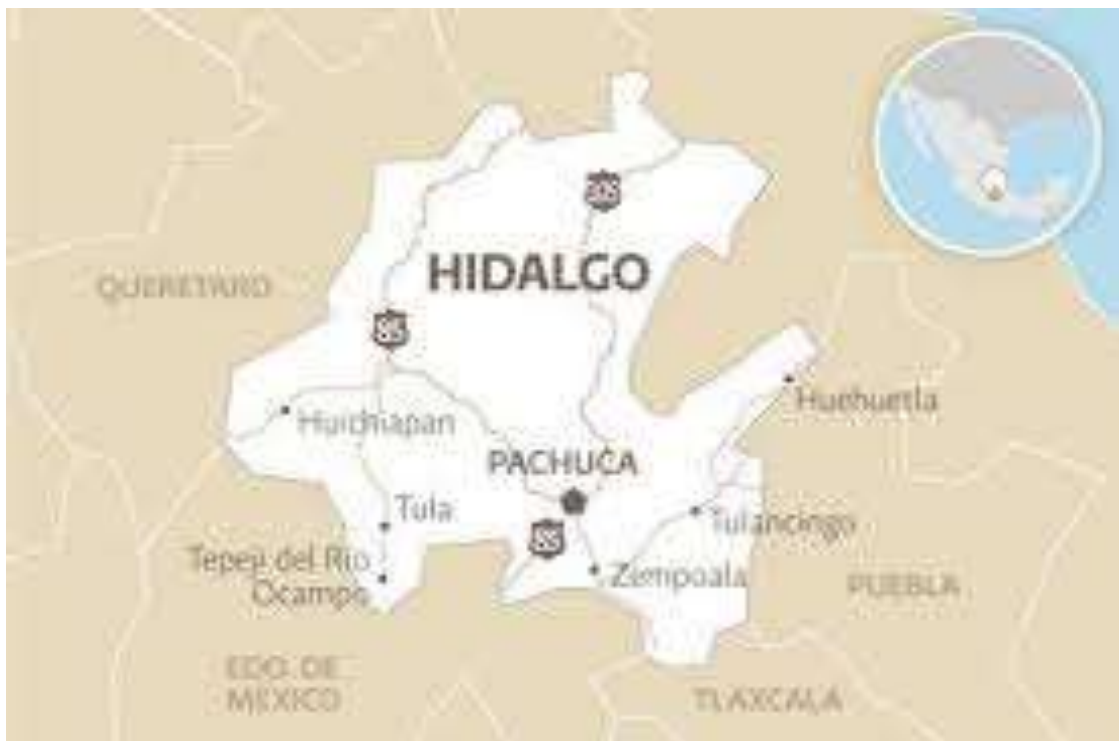
Fig. 1: Se muestra que tula está ubicada al noroeste de la Ciudad de México