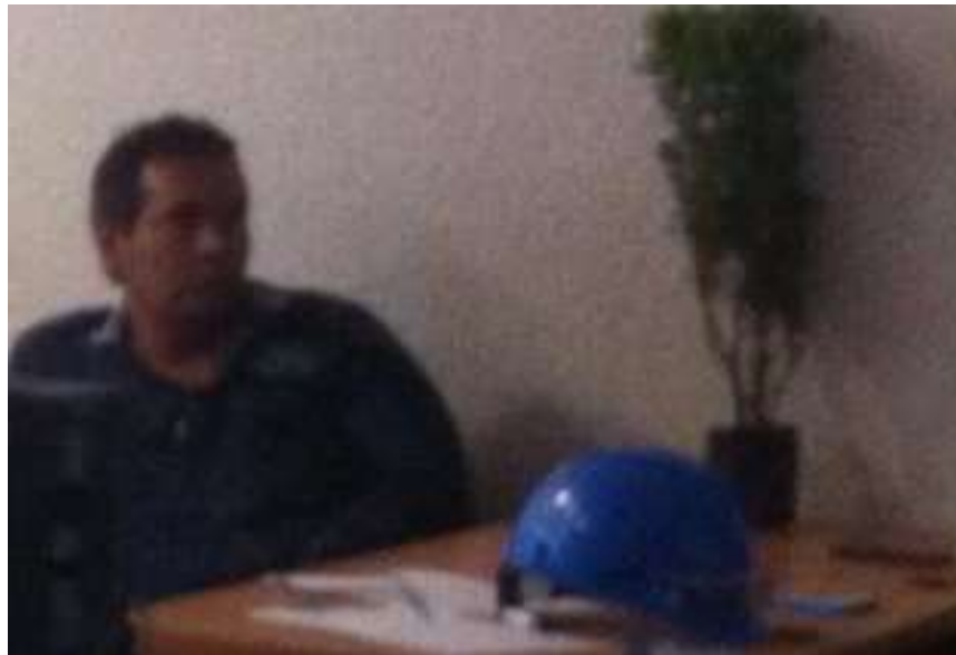
Fig. 10: Se les dio el Árbol el cual lo plantarán en su casa