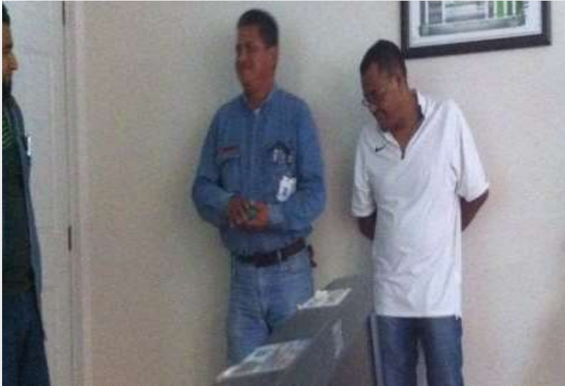
Fig. 11: Se les preguntó el cómo se relacionan los 2 conceptos