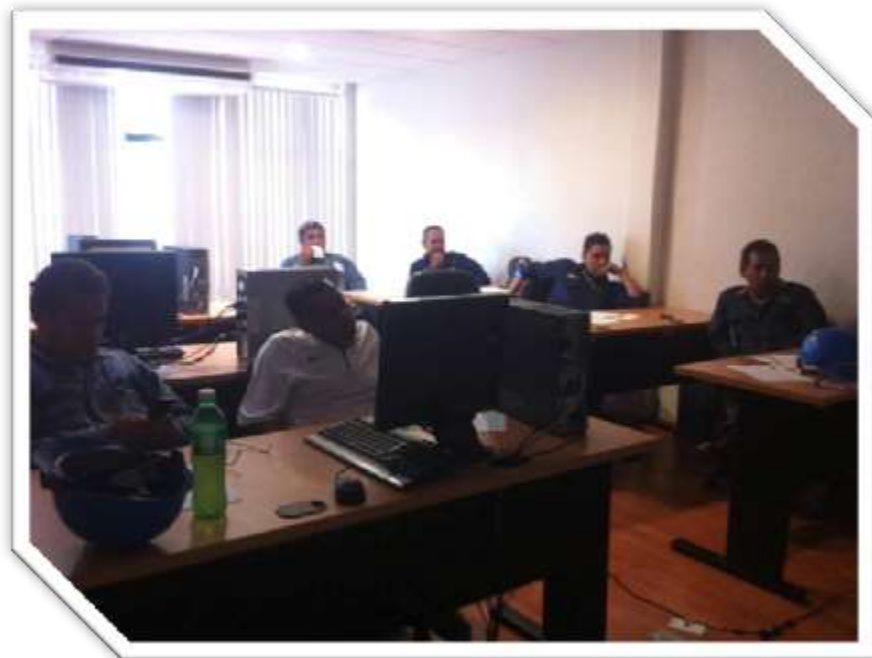
Fig. 8: Interesados en la película, platicando su punto de vista