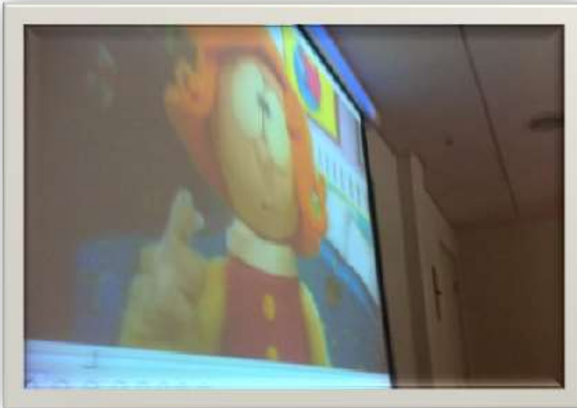
Fig. 12: Los Trabajadores toman decisiones