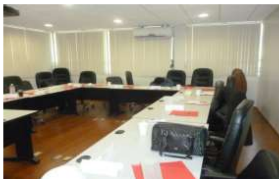
Fig. 4: Las aulas son muy pequeñas para que los trabajadores estén tanto tiempo sin ventilación