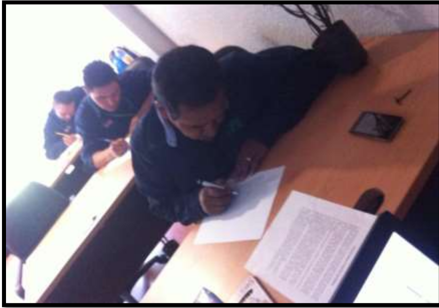
Fig. 13: Realizan una entrevista