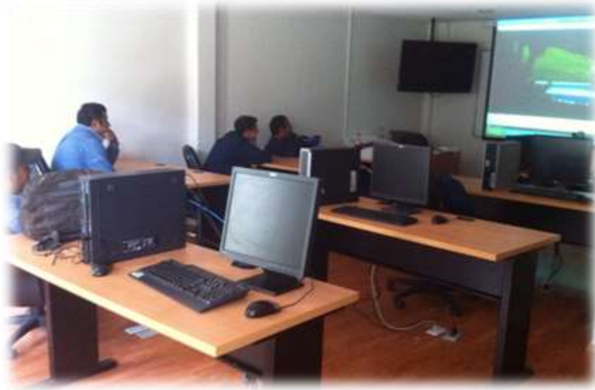
Fig. 7: Viendo película “HOME”