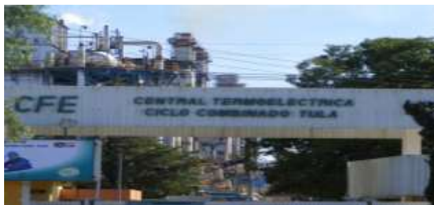
Fig. 2: La entrada a Comisión Federal de Electricidad Ciclo Combinado