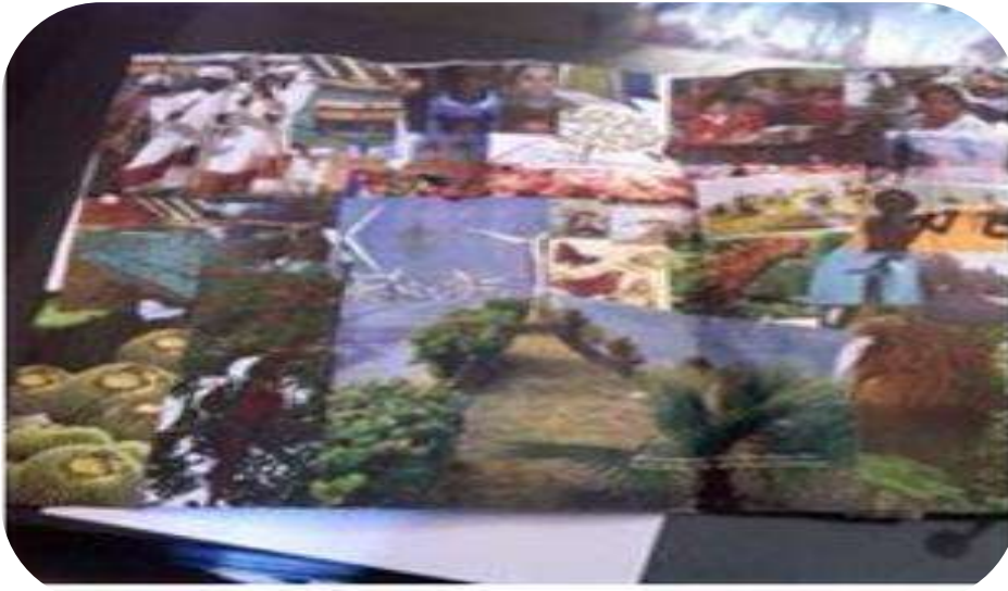
Fig. 9: EL collage donde realizaron el planeta que quieren estar