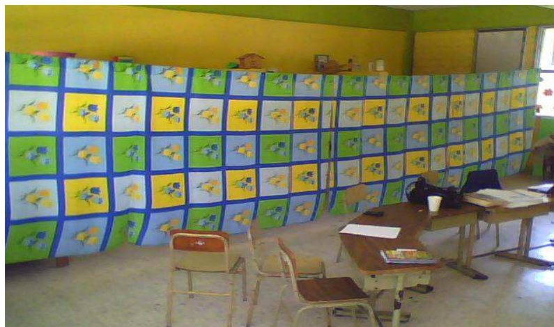
Taller de habilidades básicas de autonomía personal DESPUES de la intervención