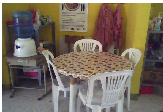
Área de la cocina