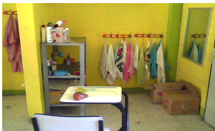
Área de higiene personal