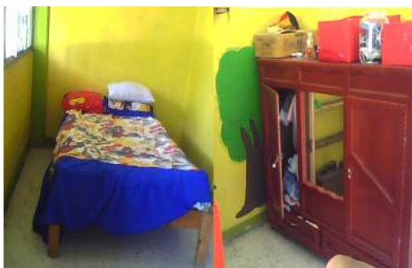
Área de la recamara