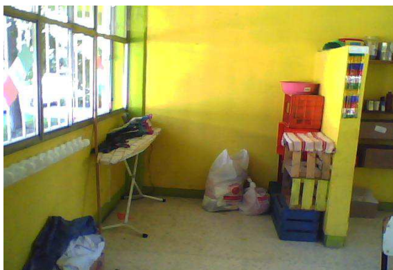
Área de recamara