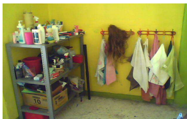
Área de higiene personal