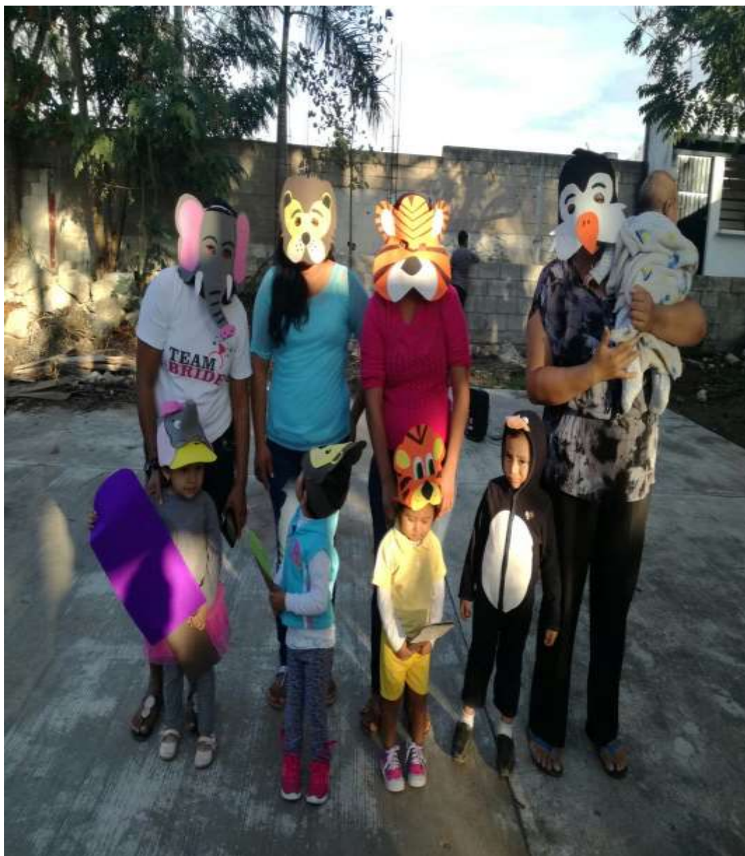
REPRESENTACIÓN DE LOS ANIMALES DEL CIRCO, SESIÓN 4