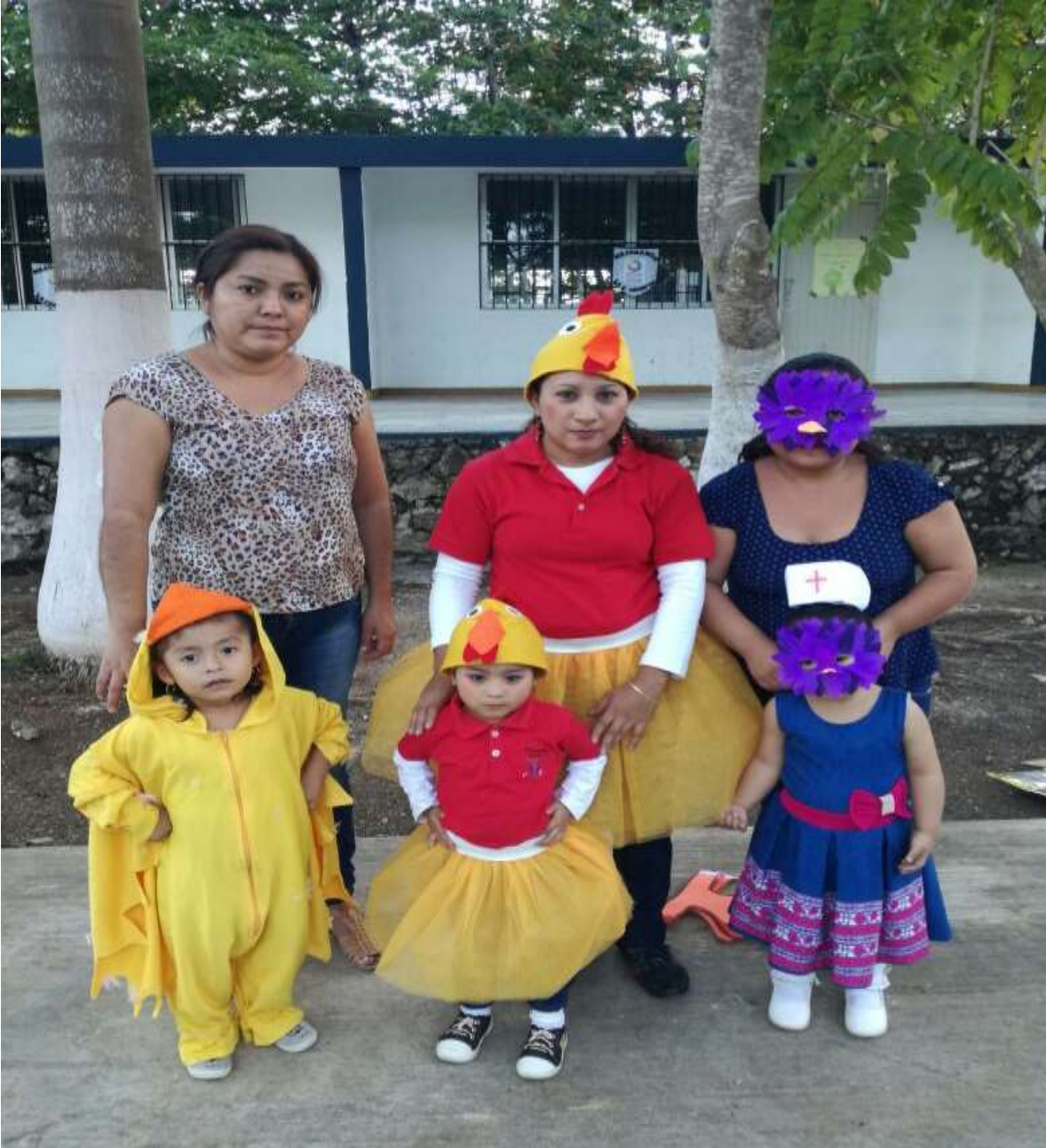
REPRESENTACIÓN DE LOS POLLITOS, SESIÓN 6: EL JUEGO DE LOS POLLITOS