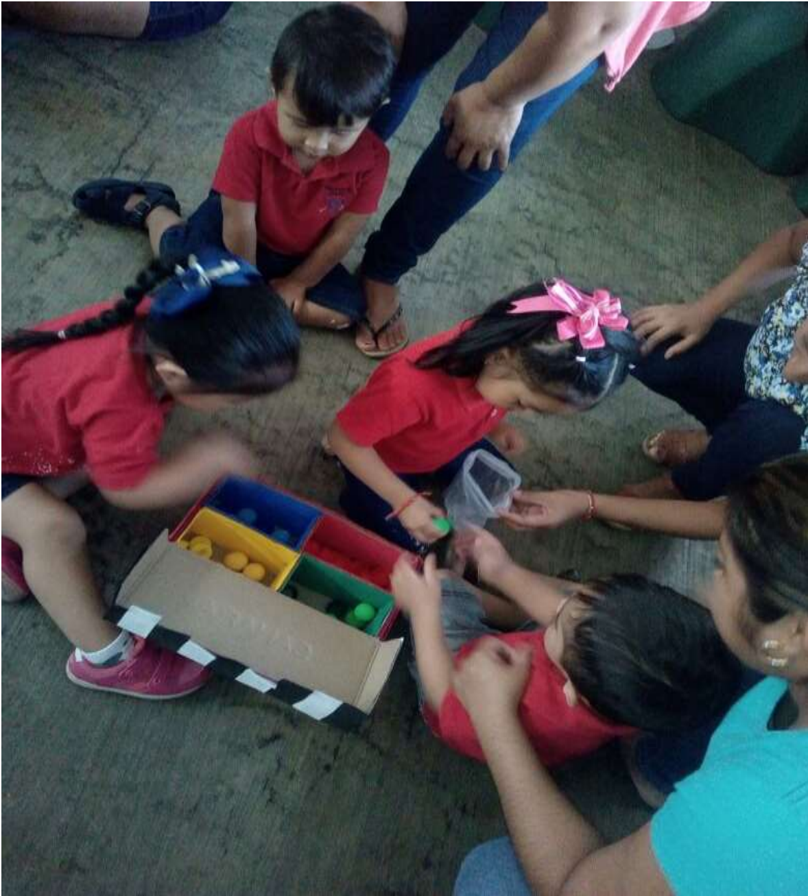
DESARROLLO DE ACTIVIDADES DE LA SESIÓN 7: LA CAJITA DE SORPRESAS