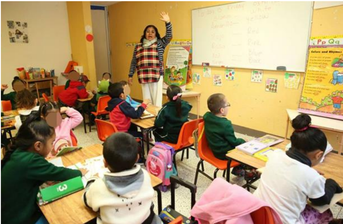
Fotografía 3. Salón de clases de Preescolar 2.

La mayor parte del tiempo que estuve en el CENDI apoyé a este grupo de preescolar 2 en el cual detecté muchas necesidades pero me pareció que lo que más demandaban era sobre lo referente a el ámbito emocional, en general son niños muy vulnerables a tantas situaciones de todo tipo, y observé que no saben identificar las emociones y, por lo tanto, la expresan de una forma errónea, porque dicen estar felices pero no sonríen o están tristes pero están de agresivos, claramente podemos imaginar que el ambiente no es favorable para cubrir todas las necesidades que tiene cada niño y que como adultos estamos obligados a satisfacer.