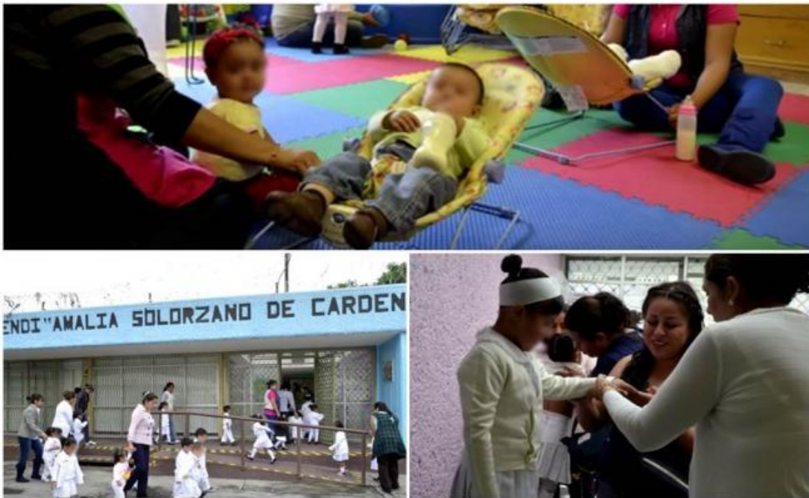
Fotografía 2. Fachada del CENDI dentro del Centro.

El Centro de Desarrollo Infantil (CENDI) “Amalia Solórzano de Cárdenas” está ubicado dentro del “Centro Femenil de Reinserción Social Santa Martha Acatitla” (CFRSSMA).