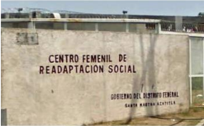
Fotografía 1. Fachada del Centro Femenil

Primeramente asistí a una plática en el INCAPE dentro de la Subsecretaría del Sistema Penitenciario, tuve la oportunidad de elegir el Centro al que prestaría mi servicio. Después de tres semanas recibí la llamada de que había sido aceptada y recogí mi hoja de aceptación, me presenté al Centro y asistí de lunes a viernes en un horario de 10:00 a 14:00 horas, posteriormente el horario se amplió por motivo de cubrir las horas de vacaciones y en total realicé 552 horas de servicio social.