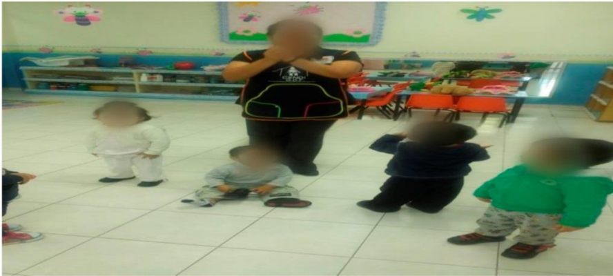
Foto 1 se muestra como empiezan a socializar con sus pares por medio del juego y del canto

que el menor tuviera mayor control de su cuerpo a si se lograron avances en su caminata, correr manteniendo el equilibrio, saltar bajar y subir por ellos mismos escaleras.