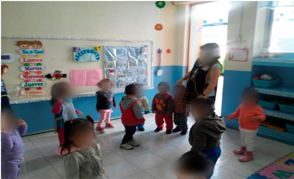
Foto 3 : en la imagen se puede observar el que los niños socializan con otros niños y docentes de diferentes grupos.