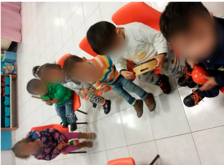
Foto 2 se observan los ensayos al realizar la orquesta