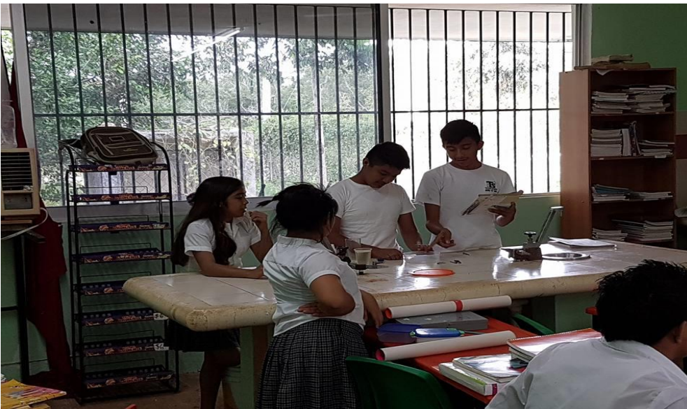
Observación de la clase de química de los alumnos de tercer grado.