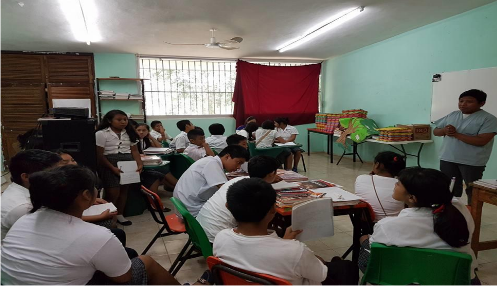
Observación de la clase de los alumnos de primer grado.