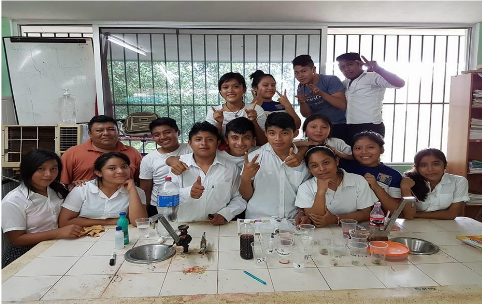
Alumnos del tercer grado en la clase de química.