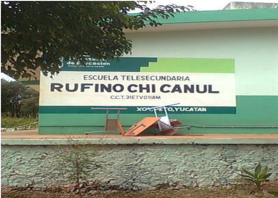
Nombre de la escuela telesecundaria de Xoy