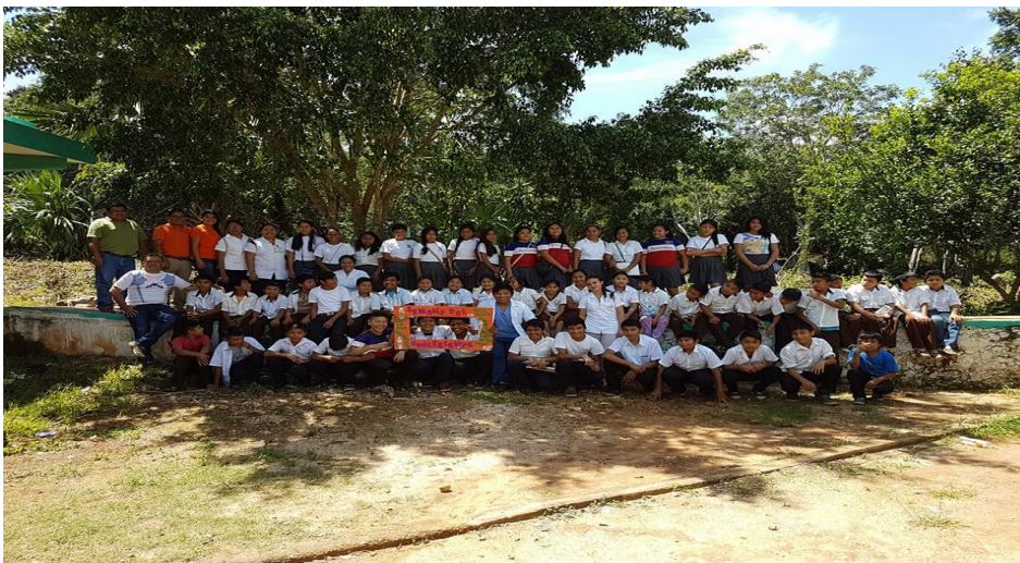
Alumnos y docentes de la escuela telesecundaria "Rufino Chi Canul" de Xoy, Peto.